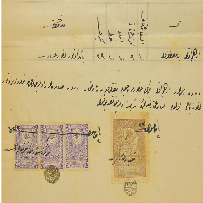
Ek 1: Rüşdiye Muallimliği için Kullanılan Ehliyetnâme Örneği.

BOA, MF.MKT. 1029-34, R. 2 Eylül 1323/M. 15 Eylül 1907.