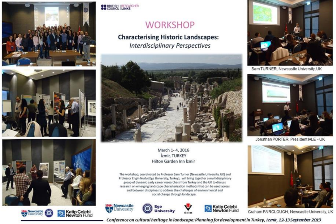
Şekil 1. Tarihi Peşaj Karakterizasyonu: Disiplinlerarası Perspektifler Çalıştayı, İzmir