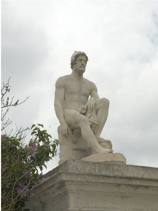
Resim 2. Theophile Bra (1822) "Odysseus".

so'nun adası besili koyunlar, karidesler, bil-lur gibi akan dereler, yemyeşil bir orman ve nefis bir gün batımı, etrafında en az Kaly-pso kadar güzel diğer perilerle dolu cennet gibi bir yerdir. Yunancada tüm adların bir anlamı olduğu gibi, Kalypso adı da "Kalyp-tein" (saklamak, alıkoymak) fiilinden türetil-miştir. Odysseus'u adasında görür görmez deliler gibi âşık olur ve o andan itibaren sonsuza kadar alıkoymak, hapsetmek, saklamak ister. Kalypso Odysseus'u yedi yıl boyunca alıkoymak (Graves, 2012, 954).