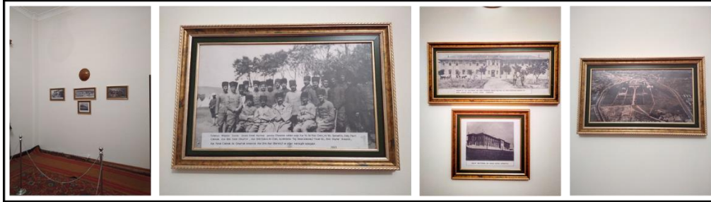
Şekil 15. Atatürk Odası'nda masanın karşısındaki duvarda yer alan çerçeveler (24.12.2019).

Masanın tam karşısındaki duvarda ise Atatürk Odası envanterine giren “Zenith” marka eski bir ahşap duvar saati ve binaya ait çerçeve içinde dört adet eski fotoğraf bulunmaktadır. Bu fotoğraflardan en soldaki Sakarya Meydan Muharebesi öncesi Fevzi Çakmak ve genelkurmay grubunu gösterirken, ortadaki çerçevede Ziraat Mektebi'nin Milli Mücadele döneminde çekilmiş bilinen bir fotoğrafı yer almaktadır. En alttaki fotoğrafta, Ziraat Mektebi'nin başka bir açıdan çekilmiş görüntüsü yer alırken, en sağdaki fotoğrafta ise üç katlı Meteoroloji Genel Müdürlüğü Binası'nın havadan çekilmiş siyah beyaz bir fotoğrafı bulunmaktadır (Şekil 15).