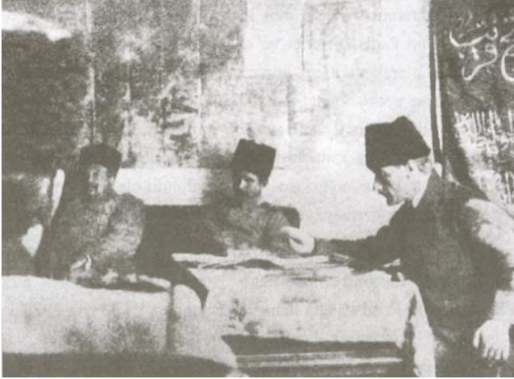
Şekil 3. Mustafa Kemal Paşa, Ankara Ziraat Mektebi'ndeki karargâhında (Mart 1920) (Kaynak: Özkaya, Y. 2003. Gazi Mustafa Kemal: Atatürk'ün Hayatı. AKDITYK Atatürk Araştırma Merkezi. Ankara: Başak Matbaacılık Ltd.Şti. s.205).

“Büyük odadaki manzara gözlerimin önündedir. Mustafa Kemal Paşa, lambasının ışığı altında kâğıtları karıştırır. Miralay İsmet Bey mütemadiyen dolaşır. Cami Bey, dizinde kâğıtlarla konuşmak fırsatını beklerdi. İçişlerinde meseleler gittikçe çoğalıyordu.” (Adıvar, 2012:159) diyerek dönemin buhranlı anlarını ifade etmektedir (Şekil 3).