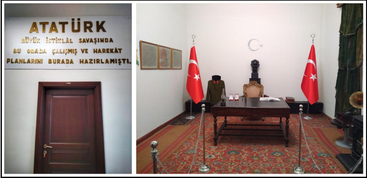
Şekil 11. Atatürk Odası'nın girişindeki yazı ve odanın içinin görünümü (24.12.2019).