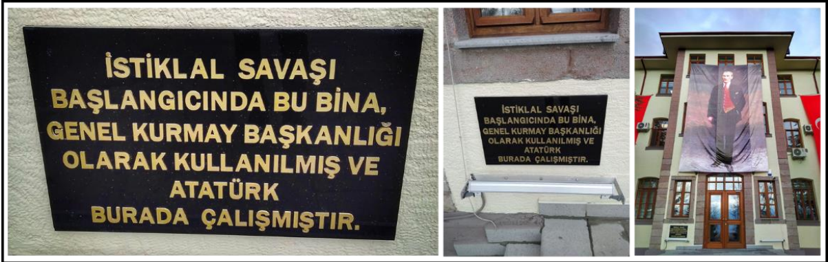
Şekil 10. Binanın giriş kapısının solunda yer alan levha (24.12.2019).

Atatürk'ün masasının arkasında, duvara bitişik konumda bir büstü bulunmakta, büstün üst kısmında duvarda da ay yıldız yer almaktadır. Odanın köşelerinde ise birer Türk bayrağı ve soldaki Türk Bayrağı'nın yanında da mareşal üniformasının bir kopyası vardır (Şekil 11). Masanın sol tarafındaki duvarda, çerçeve içinde üç adet Osmanlıca harita bulunmakta, bu üç haritanın solunda da " Milli Mücadele Başında Yabancı İşgal Kuvvetleri "ni gösteren renklendirilmiş bir Türkiye haritası yer almaktadır (Şekil 12). Masanın sağında, iki pencere arasındaki duvarda ise çerçeve içinde " Misak-ı Milli Haritası ", " Türk İstiklal Harbi'nde Ayaklanma Bölgeleri "ni gösteren harita ve bu ayaklanmaların tarih ve süreleri ile ilgili bilgilendirme levhası yer almaktadır. Bu haritanın önünde, duvar kenarında bacasız bir soba ve bu sobanın sol yanında da sehpa üzerinde küçük bir gramofon bulunmaktadır (Şekil 13).