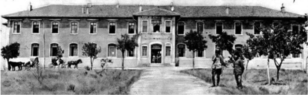
Şekil 2. Milli Mücadele döneminde Ziraat Mektebi binası.

Çubuk Çayı'na bakan Keçiören tepelerinin yamacında 19. yüzyıl sonlarında inşa edilen Ziraat Mektebi binası (Şekil 2); ilk başta iki katlı taştan bir bina olarak, tuğla çatı örtülü, zemin ve merdivenleri ahşap olarak düzenlenmiştir (Aysal, 2007; Basın-Yayın Genel Müdürlüğü, 1977; Önder, 1970).