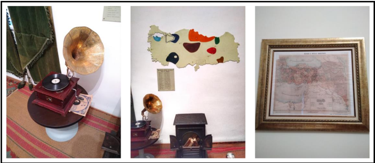
Şekil 13. Atatürk Odası'nda masanın sağ tarafındaki duvarın görünümü (24.12.2019).

Atatürk'ün masası üzerinde; sol tarafta bir gaz lambası, gaz lambasının arkasında da Atatürk'e ait İstiklal Madalyası ile Altın İmtiyaz Madalyası'nın birer kopyası bulunmaktadır. Masanın ortasında