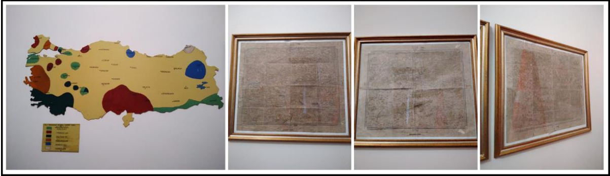
Şekil 12. Atatürk Odası'nda masanın sol tarafındaki duvarın görünümü (24.12.2019).