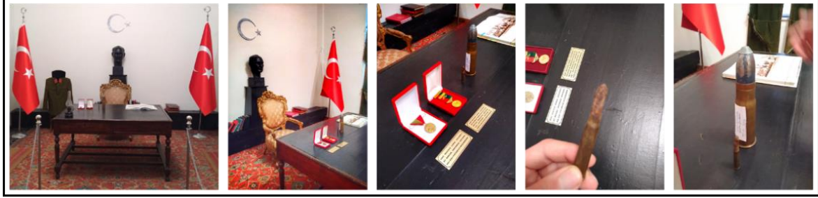
Şekil 14. Atatürk Odası'nda masanın üzerinde yer alan materyaller (24.12.2019).

ise 25 Aralık 2018 tarihinde Ziraat Mektebi bahçesinde bulunan Milli Mücadele döneminden kalma top mermisi ile paslanmış ve patlamamış bir mermi kovani yer almaktadır (Şekil 14). Masanın sağ tarafında ise “Fotoğraflarla Düünden Bugüne Meteoroloji” kitabında, Ziraat Mektebi'nin eski fotoğrafının yer aldığı sayfalar açık bir şekilde bırakılmıştır.