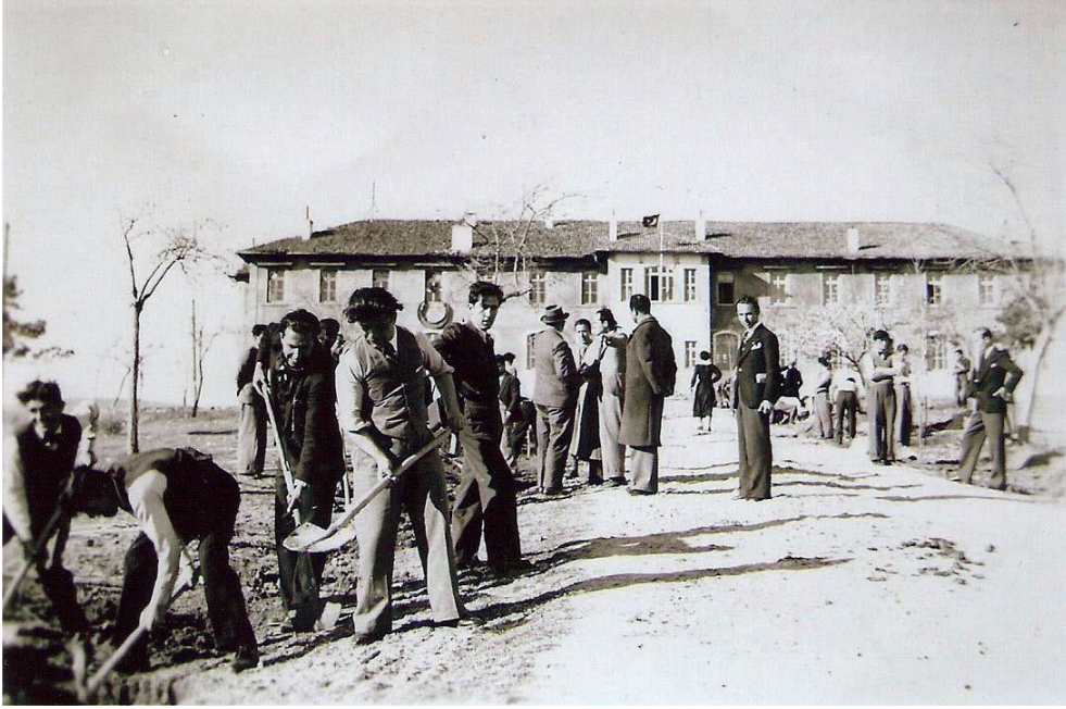
Şekil 4. 1937'deki kapsamlı tadilatın önce Ziraat Mektebi, Ziraat Fakültesi öğrencilerinin bahçe düzenleme çalışmaları, 1936.

Mustafa Kemal Paşa ve arkadaşlarına, 27 Aralık 1919'da kapılarını açan ve Kurtuluş Savaşı boyunca da Genelkurmay Başkanlığı binası olarak kullanılan Ziraat Mektebi binası; cumhuriyetin ilanından sonra bir müddet Tarım Bakanlığı'nca çeşitli işlerde kullanılmıştır (Şekil 4). 1925 yılında kurulan ilk Meteoroloji dairesi, 1930 yılında burada Kuzey İstasyonu'nu kurmuştur (Önder, 1970).