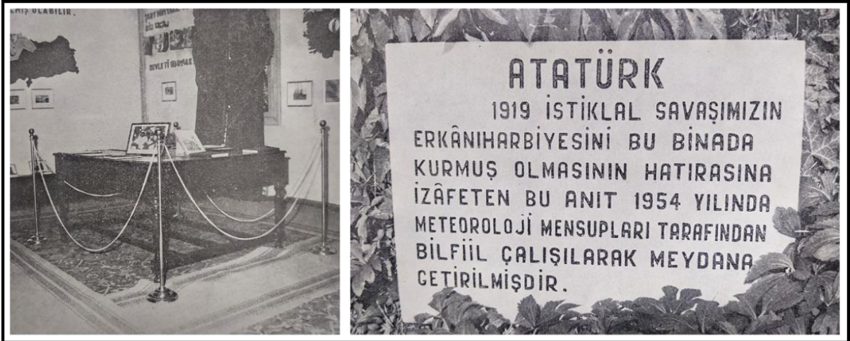
Şekil 7. Meteoroloji İşleri Genel Müdürlüğü binasındaki Atatürk Odası ve Meteoroloji İşleri Genel Müdürlüğü binası önündeki Atatürk büstünün altında yer alan mermer kaide (1970'ler) (Kaynak: Önder, M. 1970. Atatürk Evleri Atatürk Müzeleri. Ankara: Türk Tarih Kurumu Basımevi. s.56-57).

Gördüğü tadilat sonrası orijinalliği ve tarihi dokusu bozulan eski Ziraat Mektebi, yeni Meteoroloji İşleri Genel Müdürlüğü binasında; sadece Atatürk'ün çalışma odası "Atatürk Odası" olarak düzenlenmiş ve burada küçük bir müze oluşturularak anısı yaşatılmaya çalışılmıştır (Şekil 7). Ayrıca binanın önündeki bahçeye meteoroloji mensupları tarafından 1954 yılında bir Atatürk büstü ve mermer kaide yerleştirilerek binanın tarihi kimliğine vurgu yapılmıştır (Önder, 1970) (Şekil 7).