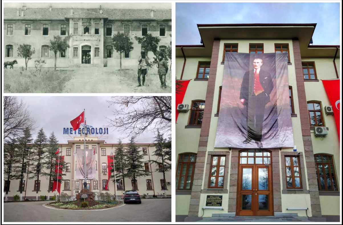
Şekil 9. İki katlı Ziraat Mektebi Binasının sonradan eklenen üçüncü katındaki uyumsuz pencereler (24.12.2019).