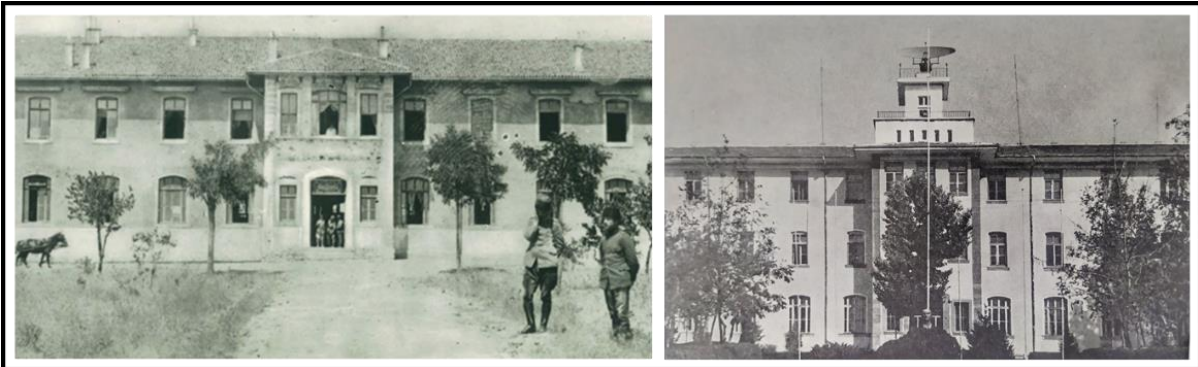
Şekil 5. İki katlı Ziraat Mektebi Binası ve Üç katlı Meteoroloji Genel Müdürlüğü Binası. (Kaynak: İnan, A. 2009. Atatürk Hakkında Hatıralar ve Belgeler. 8. Baskı. Ankara: Türkiye İş Bankası Kültür Yayınları. s.305; Önder, M. 1970. Atatürk Evleri Atatürk Müzeleri. Ankara: Türk Tarih Kurumu Basımevi. s.55).

1895-1897 yılları arasında taştan ve iki katlı olarak inşa edilen tarihi yapı, 1937 yılında büyük bir tadilat ve onarım görmüştür. Onarım sırasında ahşap döşemeler betonarmeye çevrilmiş, odaların durumu değişmiş ve iki katlı olarak inşa edilen tarihinin üzerine bir kat daha ilave edilmiştir (Şekil 5). 1952 yılında da Devlet Meteoroloji İşleri Genel Müdürlüğü, bütün daireleri ile birlikte buraya taşınmıştır (Önder, 1970) (Şekil 6).