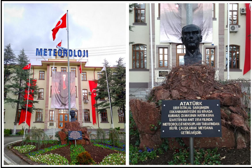
Şekil 8. Meteoroloji İşleri Genel Müdürlüğü binası önündeki Atatürk büstü, bayrak direği ve büstün önündeki pano (24.12.2019).

Günümüzde binanın önünde bir kayanın üzerinde Atatürk büstü yer almakta, büstün arkasında üç katlı bina uzunluğunda bir bayrak direği yükselmektedir (Şekil 8). Etrafı daire şeklinde düzenlenen ve peyzaj çalışması yapılan Atatürk büstünün önündeki siyah panoda, sarı renkli harflerle: "ATATÜRK 1919 İSTİKLAL SAVAŞI'MIZIN ERKANI HARBİYESİ'Nİ BU BİNADA KURMUŞ OLMASININ HATIRASINA İZAFETEN BU ANIT 1954 YILINDA METEOROLOJİ MENSUPLARI TARAFINDAN BİLFİL ÇALIŞILARAK MEYDANA GETİRİLMİŞDİR." yazmaktadır (Şekil 8).