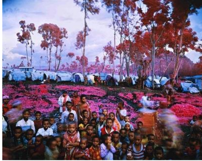
Şekil 7. Richard Mosse, Kayıp Eğlence Bölgesi, 2012, Fotoğraf

Savaşın parçaladığı bölgelere bir fotoğrafçı ve film yapımcısı olarak odaklanan Mosse, çatışmaların hem manzara hem de insanlar üzerindeki etkisini sinematik görüntülerle yakalamaya çalışmıştır. Uygulamalarını belgesel gazetecilik ve çağdaş sanat pratikleri ilişkisiyle konumlandırmış ve temsil edilmeyeni temsil etme uğraşına girmiştir. Amerikan-Irak savaşı ve Doğu Kongo'da yaşanmış çatışmalar, Mosse'nin sanat pratiklerinin çıkış noktası olmuştur. 2010-11 yıllarında "Infra" serisi ile ele aldığı Doğu Kongo'nun savaşçıları, insanlarını ve manzaralarını büyük ölçekli ve renkli fotoğraflarla sanat alanına taşımış ayrıca bu seri ile tanınır hale gelmiştir (Richard Mosse, Erişim Tarihi: 09.12.2020).