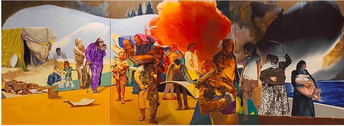
Şekil 9. Temur Köran, Göç, 2015, TÜYB, 150x410 cm.

Figürlerin ön plana çıktığı resimleri ile tanınan ve bu alanda önemli işlere imza atan Türk sanatçı Temur Köran, tarih boyunca küresel bir sorun haline gelmiş olan göç problemine dikkat çeken ve bunu eserlerine yansıtan önemli bir sanatçıdır. Resimlerinde göç olayının insanlar üzerinde meydana getirdiği acıyı, dramı vurgulamak amacıyla abartılı biçimlere ve rakursi denemelerine yer verdiği görülmektedir (Üner, 2018: 20).