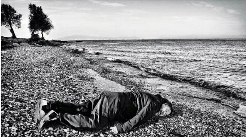
Şekil 1. Ai Weiwei. Aylan Bebek Temsili Fotoğraf. 2016.