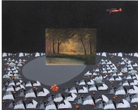
Şekil 11. Kezban Arca Batıbeki, Gece, t.ü.k.t., 2019

Fotoğraf, yağlı boya, kolaj ve karışık teknikleri bir arada kullanarak farklı şekillerde düşünsel ve algısal yönünü ortaya çıkaran Kezban Arca Batıbeki, nesnel dünyada var olan gerçeklikleri öznel dünyası ile bütünleştirerek yapıtlarını oluşturmaktadır. Yurt içinde ve yurt dışında yağmış olduğu seyahatler sırasında farklı bulduğu objeleri toplayarak özgün düşünce yapısını tasarımları aracılığıyla izleyicilerle buluşturmaktadır. Dolayısıyla eserlerindeki zengin anlatım dili izleyicileri, kurgulamalar üzerinden eleştiri ve sorgulamalar yapacakları bir yola dahil etmektedir (Uzunoğlu, 2019). Bu açıdan diğer sanatçılar gibi Batıbeki’nin de “Vaad Edilmemiş Topraklar” serisinde yer alan çalışmaları, göç sorunsalına örnek olması bakımından dikkat çekmektedir. Batıbeki’nin çalışmaları plastik açıdan incelendiğinde, Mosse ve Köran’ın resimlerindeki renk anlayışının aksine daha renksiz bir tavrın olduğu görülmektedir (Şekil 11).