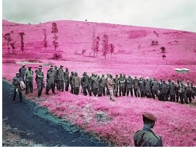
Şekil 8. Richard Mosse, Albay Soleil'in Çocukları, Kuzey Kivu, Doğu Kongo, 2010

Mosse'nin, askeri alan için geliştirilen kızılötesi filmi kendi amacı dışında kullanması, savaşın renksiz yönünü ve insanların çekmiş olduğu sıkıntıları renkli bir ortamda sunmasını sağlamıştır. Bu da küresel bir sorun olan savaşlara, çatışmalara ve bunların sebebiyet verdiği göç olayına eleştirel bir bakış açısı geliştirmemize imkân tanımıştır.