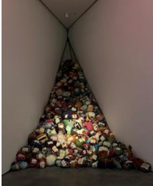
Şekil 6. Yu Wen Wu, Ayrılıklar-Aidiyetler, 2018

Savaşlar, şiddetler ve işkenceler göçe sebebiyet verirken Wu'nun sanatsal üretim süreçlerinde küresel iklim değişikliklerinin getirdiği sorunlar, yerinden olma, asimilasyon gibi konular da çalışmalarında belirleyici alanlar olmuştur.