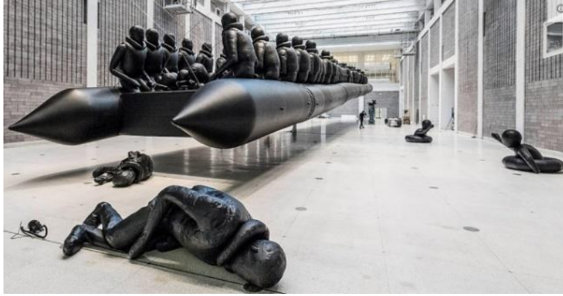
Şekil 2. Ai Weiwei, Yolculuk Yasası, Enstalasyon, 2016, 70 m., Ulusal Galeri, Prag

Mülteci kamplarına giderek, mültecilerle ilgili çalışmalar üzerine yoğunlaşan sanatçı bu konuda “Yolculuk Yasası” isimli (Şekil 1), enstalasyon çalışması ile aktarmak istediği mesajı doğrudan topluma hissettirmeye ve vurgulamaya çalışmıştır. Kendi tasarladığı ve yüzleri olmayan 258 mülteciyi, havada asılı olan bot ile bütünleştirmiş ve mülteci kamplarını ziyaretlerden edindiği deneyimlerle kıyafet detaylarını da kendine has tasarımlarla düzenleyerek enstalasyon sanatı ile sergilemiştir (Yolculuk Yasası, Erişim Tarihi: 02.11.2020). İnsanların ait oldukları ortamlardan kopup farklı sistemlere alışmaya çalışması ve farklı kültürlerle etkileşime girmesi durumunu ifade eden göç kavramı, göçmen durumuna düşen bireylere de çeşitli sorunları beraberinde getirmektedir. Dolayısıyla göçmenler sürecin ilk anlarından itibaren karmaşık ve sonu belli olmayan sorunların içerisinde mecburi olarak girmektedir (Aslan ve Güngör, 2019: 1606).