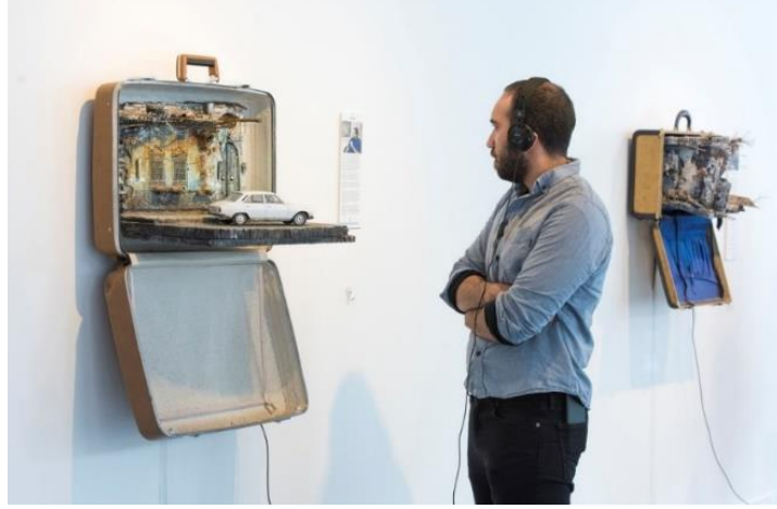
Şekil 4. Mohammed Hafez, Paketlenmedi: Mülteci Bagajı, Enstalasyon, 2017

Bir ülkeden başka bir ülkeye hareket etmek durumunda kalan göçmenler, göç esnasında pek çok sorunla yüzleşmek durumunda kalırken yaşadıkları deneyimler birbirlerinden farklılık gösterebilmektedir (Tyldum, 2021). Bu bakımdan Hafez'in "Umutsuz Kargo" eseri insanların göç esnasında karşılaştıkları sorunları sunması bakımından dikkat çekici niteliktedir. Denizin ortasında alabora olan ve uluslararası açıdan "Umutsuz Kargo" olarak reddedilen botlarla yüksek dalgalarda boğulan insanları farklı açılardan izleyicilere sunmaktadır (Şekil 3). Bunlara dikkat çekerken, izleyiciler olarak göçmenlerin ruhsal durumlarını, yaşadıkları travmaları bilişsel ve duyuşsal olarak hissetmemizi amaçlamaktadır. "Hafez, enstalasyonunda bot ve can yeleklerini, kendi amaç ve anlamları dışına taşıyarak, insanların çekmiş olduğu çileyi, acıları metaforik düşünce ile izleyiciye aktarmaya çalışmaktadır" (Çay ve Demirci Katırcı, 2020: 280). Dolayısıyla insanların içinde kaldıkları durumları ve yüzleşmekten kaçınmadıkları yaşam mücadelelerini, nesnel aracılığıyla metafora dönüştürerek düşünsel boyut kazandırmış, bu sayede izleyicileri psikolojik ve sosyolojik açıdan olayın içine dahil etmiştir.