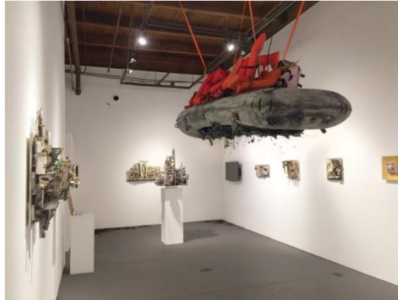
Şekil 3. Mohammed Hafez, Umutsuz Kargo, 2017, Karışık Teknik, Enstalasyon, 365x120x100 cm., Real Artways, Hartford

İnsan hakları üzerine odaklanmanın yanında göç ve mültecilik konularına ağırlık veren bir diğer sanatçı ise Mohammed Hafez’dir. Enstalasyonlarını izleyiciye sunarken savaş ortamının çatışma seslerini arka planda sergileyen Suriyeli Mohammed Hafez’in bu konuda yaptığı çalışmalar ilgi çekicidir. Göçün kavramsal boyutuyla ilgilenen Hafez, farklı objeleri, nesnelere ve savaş ortamını andıran sesleri bir araya entegre ederek göçün zorluklarını hissettirmeye çalışmaktadır.