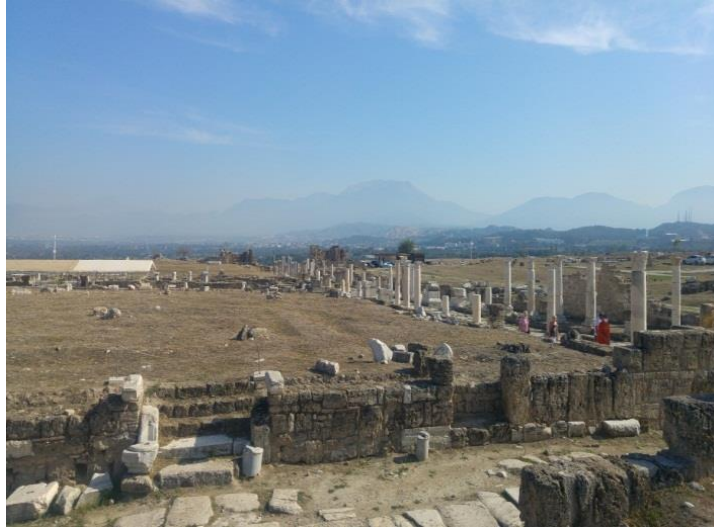
Resim 5. Haçlı birliklerinin Laodikeia'dan sonra Antalya'ya gidebilmek için geçmek zorunda olduğu ve pusuya düşerek çok büyük kayıplar verdiği Honaz Dağının Laodikeia'dan görünüşü

Mevcut şartlar altında Louis'in, Laodikeia'da daha fazla kalmasının bir anlamı kalmamıştır. Çünkü bu bölgeden lojistik bir destek temin etme ihtimalinin olmadığı anlaşılmıştır. Artık Louis'in önünde tek bir seçenek olduğu görüldü. O da, bir an önce önündeki en büyük engellerden birisi olan Honaz dağı aşılıp, dağın arkasındaki yeni kaynaklara ulaşmak ve ihtiyaçlarını orada gidermenin yollarını araştırmaktır.