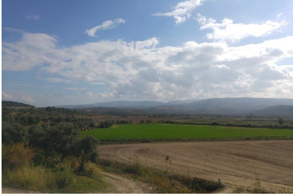
Resim 1. Kaynaklarda bahsi geçen, Türkmenlerin Fransızlara saldırmadan önce toplandıkları Antiocheia yakınlarındaki tepeler.

1147 Noel arifesini Efes yakınlarındaki Deversion Vadisinde 64 geçiren Fransızlar, 65 buradan itibaren Türkmenlerin tacizlerine de maruz kalmaya başladılar. 66 Bu şartlarda Efes'ten yürüyüşüne devam eden Louis, Denizli'ye yaklaşık 65 kilometre mesafedeki Antiocheia'da 67 ilk ciddi sınavını verdi. Burada, Büyük Menderes nehrini geçmek zorunda olan Haçlı birliklerine karşı, onları Efes'ten beri takip eden Türkmenler, büyük bir saldırı gerçekleştirdi. Aslında Manuel'in, VII. Louis'e Efes'te bulunduğu sırada gönderdiği ve Türkler hakkında çok dikkatli olması; hatta kendine ait kalelere sığınabileceği tavsiyesinde bulunduğu mektubunda 68 ne kadar haklı olduğu da anlaşılabilir oldu. Her ne kadar Fransızlar, 1 Ocak 1148'deki bu ilk ciddi saldırıyı zorda olsa püskürttü ise de 69 bu saldırı bundan sonraki yaşayacakları sıkıntıların ilk habercisi gibiydi. 70 Büyük ihtimalle burada savaşan unsurlar, daha geride Haçlıları bekleyen yoğun Türkmen birikiminin bölgedeki uç unsurları idi. 71