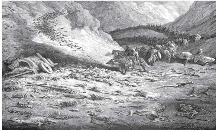
Resim 6. Freshing komutasında Denizli'ye gelen ve Honaz Dağında imha edilen Alman kuvvetlerinin cesetleri arasında ilerleyen Fransız birlikleri

Türkmenler artık dar bir alanda sıkıştırdıkları Haçlı ordusunun yayalar ve ağırlıklardan oluşan ve yaklaşık 10 kilometre uzunluğu bulunan bu kısmını hızla imha etmeye başladılar. Pusuya düşürdükleri bu birliklere var güçleri ile saldırıyor, kayaların ve ağaçların üzerinden onları ok yağmuruna tutuyorlardı. Arkadan gelen Kral Louis, geçide yaklaştıkça ordusunun başına gelenleri anlamaya başladı. Geçide girdiği andan itibaren ordusunun pusuya düştüğünü gördü ve kendisini tam bir ölüm kalım mücadelesinin içinde buldu. Louis, bu savaş sırasında 40 civarındaki özel maiyetinin tamamını kaybetti. Kendisi ise ağaç köklerine tutunup, bir kayalığa tırmanarak canını zor kurtarabildi. Türkmenler kısa süre önce daha güçlü bir orduyu imha etmiş olmanın (Konrad'ın bölgeye gönderdiği Otto von Freising idaresindeki Alman birlikleri) öz güveni ile saldırı ve baskılarını iyice artırdı. 90 Ancak karanlığın çökmeye başlaması üzerine sürpriz bir saldırıya uğramamak istemeyen Türkmenler savaş alanından yavaş yavaş ayrılmaya başladılar. 91