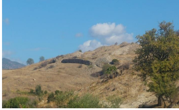
Resim 2. II. Haçlı Kuvvetlerinin Efes'ten Sonra Uğradıkları Antiocheia Şehrinin Kalıntılarının Günümüzdeki Durumu

Antiocheia'da yaşadıkları ilk ciddi sıkıntıyı bir şekilde atlatan Haçlı kuvvetleri, Laodikeia'ya doğru yoluna devam etti. Artık, Bizans hâkimiyetinin nerdeyse tamamen lafta kaldığı topraklara girmişlerdi. 72 Aslında Laodikeia, yukarıda da bahsettiğimiz gibi Ioannes Komnenos tarafından, Türklerin elinden alınıp tekrar Bizans topraklarına katılmıştı. Ancak, biraz sonra anlatacağımızdan da anlaşılacağı gibi burada Bizans'ın siyasi bir varlığından söz etmek nerede ise imkânsızdır. Bölge tamamen Türkmenlerin kontrolü altında idi. Bundan sonra Haçlılar, Türklerin saldırılarına karşı koyabildikleri ölçüde yol emniyetini temin edebileceklerdi.