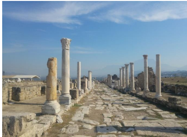
Resim 3. Haçlıların büyük bir umutla geldiği ancak halkın şehri boşaltması sebebiyle büyük hayal kırıklığına uğradıkları Laodikeia antik şehrinin günümüzdeki kalıntıları

1 Ocak'ta Antiocheia'dan hareket eden Fransız kuvvetleri, yaklaşık 65 kilometrelik yolu 3 günde kat edip 73 4 Ocak'ta Laodikeia'ya ulaştılar. 74 Ne var ki, Louis büyük umutlarla geldiği Laodikeia'da, tam bir hayal kırıklığına uğradı. Haçlılarla ilgili Anadolu'daki olumsuz algı, Laodikeia halkını da etkilemiş ve halk şehri boşaltarak çevredeki dağlara çekilmiştir.