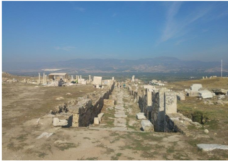
Resim 4. Haçlı Kuvvetleri Laodikeia'ya geldiğinde halkın şehri terk ederek gizlendiği Çökelez Dağının Laodikeia'dan görünüşü