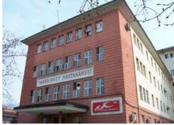
Bursa Devlet Hastanesi