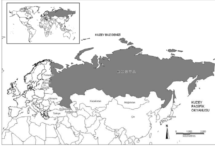
Harita 1: Rusya'nın Coğrafi Konumu

özellikler bakımından derin farklılıklar vardır. Bu çalışmada Rusya Federasyonunda yer alan federal yönetim bölgelerinin coğrafi ve demografi özellikleri irdelenmiş ve böylece federal bölgeler arasındaki benzerlikler ve farklılıklar ortaya çıkarılmıştır.