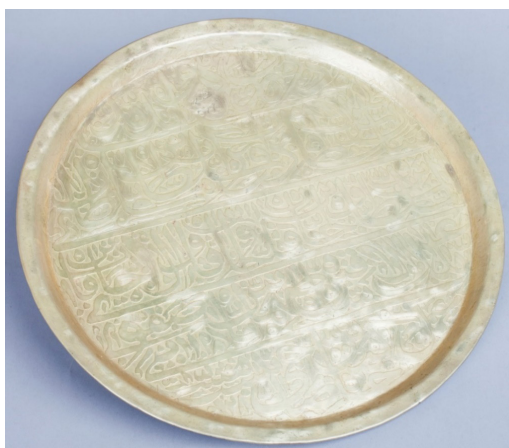
Рисунок 4. Сини (поднос). XVIII в.

В Музее истории Азербайджана также можно встретить подобные подносы XVII-XVIII вв.