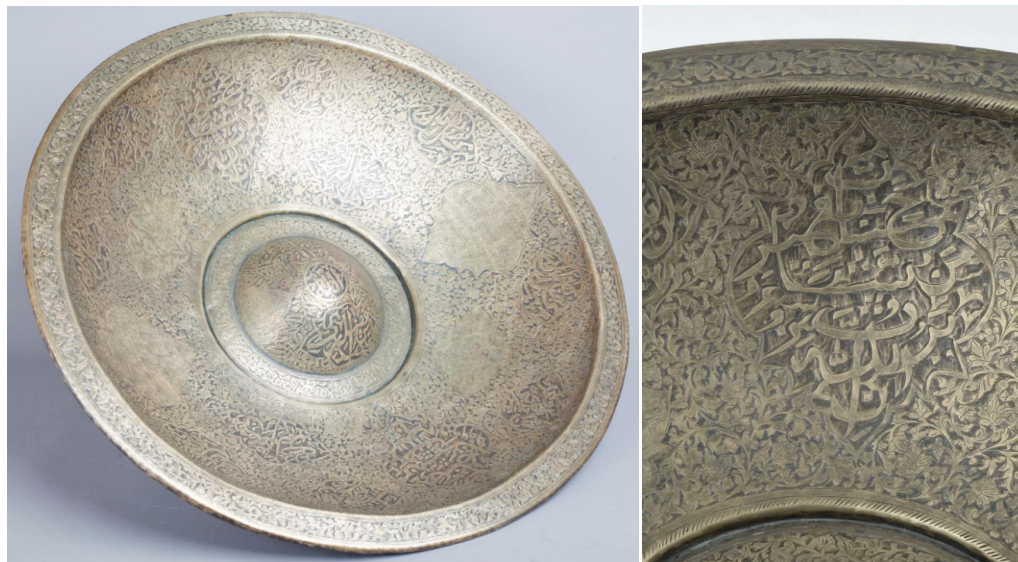
Рисунок 6. Чашей гырхачар. XVII в.

В полосы на обеих сторонах большинства чаш «гырхачар» вписана кораническая сура «Ихлас» («Искренность») и молитва «Аятуль-курси» («Аят Престола»), имена Аллаха, пророка и его близких [34], на некоторых плотно вырезана молитва «гырхачар» [35]. На большинстве данных чаш надписи нанесены стилем насх методом насечки [36]. Чаша «гырхачар» XVII века, поступившая в фонд под № 9338, отличается от других по размеру (диаметр 57 см) и художественному оформлению. На ней стилем насталик отчеканены аяты Корана и выбито слово «Аллах» по середине.