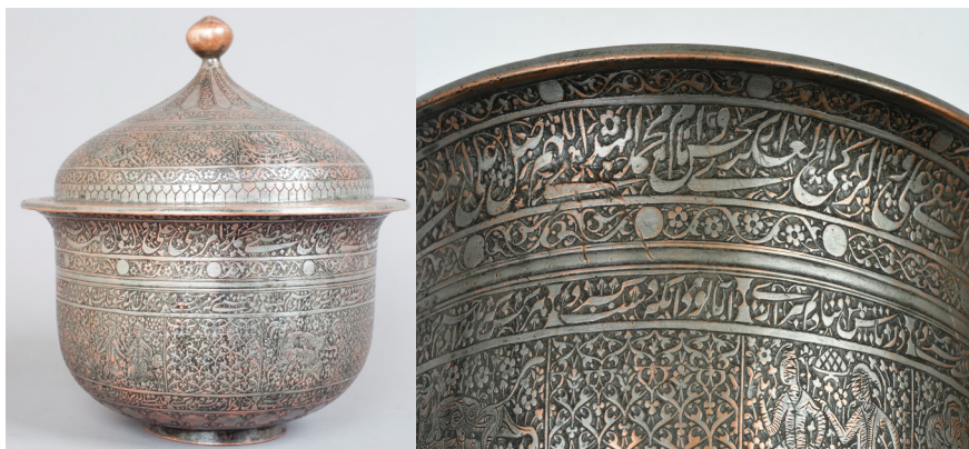
Рисунок 1. Казан. XVI-XVII вв.

Как мы уже отмечали, многие медные сосуды с каллиграфическими надписями хранятся в Национальном музее истории Азербайджана. Надписи на этих предметах были прочитаны учеными-эпиграфистами М. Нематом и Х. Алиевой. Их содержание в основном соответствует функции. Но порой и на посуде нерелигиозного назначения – на казанах, чашах, колпаках, больших и малых подносах – можно встретить аяты Корана и молитвы. Это указывает на то, что население наносило молитвы, выражавшие мольбы к Аллаху о благоденствии, не только на обрядовую утварь, но и на предметы повседневного быта. Среди них казаны, ежедневно использовавшиеся для приготовления и хранения пищи, выделяются декоративностью и художественным оформлением.