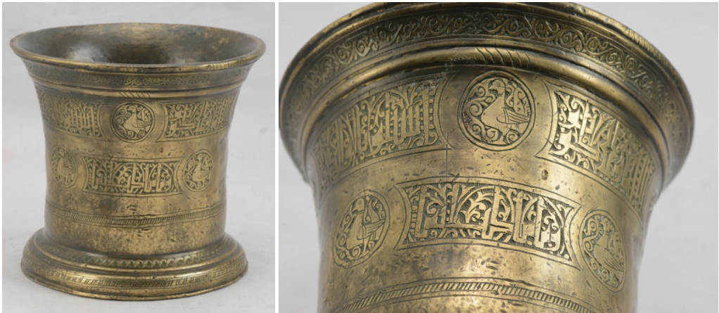
Рисунок 5. Ступа. XVI-XVII вв.

لكم الی الله – «Аллах хранит всех» الله ولا حول له – «Аллах всемогущ» اسئلو بالوالو الدها – «Мой дед истинен» احسانا و الف الف – «Тысячекратная хвала»