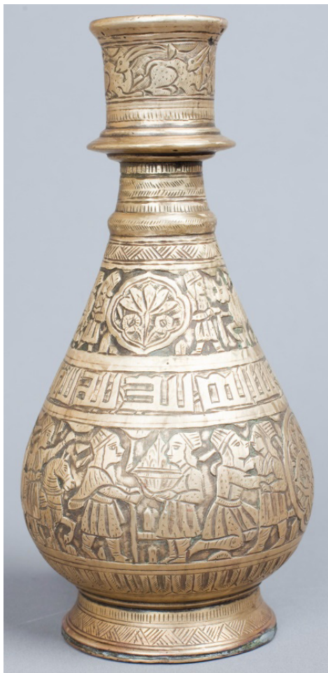
Рисунок 8. Кальянная колба. XVI-XVII вв.