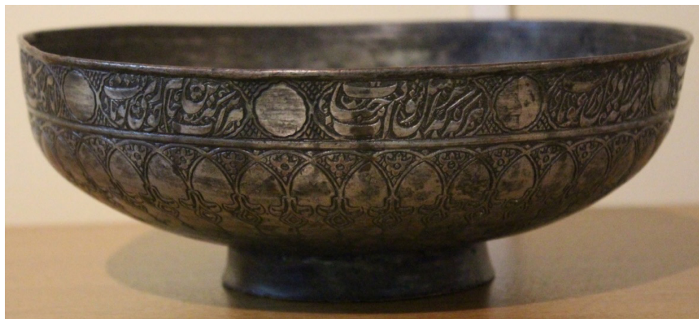
Рисунок 2. Каса (чаша). XVII в.

“Хозяин чаши, забудь печаль / Пусть сердце всегда полнится желаниями / На лугу чаши и бокал в радость / Смейся и наступит время исполнения чаяний / Виночерпий, наполни бокал живой водой. Вместе с краснощеками цветущими девицами / 1076 г. хиджры, 1665/66 гг. от Р.Х.».