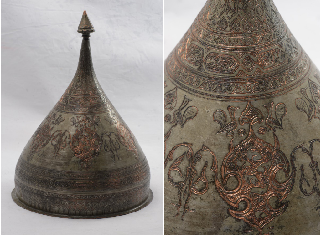
Рисунок 3. Сарпуш. XVI-XVII вв.

“Господи, приведи к благополучному завершению...” – الهی عاقبت محمود گردان