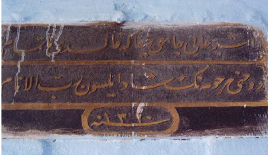
Resim 3.Üçbeyli Camisi Kitabesi

Bey adında bir kişiyi inşaatı tamamlaması için görevlendirdiği anlaşılmaktadır.