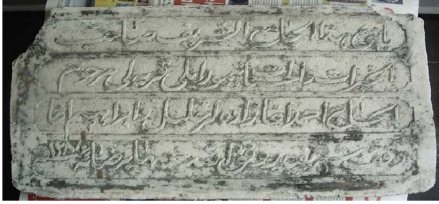
Resim 4. Demireli Camisi Kitabesi

Uludağ Üniversitesi Fen-Edebiyat Fakültesi Sanat Tarihi Bölümü'ne getirilen, üzeri boya ve yıldız izleriyle kaplı buluntu (Resim 4), bölümümüzün eski mezunlarından olup ahşap ve taş restorasyonu alanında çalışan Arife Aslan tarafından elden geçirilerek üzerindeki boya ve yıldızdan tamamen temizlenmiştir (Resim 5). En üstteki boya katmanında yeşil renk ve yıldız izleri bulunduğu için temizlenme işleminden sonra zemini yeşil renkte, harfleri ise altın varak ile kaplanarak aslına uygun hale getirilen eser, köyüne götürülerek cümle kapısının üst yanına monte edilmiştir (Resim 6).