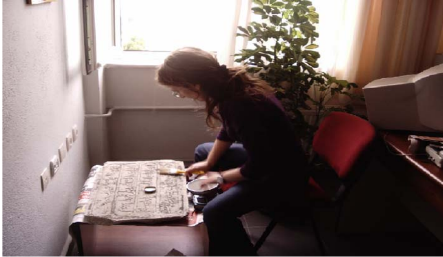
Resim 5. Demireli Camisi Kitabesi