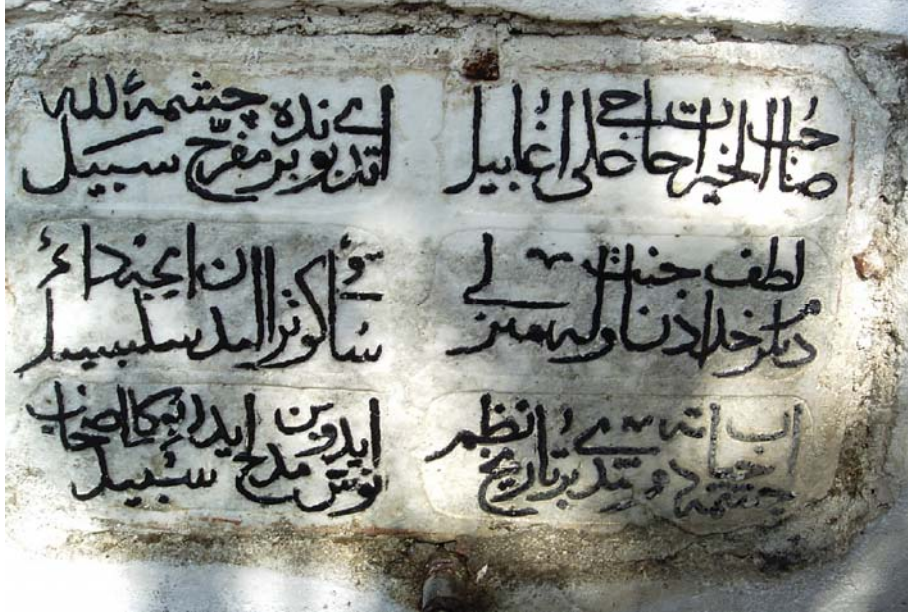
Resim 1. Üçbeyli çeşmesi

43 x 68 cm. boyutlarında, mermer üzerine yazılmış kitabenin metni şöyledir; (Resim 1)