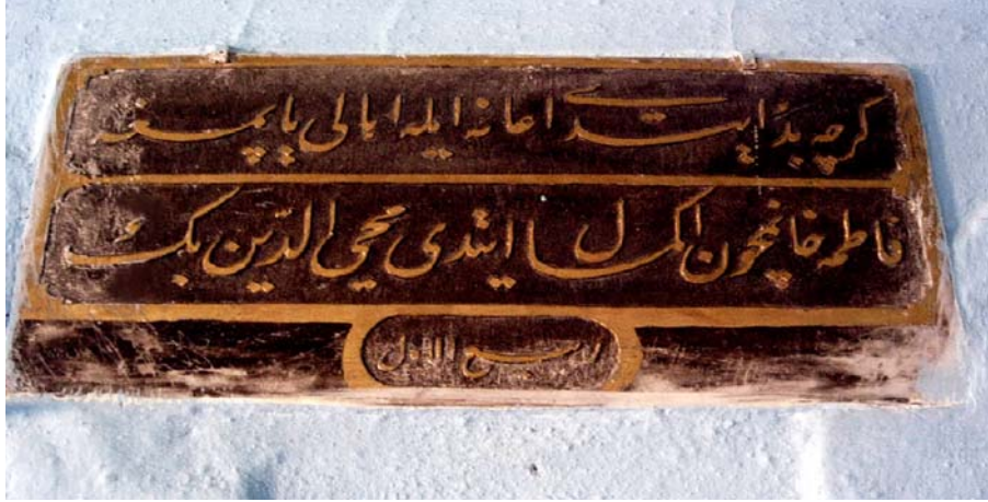
Resim 2. Üçbeyli Camisi Kitabesi

minaresi ile tipik bir Ulusal Mimarlık Devri eseridir 9 . İnşaattaki bu alçak gönüllülüğe karşın kitabesi gayet gösterişlidir. İki parça halinde ve 38 X 75 cm. boyutunda iki mermer levhaya, yine “Fâlâtün fâilâtün fâilâtün fâilün” vezninde ve nefis bir ta’lik hat ile yazılmış olan dört mısralık kitabenin metni şöyledir; (Resim 2)