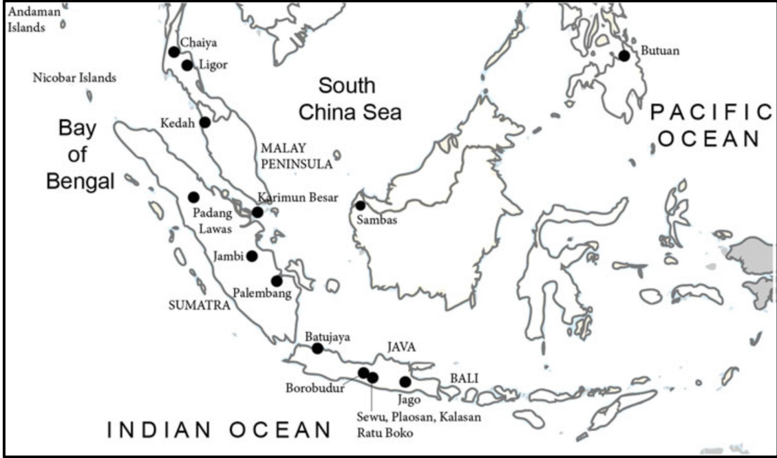
Harita 3. Nusantara'daki Budist Bölgeler [8].

Nusantara kavramının Ortak Çağ'ın ilk yüzyıllarından itibaren (Bkz. Harita 3) önemli bir rol üstlenmiş olduğu görülmektedir. Budist kozmopolisinde Nusantara kavramı coğrafi olarak denizel Asya bölgesinin geniş sosyo-mekânsal açıdan gruplandırılması anlamına gelmiştir. Bir ağ aracılığıyla birbirine bağlı bir kıyı ve iç yönetim ağından oluşan bu sosyo-mekânsal bölgede coğrafi ve kültürel sınırlar boyunca Bengal Körfezi ve Güney Çin Denizi'ni kapsayacak şekilde kozmopolit limanlar arasında meydana gelen deniz etkileşimlerini vurgulayarak, coğrafi olarak geniş bir perspektiften tarihsel bir genel bakış sunmuştur. Bir başka ifadeyle Nusantara kavramı kara temelli kuzey patikasına alternatif deniz temelli güney patikasını temsil ettiği görülmektedir [8].