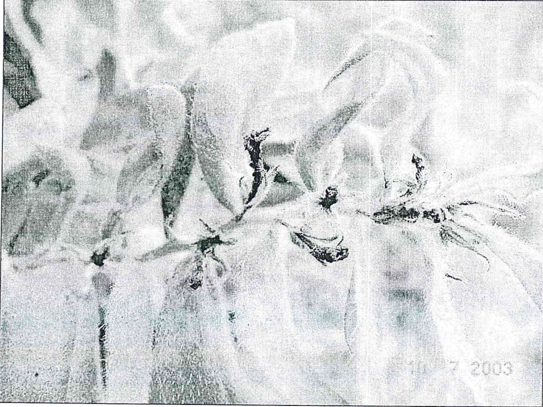
Şekil 2. Alkanna verecunda 'nın çiçekleri

Bitki 30-70 cm boyunda, tabanda kümelenmiş, yeşilimsi, 0.1-0.4 mm glandular ve eglandular yaygın pubescent tüylü, aralarda 0.7-1 mm eglandular hirsut tüylü. Taban yapraklar lanseolat-oblong, 8-10 x 2-2.5 cm, gövde yaprakları lanseolattan oblonga kadar ve lanseolat-ovata, 3-8 x 0.8-2 cm. Talkımlar sıkışık meyvede yaklaşık 10-20 cm'ye kadar uzunlukta. Brakteler lanseolat ya da linear-lanseolat, 2-5 x 0.5-1.5 cm, kaliks uzunluğunun 2-5 katı kadar. Kaliks çiçekte 8-10 mm, dişler 5-7 mm, meyvede hafifçe uzun. Korolla mavi, dış tarafı hafifçe puberulent, 10-15 mm, ayalar 4-8 mm çapında. Nutletler 2-2.5 mm çapında, hafifçe tüberkülat, siğiller küçük, obtus, tabanda birleşmemiş, gaga kıvrık. Çiçeklenme Mayıs-Haziran. Kireçtaşı kayalıklar 1550-1980 m.