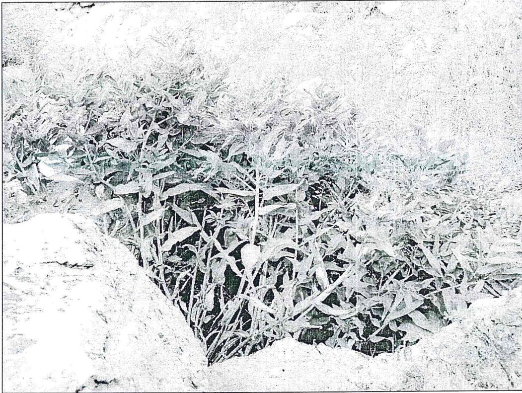
Şekil 1. Alkanna verecunda 'nın genel görünümü

Konya'nın endemik ve nadir bitkileri için yapılan arazi çalışmaları sırasında Alkanna verecunda taksonuna ait örnekler toplanarak preslendi. Toplanan örnekler üzerinde yapılan morfolojik çalışmalar sonucunda bu taksonla ilgili bazı eksik bilgiler giderilmiş olup betimleme ile ortaya konmuştur. Toplanan örnekler KNYA Herbariyumu'nda muhafaza edilmektedir. Aynı zamanda KNYA, GAZI ve HUB herbariyumlarında bulunan örneklerde incelenmiştir.