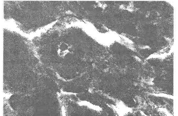
Şekil 3. Sağlam karaciğer dokusunun Mallorinin Trichrom boyaması tekniğiyle mikroskopik görünümü.