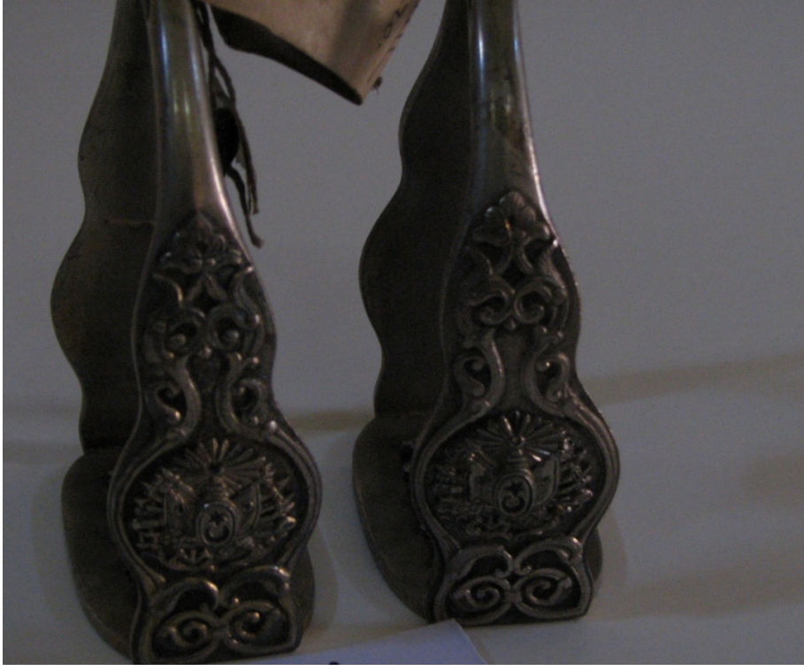
Resim 1. Üzengi.

Kaynak: Topkapı Sarayı Müzesi, Envanter numarası: 36/251.