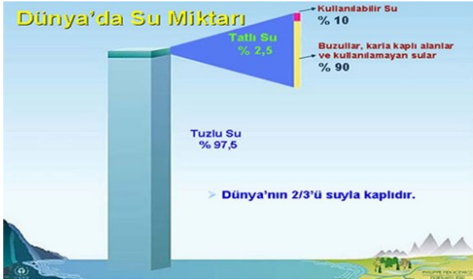
Şekil 2. Dünyada suyun dağılımı [6]