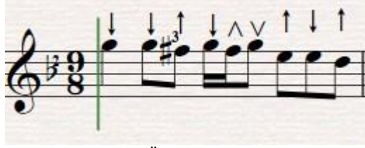
Şekil 4. Önerilen icra şekli

TRT repertuarında kayıtlı olan notada 5. Satırın 1. Ölçüsünde yazılı olan nota bağlama metodunda yazılmış olan notada 4.satırda 3.ölçü olarak değiştirilmiştir. Orjinal notada yazılı olan üçlü gruptan önceki nota tek notada toplanmıştır. Bu değişim yerine tezene önerilen icra şekli aşağıda ki şekilde belirtilmiştir.