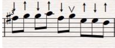
Şekil 5. Önerilen İcra şekli

2+2+2+3 ya da 2+3+2+2 şeklinde olan türkülerde değişikliklere bakılmadan üçlü grubun olduğu yerdeki tezene vuruşları (↑↓↑) alt-üst-alt şeklinde uygulanmaktadır. Fakat üçlü gruptan önce ki gelecek olan tezenenin (↓) üstten gelmesi gerekmektedir. Bu yüzden TRT repertuarında yazılı olan notada üçlü gruptan önce yazılan iki notayı, metodlarda sistematik olan tezene vuruşlarına uyarlama yaparak tek nota haline getirerek öğretim metodlarında kullanılmaktadır. Yazılı olan notanın aslını sistematik hale getirmek adına kırılarak sisteme uyarlanmıştır. Şekil 2'de olan türkünün notasında ikinci ölçü için önerilen icra şekli şekil 5'de gösterilmiştir.