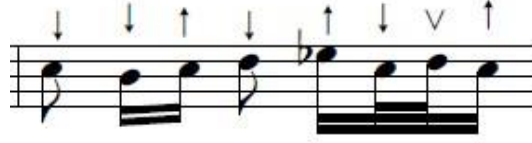
Şekil 7. Önerilen İcra Şekli

TRT repertuarında yer alan türkünün ikinci sayfasında ikinci satırın ilk ölçüsünde yer alan üçlü grubun içindeki notaları sistematik tavrı yapısını bozmadan önerilen icra şekli şekil 7'de gösterilmiştir.