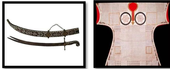
Resim 20. Hz. Ali'nin ucu çatallı kılıcı ve Padişah kaftanı.

Tılsımlı gömlekler üzerinde sıkça yer alan iki motif ise Hz. Ali'nin ucu çatallı kılıcı 'Zülfikâr' (Şekil:20) ve çoğunlukla Musevi inancıyla bağdaştırılan Süleyman Mührü (Şekil:21). Bu figür Hz. Süleyman'ın bütün canlılara hitap edebilmesini ve hayvanların dilini anlayabilmesini simgelediği için Padişahlar tarafından tercih edilmiştir.