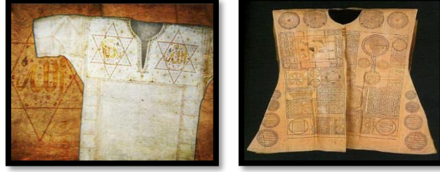
Resim 24. Hilye-i Şerif ve Kaside-i Bürdeyle işlenmiş Tılsımlı gömlekler.

Gömlelerde ve Kaftanlarda sembolik değerler olarak birtakım şifreler kullanılmıştır. Bu şifreler rakamlar ve harflerden oluştuğu gibi soyut geometrik şekiller biçiminde de olabilmekteydi. Ancak, rakamları ve harfleri çözmek uzmanlık gerektirmektedir. Dokuma üzerine çalışanlar da 8 bin çözgü teliyle dokunan "Gülistan Kemha" tekniğini henüz çözememişlerdir. Şifreyi çözmek Türk tekstiline yeni bir açılım getirecek Türkiye'de tılsımlı gömlekler üzerindeki şifreyi çözmeye çalışan ve bu konuda çalışan Orakçioğlu, II.Selim'in gömleğini incelemiştir. Bu güne kadar gömleğin ön yüzündeki küçük karelere yerleştirilen rakamlarla Fetih Sûresi'nin kodlandığını keşfetmiştir.