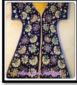
Resim 8. Yelpaze biçiminde karanfilli çatma kumaş XVI. Yüzyıl (H. Bartels Koleksiyonu, Bonn).

XVII. yüzyılda dokunan kumaşlarında lâle deseninin daha az ve şeklinin biraz değişmiş olduğunu, buna karşın karanfil deseninin çoğalmış olduğunu görürüz. XVII. yüzyılın ikinci yarısından itibaren Osmanlı sanatında görülen Batı tesiri, kumaş sanatında da etkili olmuştur (Şekil:8), (Gürsu,1988: 33).