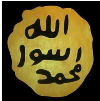
Resim 17. Hz. Muhammed'in nübüvvet mührü.

XV. ve XVI. yüzyıl arasında hazırlanan padişah giysilerini içeren saray koleksiyonunda Peygamber Efendimizin nübüvvet mührü kullanılmıştır. Simgesel değer taşıyan mühür ve kullanıldığı gömlek Şekil 17 ve 18'de görülmektedir.