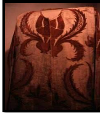
Resim 23. Hürrem Sultan'ın II. Selim'e Hazırlattığı tılsımlı gömlek.

Bir başka tılsımlı gömlek II. Selim'e Hürrem Sultan tarafından diktirilen gömlektir (Şekil:23). Yalnız Selim ve Bayezıt arasındaki taht mücadelesini değil, Rüstem Paşa'nın entrikalarıyla boğdurulan Şehzade Mustafa'nın hazin sonunu da anlatmaktadır.