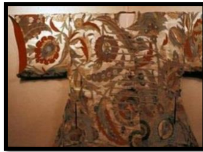
Resim 25. Yavuz Sultan Selim'in tılsımlı kaftanlarından bir örnek.

Mimar Sinan'ın da eserlerinde ebced hesabı kullandığı bilinmektedir (Yakıt, 2010). Yavuz Sultan Selim'in kaftanı üzerinde çözdüğü bir figürden bahsederek, desenler arasında ellerini gökyüzüne açmış yakaran insan figürüne ulaştığını belirten Orakçioğlu, "İnsan ve hayvan figürleri özellikle İran süsleme sanatlarında kullanılmasına karşın Osmanlı süsleme sanatlarında özellikle tekstil alanında kullanılmamıştır. Osmanlılarda sanat özellikle kumaş sanatı sarayın kontrolünde gerçekleşmiştir. Bu Kaftanın sarayın ya da Sultan Selimin kontrolünden geçmemiş olması olası değildir. Belki de bu Kaftan Sultan Selim'inin isteği üzerine özellikle yapılmış olabilir. Çünkü kaftanın üzerinde tekrar eden insan figürleri ustalıklı kumaşın yapısını oluşturan motifler arasında tasarımcı ya da dokuma ustası tarafından gizlenmiştir (Şekil:25). Bu kalitedeki kaftanın dizaynı, özel olarak saray nakkaşları tarafından yapılarak dokunmuştur (Orakçioğlu, 2001).