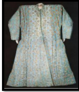
Resim 13. Karanfil motifli I. Ahmed'in Kaftanı XVI. Yüzyıl (Tezcan, 2002: 17)

Murabba kaftan, Keçe kaftan, Çuha kaftan, ipekli kumaştan yapılan uzun, süslü ve hafif giysi. Kumaşların zemininde en fazla krem ve güvez rengi ve desenlerinde ise mavi renge yer verildiği tespit edilen önemli detaylardan bazılarıdır (Şekil:13).