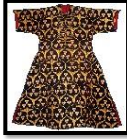
Resim 1. Rumi motifli serenk kumaşından Yavuz Sultan Selim'in Kaftanı, XVI. Yüzyıl Topkapı Sarayı Müzesi (Tezcan, 2002: 20)

Kaftanlar (Hil'at)'lar değerine göre derecelenir ve başka başka adlar alırdı. "Çok değerli hil'at" anlamına hil'at-i fahire sözü çok kullanılırdı. Hil'atlar Osmanlı saray hayatının vazgeçilmez parçasıydı. Bir şehzadenin ya da elçinin ziyareti, bir askeri seferin başlangıcı veya saltanat ailesindeki bir kutlama için dini bayramların bir parçası olarak sunulurlardı. İncelenen belgelerde bu giysilerin farklı amaçlar için yapıldığı görülebilmektedir. Örneğin; İnam, hediye ve ödül için, alınan hediye anlamında, tasadduk, Dini bağış anlamında, iydane. Hil'atlar genellikle verilen kişinin konumuna ya da iletilmek istenilen onurun derecesine göre renk ve kalitede dokunurdu (Atasoy, Denny vd., 2001).