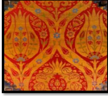
Resim 2. Lale ve iç içe geçmiş Nar motifli ipek (www.megep.meb.gov.tr).

XIV. yüzyılda iri kozalak, çınar yaprağı, nar motifleri bu yüzyılın karakteristik özelliğini taşır. Kumaşlarda görülen desenler arasında gül, karanfil, menekşe gibi çiçeklerin az stilize edilmiş örneklerini, iri yapraklı desenlerin yanı sıra sade ve düz renkli kaftanları da bulabiliriz (Şekil:2).