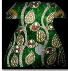
Resim 15. Grafik sanatının net şekilde işlendiği bir kaftan.

erişilememektedir. Amaç, altın Oran'ı Türk Tekstil'inin hizmetinde kullanmaktır. Altın oran, matematik ve sanatta, bir bütünün parçaları arasında gözlemlenen, uyum açısından en etkin boyutları verdiği sanılan geometrik ve sayısal bir oran bağıntısıdır. 1978 yılından bu yana Topkapı Sarayı Müzesi'nde Osmanlı tekstili ve padişah giysileri üzerine çalışan Doç. Dr. Hülya Tezcan, tılsımlı gömlekleri grafik sanatının zirvesi olarak tanımlamaktadır (Şekil:15).