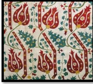
Resim 22. Osmanlı İmparatorluğu dönemi kumaşlarında Lale-i Rumi, motifi (wowturkey.com).

Hülya Tezcan, gömleklerdeki Süleyman Mührü'nün saltanatın ebediyetini temsilen kullanıldığını, Hz. Muhammed ve Hz. Ali isimlerinin çoğunlukla bir arada anıldığını tespit etmiştir. Osmanlılar'ın son dönemine damgasını vuran lale çiçeği desenlerde stilize edilerek kaftan motifi olarak kullanılmıştır. Lâlenin bu kadar ilgi görmesinin sebeplerinden biri de, "LALE" kelimesinin Arap harfleriyle yazıldığında "ALLAH" kelimesindeki bütün harfleri kapsamasıdır. Ayrıca, Ebced hesabına göre "ALLAH" kelimesiyle "LALE" kelimesinin aynı rakama (66) tekabül etmesi Osmanlı'da derin bir heyecan uyandırmıştır. Lale Arap harfleriyle yazılır ve tersinden okunursa "HİLAL" olur. Hilal de Osmanlı İmparatorluğunun amblemidir (Şekil:22).