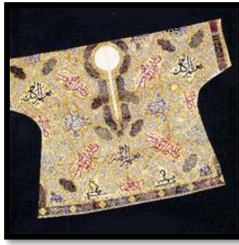
Resim 19. Nalın-ı Saadet'in kullanıldığı tılsımlı gömlek.

Kaftanlarda kullanılan diğer bir peygamber sembolü Nalın-ı Saadet motifleridir (Şekil:19).