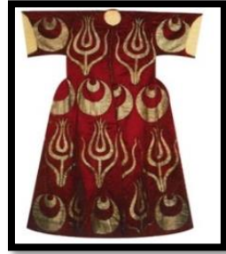
Resim 9. Çiçeklerle, Ay ve iç içe geçmiş, ay motifi (www.aileceizle.com).

XVII. yüzyılda kullanılan oval madalyonlar natüralist üslupta çiçek kompozisyonları ile süslenerek kullanılmıştır. Ay ve iç içe geçmiş ay motifi, yelpaze, karanfil motifi, çınar yaprağı biçimindeki hatailer, lale motifleri 8 yapraklı çiçek madalyonudur (Şekil:9).