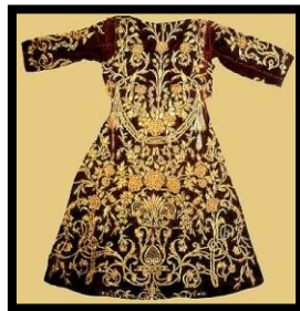
Resim 10. Yüzeyi dolduran çiçek buketleri motifli kaftan.

XVIII. ve XIX. yüzyılda Giderek Batı etkileri kendini iyiden iyiye gösterir. Yüzeyi dolduran çiçek buketleri, büyük yelpaze şekline almış karanfiller bu devirde dikkati çeken en önemli desen türleridir. Bu devirde Madalyonlu motiflere de oldukça fazla tesadüf edilmektedir. Madalyonlar gayri muntazam koyu kırmızı, renkleri biraz daha açık ve kumaşların zemin renkleri daha parlaktır (Şekil:10), (Altay,1979).