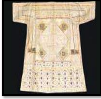
Resim 18. Nübüvvet mührünün kullanıldığı gömlek tasarımı.

Kaftanlarda kullanılan diğer bir peygamber sembolü Nalın-ı Saadet motifleridir (Şekil:19).