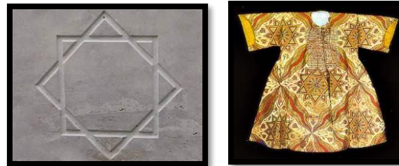
Resim 21. Süleyman Mührü ve bu mührün kullanıldığı kaftan tasarımı.