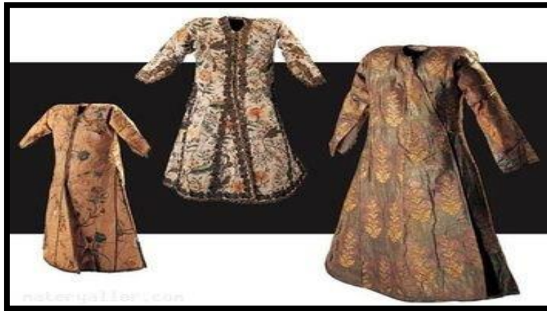
Resim 12. Sarayda Hediye verilen, Murabba, Keçe, Çuha, kaftan çeşitleri.