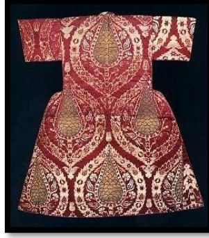
Resim 11. XVII. Yüzyıl sonları altınsırma işlemeli, kozalak motifli kemha çocuk kaftanı XVII. Yüzyıl Topkapı Sarayı ( forum.shiftdelete.net ).

Avrupa'da tek renkli lâlelerden çok daha fazla ilgi görür olmuştur. İki renkli lâleler genellikle ya sarı kırmızı ya da beyaz kırmızı oluyordu. Daha beğenilenler arasında üç renkliler, dört renkliler ve hatta daha fazla rengi olanlar bile vardı. XVIII. yüzyılda ise, lâle soğanlarının çirkinleştikçe, çiçeğinin daha da güzelleştiği anlaşıldı. 1930'lu yıllarda, daha bilimsel çalışmalar yapılmaya başlandı ve lâleyi inceleme altına alan botanikçiler, pek çok sırrını çözdü. Renkli lâle elde etmek için iki farklı renkteki lâle soğanı ortadan ikiye kesilip eşleştiriliyor ve öyle ekiliyordu. Meydana gelen yeni bir lale rengi motifleri stilize eden sanatçıların çizimlerine yansıyor (Şekil:11), ( www.frmtr.com ).