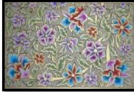
Resim 3. Goncagül, yani gonca çiçek demek olan bu motifler tam açılmamış bir çiçeğin boyuna kesitinin tezhip üslubunda tasarlanmış şeklidir (www.megep.meb.gov.tr).

XV. yüzyılın Türk kumaşlarında görülen en önemli motif pans beneği ve kaplan postu motifidir. Çatma kumaşlarda yoğun olarak kullanılmıştır. XV. yüzyıl sonuna doğru bitkisel motiflerin yoğunluk kazandığı ve desenlerin küçüldüğü görülmektedir. (Şekil:3-4),(Salman,1998:147).