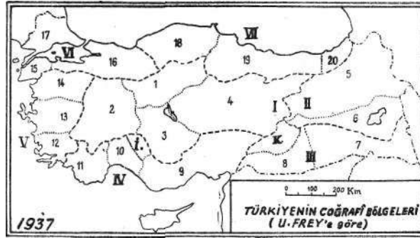
( HARİTA - III )

Bir seri eserin "Türkiye" bahsini yazmış olan Ulrich Frey memleketimizi yedi tabii mıntakaya ayırarak bir harita üzerinde tesbit etmiştir (Harita-III). Bu taksimat çok şayanı dikkat olmakla beraber, bazı mın-