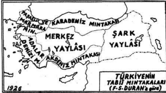
( HARİTA - I )

Bunlar içersinde yalnız Güneydoğu Anadolu eksik bulunmaktadır; bu da listenin 6 ncı maddesinde dahil farzedilmiştir. Şu cihet şayanı dikkattir ki, aynen bu taksimatı biraz değişik ifadelerle, daha 1928 de eski yazı ile basılmış başka bir kitabında veren Faik Sabri, tabii mıntakaları gösteren bir Türkiye haritasında, Güneydoğu Anadolu müstesna olmak üzere, 1941 coğrafi taksimatına çok yerde benzeyen sınırları tesbit etmiş bulunuyordu 18 (Harita-I).