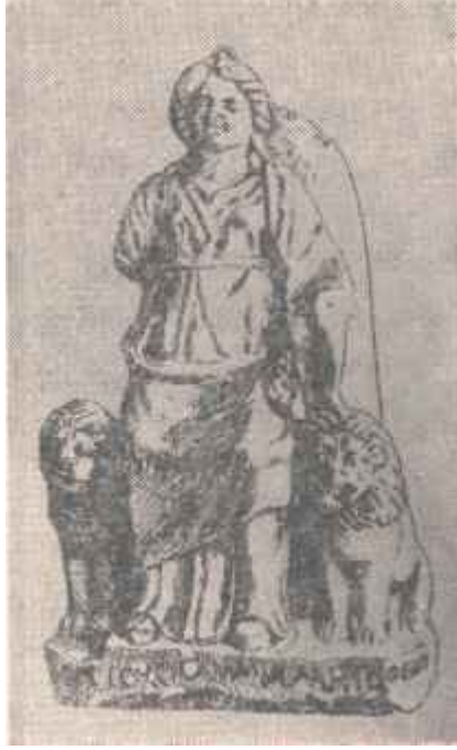
Resim: 1. Kütahya'dan ele geçmiş bir Kybele heykeli. Roma devri (M.Ö. III veya II. nci yy.)