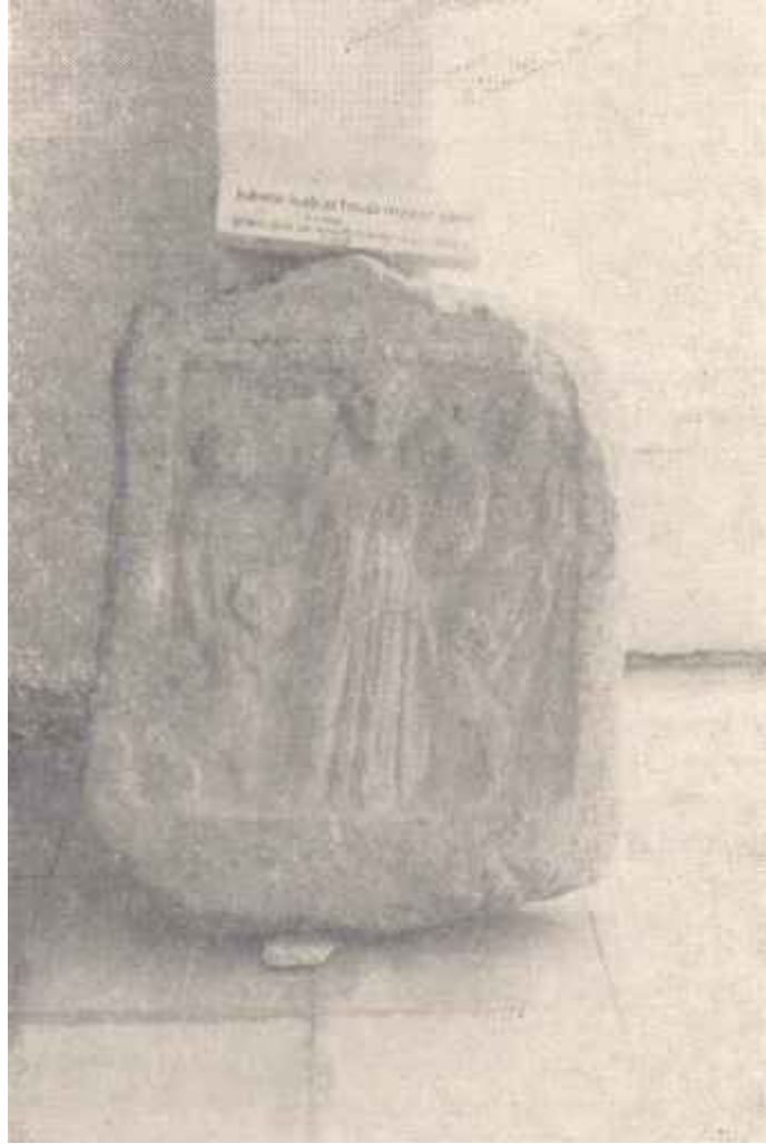
Resim: 5. Tire'nin Yeni Çiftlik taraflarında bulunmuş, Roma çağına ait bir Kybele steli. (Tire Ark. Müz. Env. 121, Kayıt. 335 Bu fotoğraf Ege Üniversitesi öğretim üyelerinden Prof. Dr. Mükerrrem (Usman) Anabol tarafından yayımlanmak üzere bize gönderilmiştir. Kendisine teşekkür ederiz).

kayıt vardır 159 . Bu mühür Kültepe çağındaki bazı teophor isimler dışında, tanrıçaya ve tapınımına direkt ilgi sağlayan en eski delildir.