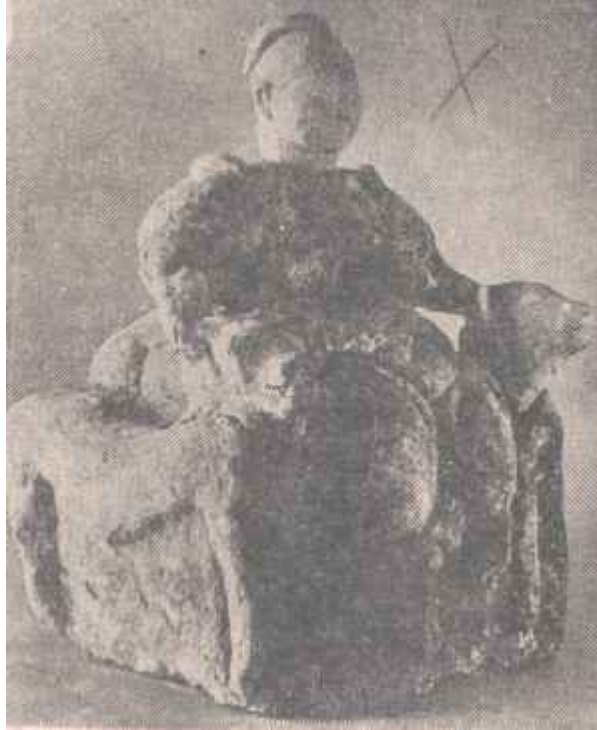
Resim: 4. Çatalhöyük'ün II. nci tabakasından bulunan (M.ö. 5750) "Vahşi Hayvanların Hakimesi".