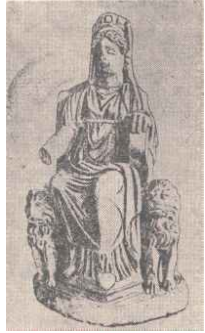
Resim: 2 İznik'de bulunan Roma çağına ait Kybele heykeli. (M.Ö. II nci yy.)

Fakat tanrıçanın tapınımı Kyzikosla sınırlı kalmamış görünüyor. Anadolu'nun çeşitli kentlerinde tapınıldığı ve çok geniş bir alana yayıldığı arkeolojik ve yazılı belgelerle kanıtlanmıştır 10 .