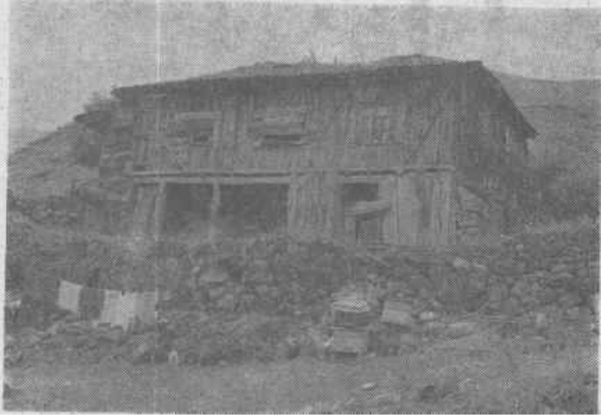
Resim: 5- Sağırlar köyü'nde göç nedeniyle terkedilen bir köy konutu

Özellikle Devrez Çayı vadisinde arazisi bulunan köylerde tarım ürünlerinde çeşitlilik görülmesi tamamıyla suya bağlıdır. Vadi boyunca yer yer sebze bahçeleri ve çeltik tarlaları görüntünün değişmesine neden olur. Devrez Çayım kuzeye doğru geçince Ilgaz Dağları başlar. Yağış miktarının artmasına bağlı olarak orman örtüsü gürleşir, konutlarda Karadeniz Bölgesinin özellikleri görülmeye başlar. Yapı malzemesi olarak tüm konutlarda en önemli, hatta çoğu yerde ahşap, tek yapı malzemesi olarak kullanılmaya başlar. Konutlar iki katlı olup çatıları eğimli ve kiremit yada ahşap örtülüdür. Hayvan barınakları, tahıl ziraati de yapılan köylerde tahıl ambarları, ağaç tomruklarının üst üste konulması ile elde edilen küçük yapılar halindedir (Resim: 6). Köyler eğimin fazla olduğu yamaçlarda kurulmuşlardır. Bu nedenle köyün ortak harman yeri, köy, yakınında bulunan düz bir alandadır. Harman yeri çevresinde de her eve ait bir samanlık bulunur.