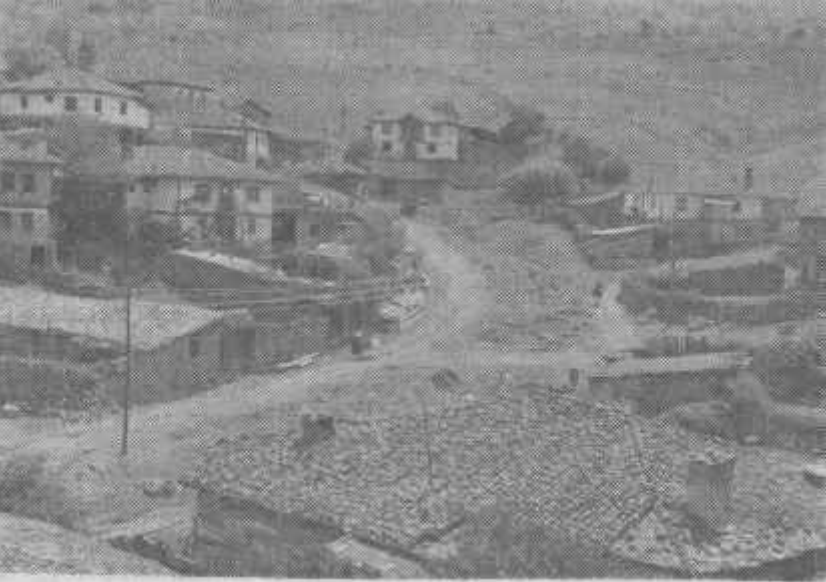
Resim: 4- Devrez Çayı kenarında Sağırklar köyü. Köy evlerinin-önemli bir bölümü iki katlıdır.