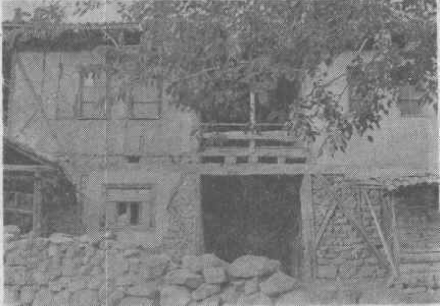
Resim: 2- Şevket Bey Dağı'nın güneyinde Dereçatı köyü konutu. Bu çevre köy evlerinde taş, kerpiç ve ahşap, yapı malzemesi olarak bir arada kullanılmıştır.

terek karakteristik eklentileridir. Köylerde görülen iki katlı evlerin sayısı da bu kesimde artış göstermektedir. Tahıl tarımının yansira, dere yâ-taklarındaki küçük tarım alanlarında da az miktarda üretilen sebze ve meyve, yöre halkının kendi ihtiyacına hitap etmekten ileri gidemez.