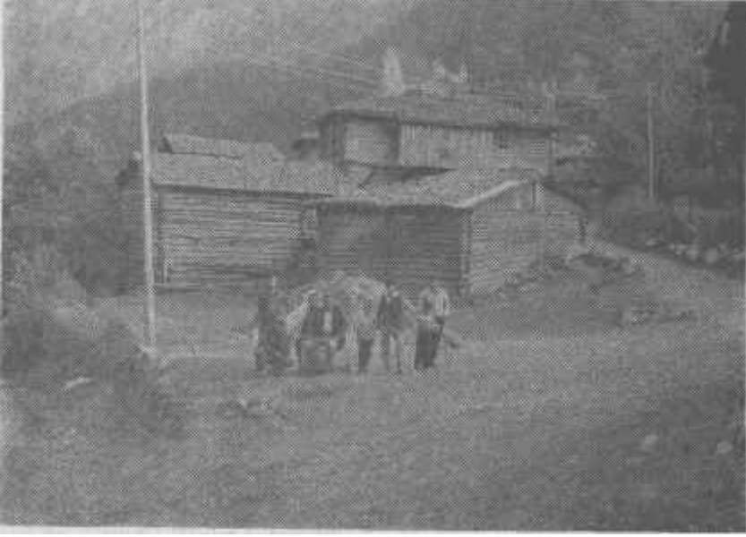
Resim: 6- Ilgaz Dağları üzerinde Eksik köyü. Üç mahalleden oluşan bu köyde ağaç, konutlarda ve eklentilerinde tek malzeme olarak kullanılmıştır.

en önemli geçim kaynağıdır. Tarlalardan elde edilen ürünler kendi ihtiyaçlarını karşılamaktan uzak olduğu için dışarıdan sürekli besin maddesi almak zorunda kalırlar.