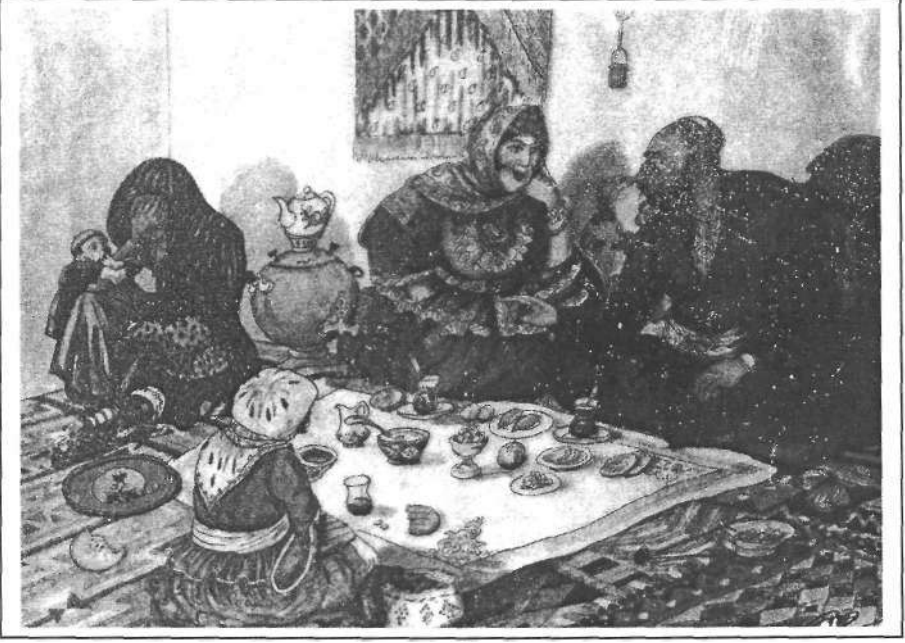
"Yeni ve Eski Eş Sahnesi"