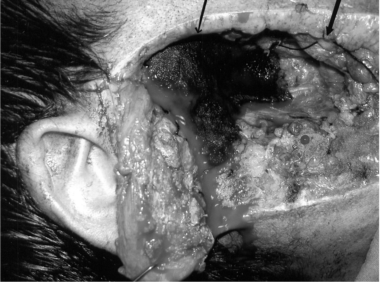
Resim 2: Olgunun hemostaz sonrası görünümü

değerlendirilmesinin hayatı tehdit edebilecek kanamaların önlenmesinde önemli olduğunu düşünüyoruz. Ayrıca olgumuzda olduğu gibi fasiyal paralizi ve benzeri iatrojenik ciddi komplikasyonlar bu şekilde azaltılabilir.