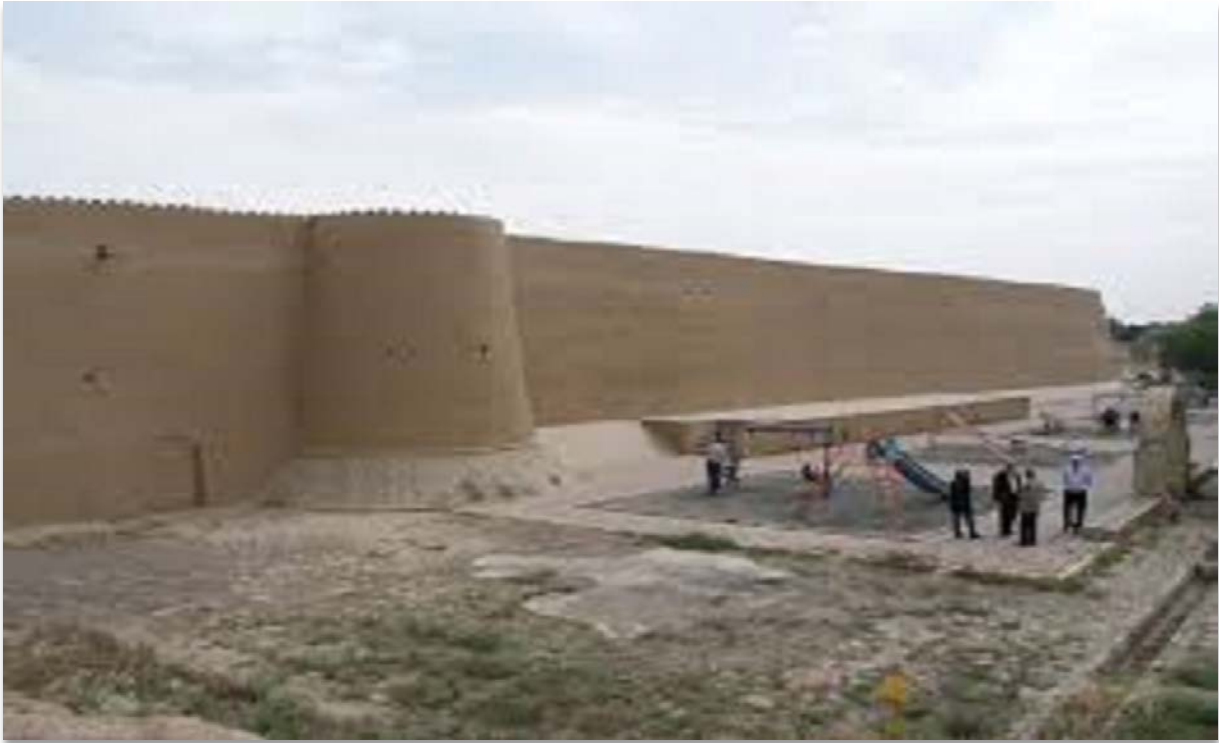
Günümüzde Celali Kalesi'nin duvarları