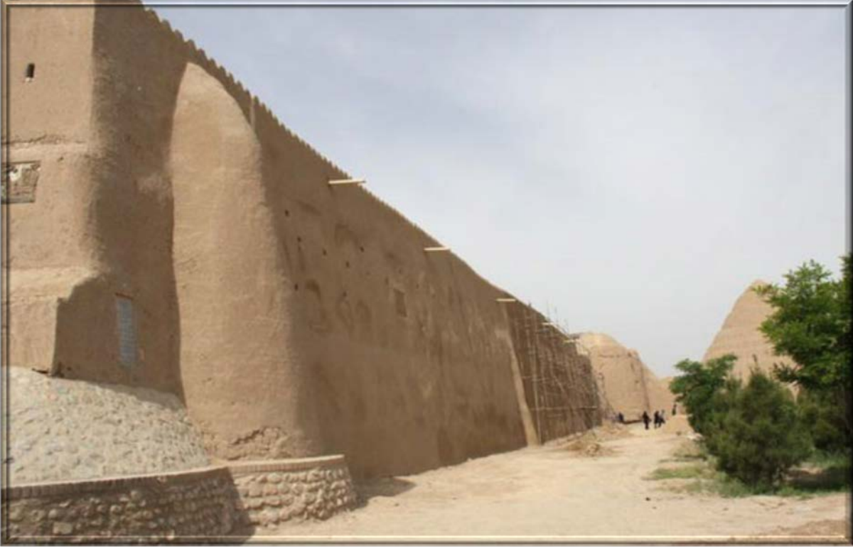
Celali Kalesi'nin duvar kalıntıları