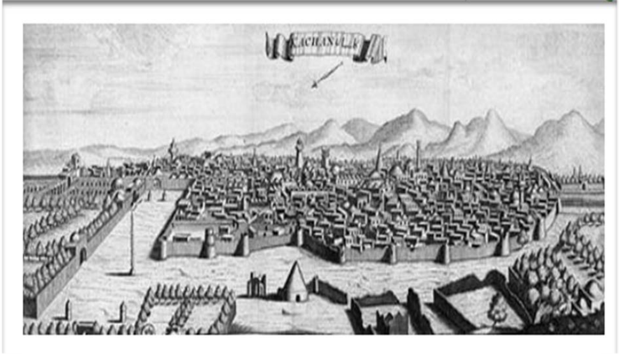
Şarden Seyahatnamesi'nden Kaşan'ın fotoğrafı