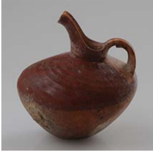
Figür 9: “ Intermediate ” seramik kültürüne ait monokrom gaga ağızlı testi

Boya bezemeli “ Intermediate ” seramik geleneğini yansıtan güzel bir örnek 2016/M10 numaralı mezar içerisinde ele geçmiştir. Devetüyü astarlı bir yuvarlak ağızlı testinin gövdesi “ Intermediate ” seramik geleneğini yansıtacak biçimde kırmızımsı-kahverengi renkte boya ile bezenirken, boyun kısmı yine bezeme ile aynı renkte bu kez tüm boynu kaplayacak şekilde boyanmıştır (Figür 10). Bu tip seramik örnekleri Kültepe’de gerçekleştirilen kazılarda 12. tabakadan itibaren görülmeye başlar.