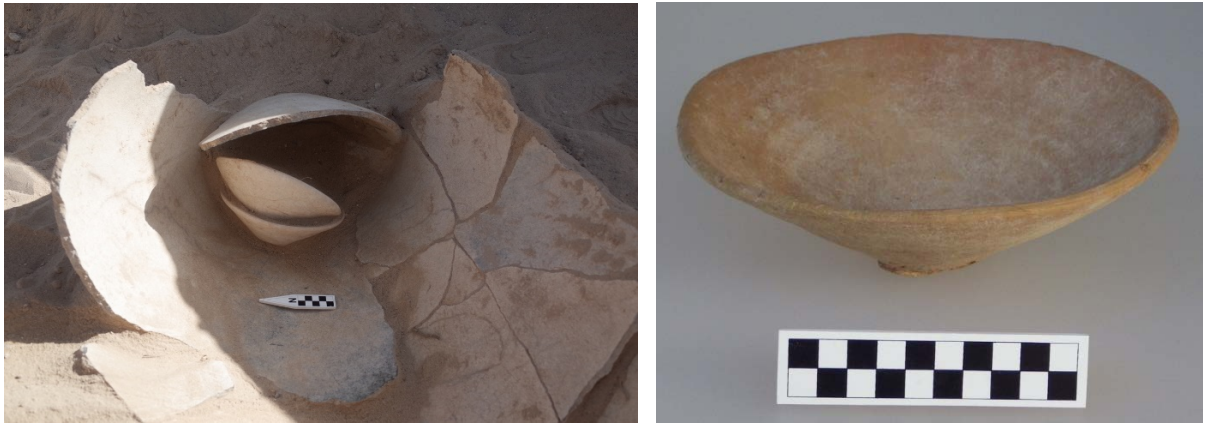
Figür 7: 2014/M07 numaralı mezar ve içerisinde ele geçen “Troia tabağı”

Bununla birlikte, 2014/M07 numaralı mezar gibi, bazı küçük boyutlu mezarlar ise önemli buluntular sunmuştur. Bu mezar içerisinde, kötü korunmuş durumdaki bir insan kafatası ile birlikte ölü eşyası olarak bırakılan ve arkeoloji literatürüne “Troia tabağı” olarak geçen seramiğin yerli taklidi bir tabağın ele geçmesi, mezarların tarihlenmesinde önemli bir rol oynamaktadır (Figür 7). Batı Anadolu kökenli olan bu kap formunun İnler Dağı Mezarlığı’nda ele geçmesi, bu mezarlığın sahiplerinin, Batı Anadolu ile etkileşimde olduklarını göstermektedir. Çeşitli varyasyonları olan Troia tabakları, Kültepe’de ilk kez Erken Tunç Çağı III dönemine ortaya çıkar.