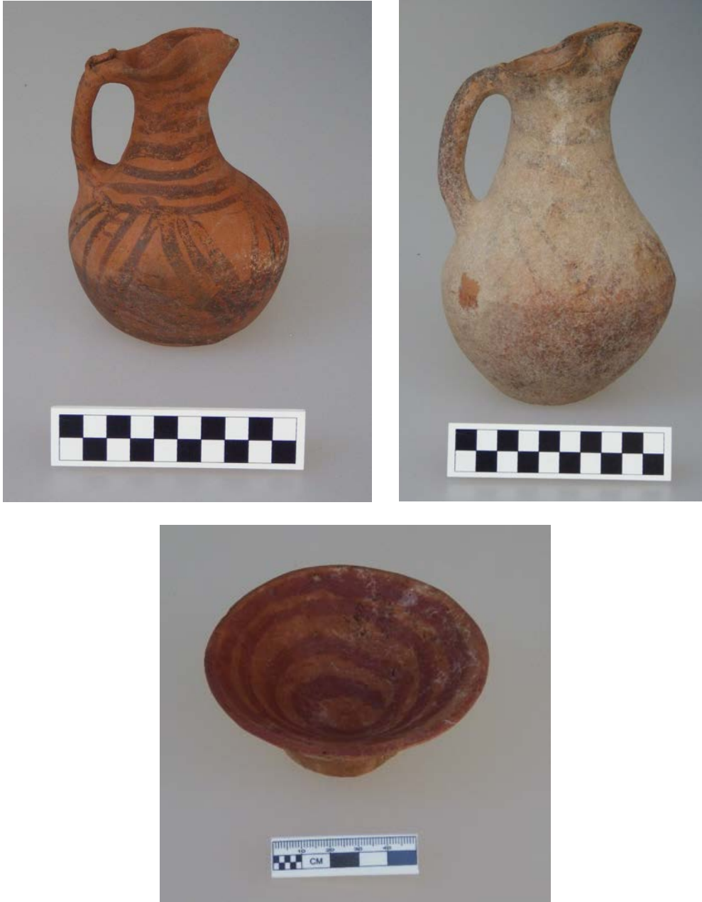
Figür 15: Kilikya Bölgesi'nden (?) ithal iki yonca ağızlı testi ve pedestal kaideli bir kase

2016/M02 numaralı mezar içerisinde ele geçen ve daha önce Kültepe-Kaniş'in 12. ve 11b tabaka buluntularından da bildiğimiz bir çift kulplu bardak, güney komşuları ile kurulan kültürel ilişkilerin bir diğer kanıtıdır (T. Özgüç, "New Observations on the Relationship..." 1986, Fig. 3:29, 30). İç çukuk ağızlı, düz dipli ve mika katkılı bu bardak çark yapımıdır. Devetüyü renkte hamurlu bardağın yüzeyi herhangi bir astarlama yapılmadan bırakılıp, çok iyi pişirilmiştir (Figür 16).