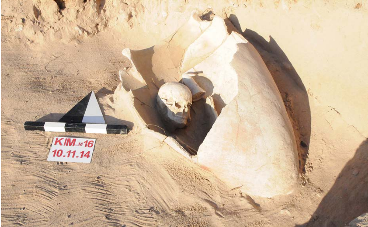
Figür 12: 2014 yılında açığa çıkartılan M/16 numaralı mezardan bir görünüm

İnler Dağı Mezarlığı'nın yamacında gerçekleştirilen araştırmalarda tespit edilen ve 2014/M16 olarak isimlendirilen bir mezar, konumu nedeniyle erozyondan dolayı tahrip olmuştur. Buna rağmen, mezar içerisindeki iskeletin bacak kemikleri kısmen, kafatası ise tamamen korunmuş vaziyette ele geçmiştir (Figür 12).