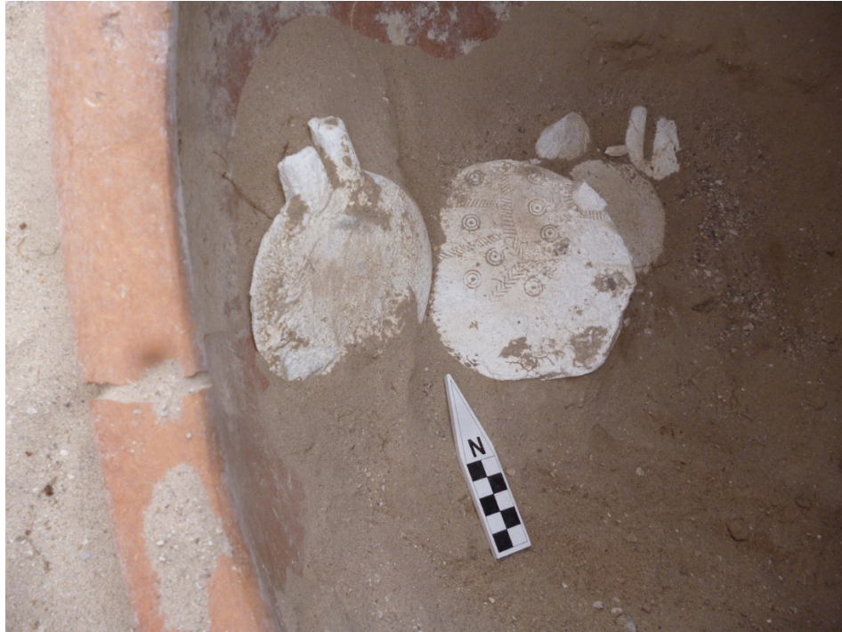
Figür 11: 2015 yılında açığa çıkartılan M/23 numaralı mezar ve içerisinden ele geçen Kültepe tipi alabaster idoller