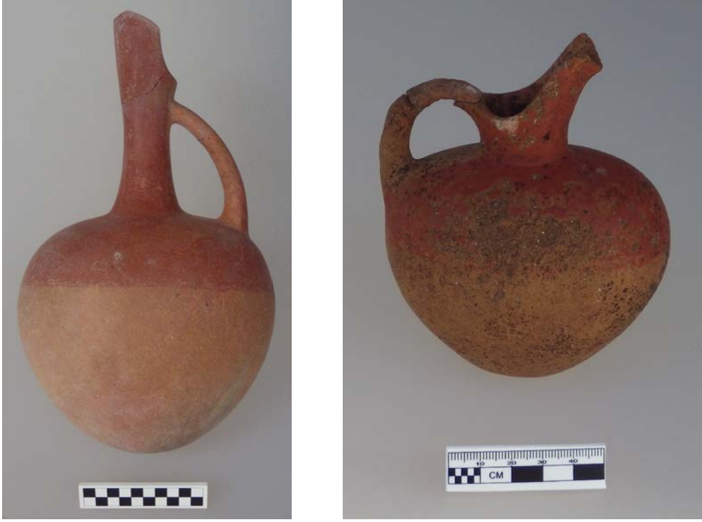
Figür 14: 2016/M05 ve 2016/M17 numaralı mezarlarda ele geçen gaga ağızlı testi örnekleri

merkezlerde pek yaygın olmasa da, gövdesinin üst yarısının kırmızı boya ile boyanması bu kabın Orta Anadolu geleneğinde üretilmiş olduğunu gösterir. Bu testinin bir başka benzeri 2016/M17 numaralı mezar içerisinde ele geçmiştir. Yine aynı gelenekte bezenmiş bu testi, daha küçük boyutlu ve kısa boyunlu olmasıyla diğer örnekten farklılık göstermektedir (Figür 14).