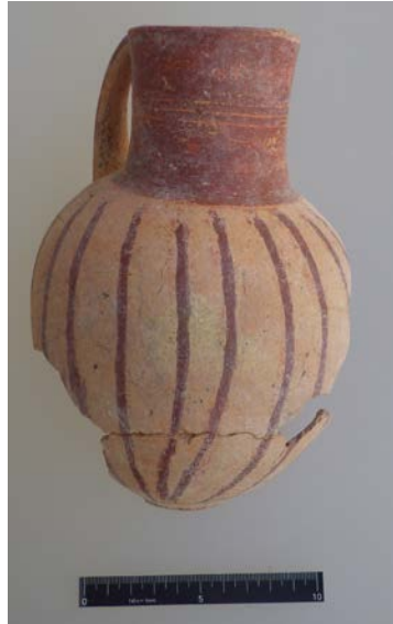
Figür 10: “ Intermediate ” boya bezemeli yuvarlak ağızlı testi

Boya bezemeli “ Intermediate ” seramik geleneğini yansıtan güzel bir örnek 2016/M10 numaralı mezar içerisinde ele geçmiştir. Devetüyü astarlı bir yuvarlak ağızlı testinin gövdesi “ Intermediate ” seramik geleneğini yansıtacak biçimde kırmızımsı-kahverengi renkte boya ile bezenirken, boyun kısmı yine bezeme ile aynı renkte bu kez tüm boynu kaplayacak şekilde boyanmıştır (Figür 10). Bu tip seramik örnekleri Kültepe’de gerçekleştirilen kazılarda 12. tabakadan itibaren görülmeye başlar.