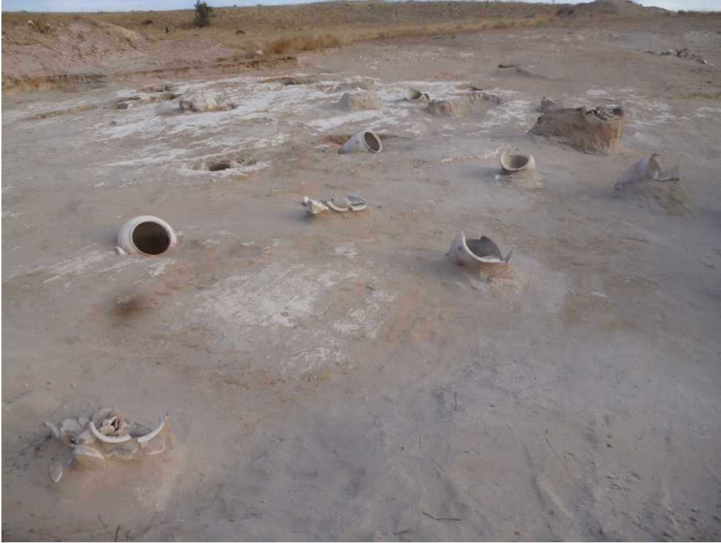
Figür 5: Kültepe İnler Dağı Mezarlığı'nda ele geçen küp mezarlar

Mezarları küplerinin boyları yaklaşık 150 santimetredir. Kaba hamurlu ve düşük ısıda pişirilen mezar küpleri, ince cidarlıdır. Bu nedenle, bazen mezar küpünü desteklemek için ikinci bir küpe ihtiyaç duyulmuştur. Mezarların üzerini örten kumun ve toprağın içindeki kireç oranının yüksek olması, kemiklere ve küplere önemli derecede zarar vermiştir.