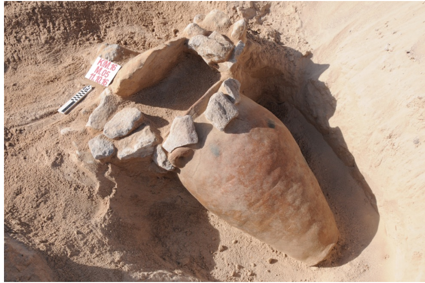
Figür 6: Ağızı doğrudan sal taşları ile kapatılan küp mezar örneği (üstte) ve küpün ağızının önce orta boy taşlarla kapatıldığı, sonra ise dışarıdan sal taşları kullanılarak desteklenen küp mezar örneği (altta)

İnler Dağı Mezarlığı'nda yürütülen çalışmalarda dikkati çeken hususlardan birisi de, bazı mezarlarda ne insan iskeletine ilişkin herhangi bir kalıntının, ne de ölüye ait bir eşyanın ele geçmiş olmasıdır. Bu duruma örnek teşkil edebilecek 2014/M03 numaralı mezar, İnler Dağı Mezarlığı'nda bugüne kadar yapılan çalışmalarda ele geçen en büyük mezarlardan biri olmasına ve herhangi bir kaçak