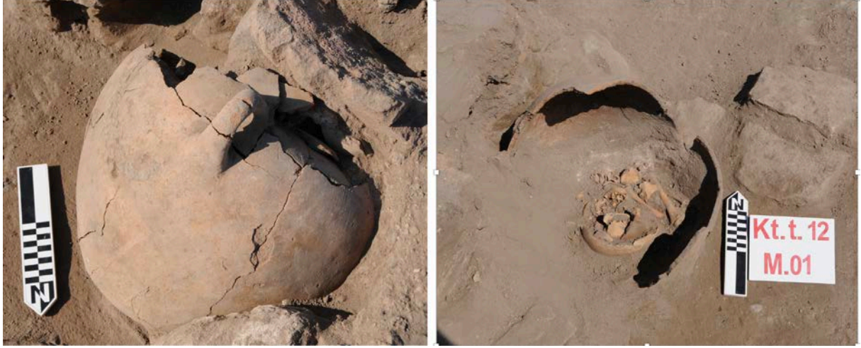
Figür 3: Kültepe'nin Erken Tunç Çağı III döneminin sonuna tarihlendirilen 11. tabakasında açığa çıkartılan bir çömlek mezar

Kültepe'nin Erken Tunç Çağı III dönemine ait mezar kalıntılarında bir diğeri de 2012 yılı kazı sezonunda açığa çıkartılmıştır. Bu mezar Kültepe-Kaniş'in Erken Tunç Çağı III döneminin sonuna tarihlendirilen 11. tabakasında açığa çıkarılmıştır. 2012/M01 numaralı bu çömlek mezar, dolgu toprak içerisine ağzı yukarı bakacak şekilde yerleştirilmiş. Mezarın kaymasını engellemek ve içerisindeki ceseti korumak amacıyla çömleğin ağız kısmına ve etrafına sal taşları yerleştirilmiştir (Figür 3). Mezar içerisinden herhangi bir ölü eşyası ele geçmemiştir.