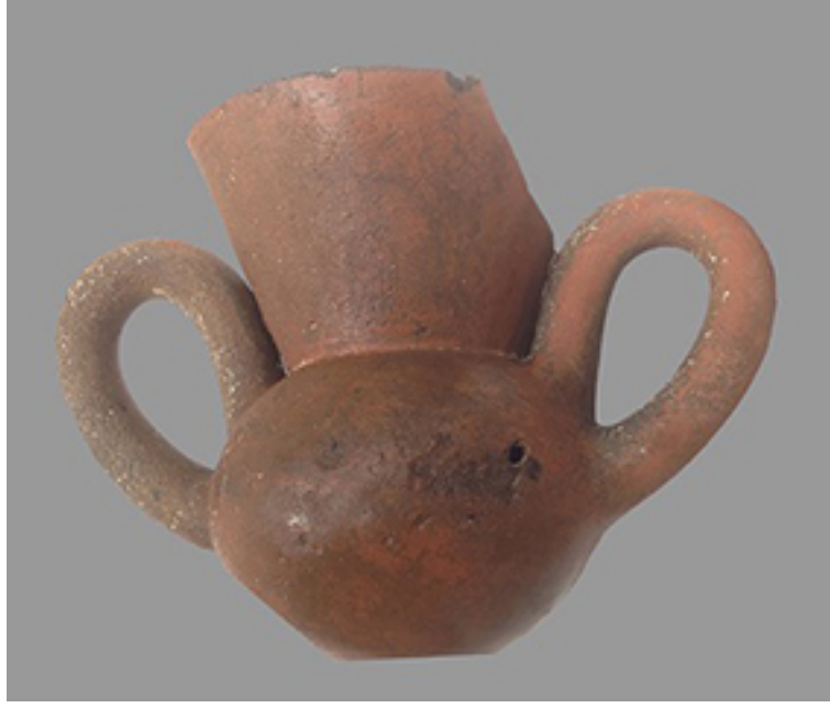
Figür 8: Çift kulplu tankard örneği 2014/M09

2014 kazı sezonu içerisinde ele geçen ve 2014/M19 numaralı bir küp mezar, zengin ölü eşyaları ile dikkat çekmektedir. Herhangi bir kaçak kazı tahribatı görülmeyen bu mezar içerisinde herhangi bir iskelet kalıntısı ele geçmemiştir. Buna rağmen mezar içerisinde “ intermediate ” seramik grubuna ait iki gaga ağızlı testi ve bunun yanı sıra bir tabak ve bronz bir bilezik ele geçmiştir. İlk kez Alişar hafirleri tarafından tanımlanan ve boya bezemeli seramik geleneğini yansıtan “ intermediate ” 3 (von der Osten 230) seramik örnekleri, Kültepe ve çevresinde yerli seramik geleneğini yansıtır (T. Özgüç, “Yeni Araştırmaların Işığında...” 34). Intermediate seramik kültürü, yalnızca boya bezemeli seramik türünden oluşmaz. Bu kültürü karakterize eden monokrom seramik örnekleri de mevcuttur (Kulakoglu, “Current Research at Kültepe” Fig. 8). Bu tipe giren “ intermediate ” seramik örneklerinde, bazen kabın bir kısmına bazen de tamamına uygulanan astar ve perdahlama işlemi dikkati çeker. Ancak karakteristik olarak görebileceğimiz ince ve sığ yivler, kabın genellikle boyun bazen de gövdesi üzerine uygulanmıştır (Figür 9).