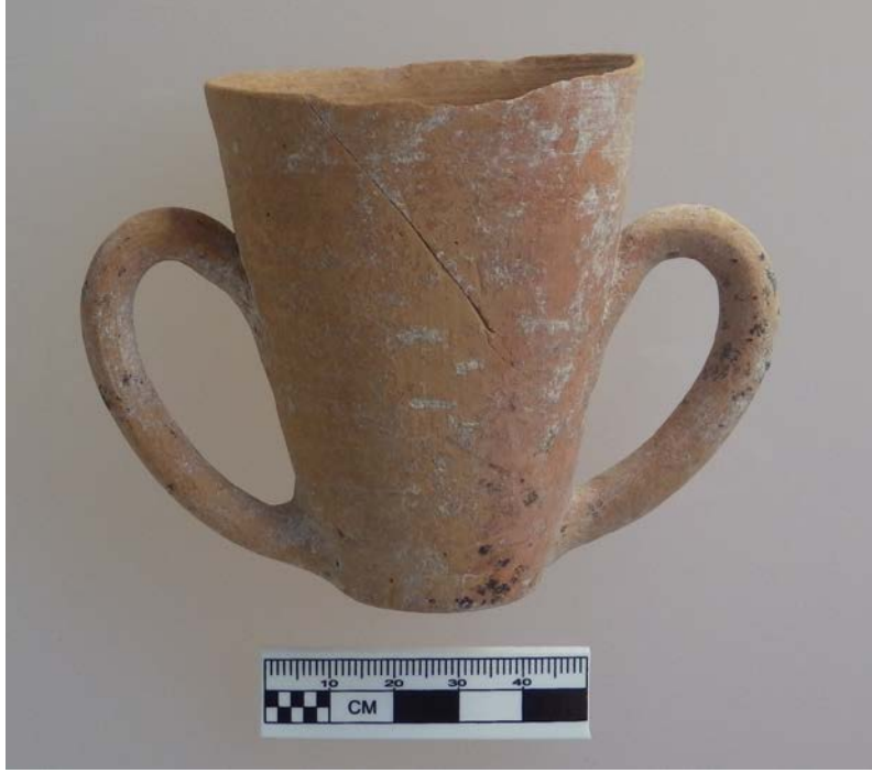
Figür 16: “Simple ware” grubundan çift kulplu bardak.