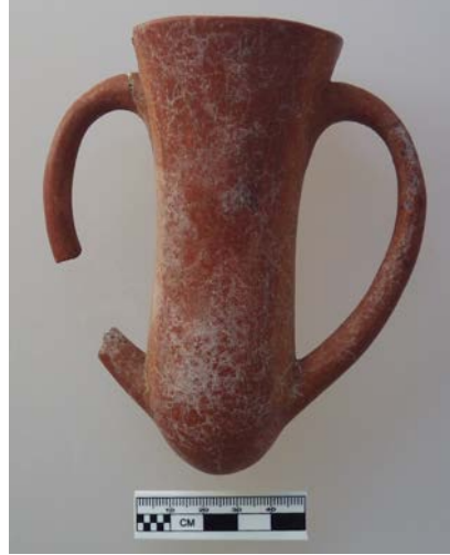
Figür 13: 2016/M05 numaralı mezar ve bu mezar küpünün ağız kenarına bırakılmış “Kültepe tipi depas ”

2016/M05 numaralı mezar içerisine, Orta Anadolu’daki yerleşimlerde yaygın kullanıma sahip olmayan bir kap ölü hediyesi olarak bırakılmıştır. Yassı gövdeli, uzun boyunlu ve kesik gaga ağızlı bu testi, form olarak Orta Anadolu’daki