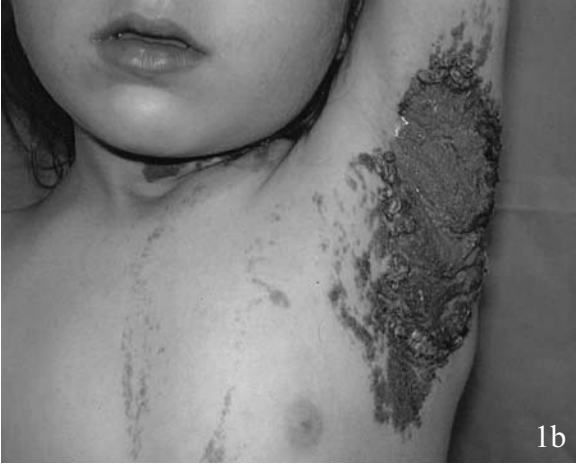
Resim 1A-1B: Hastanın preoperative görünümü. Lezyonlar yaygın bir şekilde scalp, aksilla, boyunda izlenmekte.