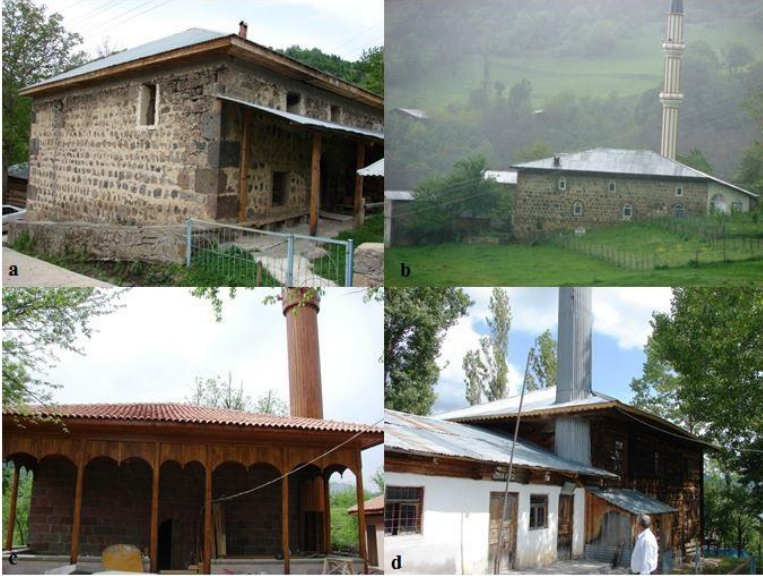
Fotoğraf 5. Sahada çok sayıda tarihi cami bulunmaktadır: Zor Mustafa Bey (a), Cevizli (b), Kocabey (c) ve Çoraklı (d) camileri bunlardan bazılarıdır.

XVI. yüzyılda bu camiyi yaptırmıştır (Aytekin, Ortaçağdan Osmanlı Dönemi Sonuna Kadar Artvin'de Mimari Eserler , s.201; Özdede, 2009:128). Kareye yakın bir dikdörtgen planında yapılan cami, dolgu duvar tekniği (yer yer kesme taş da kullanılmıştır) ile inşa edilmiş olup, minaresi bulunmamaktadır. Günümüzde ibadete açıktır. Aynı köy içerisinde önemli oranda tahrip olmuş bir kilise (Rabat kilisesi) ile Zor Mustafa Bey'in konağı ve türbesi de bulunmaktadır.