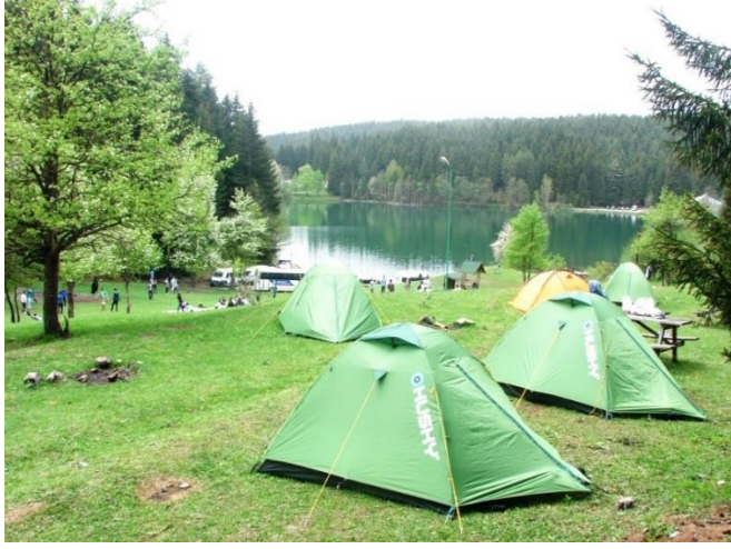
Fotoğraf 3. Sahadaki en önemli turizm ve rekreasyon alanı, Karagöl ve çevresi.

Turistik çekicilikler içerisinde ele alınabilecek olan diğer hidrografik kaynaklar, termal ve mineralli sulardır. Bununla birlikte, sıcak su kaynaklarının termal turizm bakımından daha fazla rağbet gördüğü bilinmektedir (Selvi, “Sağlık Turizmi”, s.275). Sahanın tek termal kaynağı olan (suyun sıcaklığı 36 °C olarak ölçülmüştür) Çoraklı (Mikelet) çermeği, bu bakımdan ele alınmalı ve turizme kazandırılması noktasında gerekli çalışmalar yapılmalıdır.