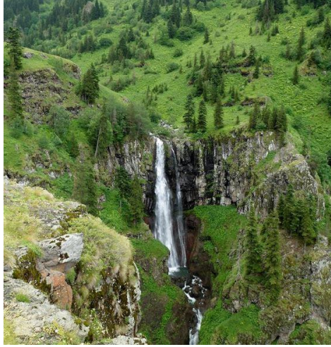
Fotoğraf 2. Kirazlı ve Aşağı Koyunlu köyleri arasındaki Su Atılan şelalesinden bir görünüm.

Göller, sessiz ve sakin ortam sunmaları; yürüyüş, bisiklete binmek, fotoğraf çekmek, kamp ve piknik yapmak, manzara seyretmek, avcılık vb. bir takım rekreasyonel faaliyetlere imkân sağlamaları gibi avantajları sayesinde, önemli oranda ekoturizm potansiyeli barındıran yerlerdir (Doğaner, Türkiye Turizm Coğrafyası , s.81). Şavşat ilçesi sınırları içerisinde de, bu açıdan değerlendirilebilecek, potansiyel turistik değeri yüksek göller bulunmaktadır. Nitekim günümüzde, sahadaki en önemli turizm ve rekreasyon alanlarının başında, Meşeli köyünde yer alan Karagöl ve çevresi gelmektedir. Bununla birlikte, ilçede yer alan Arsiyan gölleri, Bilbilan yaylası yakınlarındaki Karagöller, Kazan (Samamiyet) gölleri, Akgöl, Balık ve Maden gibi bazı göller, bu açıdan değerlendirilmeyi bekleyen hidro-turistik kaynaklardandır.