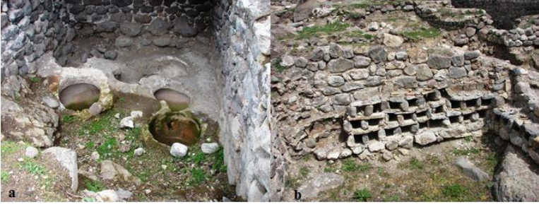
Fotoğraf 7. Kazılar esnasında ortaya çıkan silo veya şarap mahseni (a) ile ilaç depolama gözelerinden (b) bir görünüm. 1