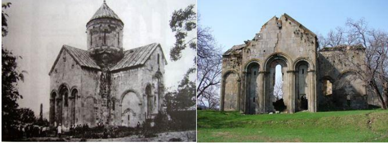
Fotoğraf 4. Cevizli manastırının eski (Korkut, s.154'ten) ve günümüzdeki hali.

turistik önemini artırmaktadır. Buna göre, sahanın koruma altına alınarak, gerekli etüt ve restorasyonların yapılması ve tanıtımının sağlanması sonucunda, yörenin önemli bir kültür ve inanç turizmi merkezi haline gelebileceği kanaatindeyiz.