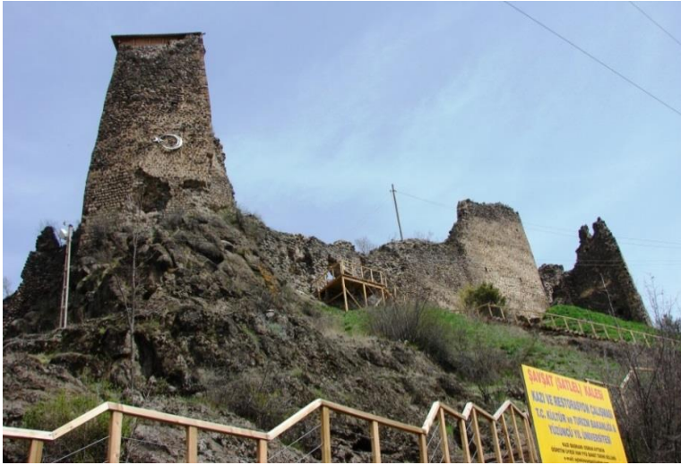
Fotoğraf 6. Günümüzde restorasyon çalışmaları devam eden Şavşat kalesi.

Kadar Artvin'de Mimari Eserler , s.257-259; AYTEKİN, "Şavşat (Sattel) Kalesi Kazısı", s.238-239) (Fotoğraf 6). Şavşat kasabasının Artvin yönündeki giriş kısmında (yaklaşık 2 km mesafede), Söğütlü mahallesi sınırları içerisinde yer alan kalenin, kitabesi bulunmaması nedeniyle tam olarak ne zaman yapıldığı bilinmemektedir. Ancak plan ve mimari özellikleri ile yörede yaygın olarak rastlanılan Bagratlı Krallığı kalelerine olan benzerliği göz önüne alındığında, IX. yüzyılda inşa edilmiş olabileceği tahmin edilmektedir. Ciritdüzü ve Tigrat dereleri arasında kalan kesimde, yüksekçe bir ana kayanın üzerinde kurulmuş olan kalenin, iç alan genişliği yaklaşık 4 bin m 2 kadardır. Kale surlarının kalınlığı yer yer 1.5 m'yi aşmakta olup, yükselteleri 10 m'ye ulaşmaktadır. Bünyesinde barındırdığı kule, şapel, sarnıç, şarap mahzeni, silo, hamam, bey konağı, tandır ve eczane/ilâç depolama gözeleri (Fotoğraf 7) gibi bölümleri ile oldukça ilgi çekicidir.