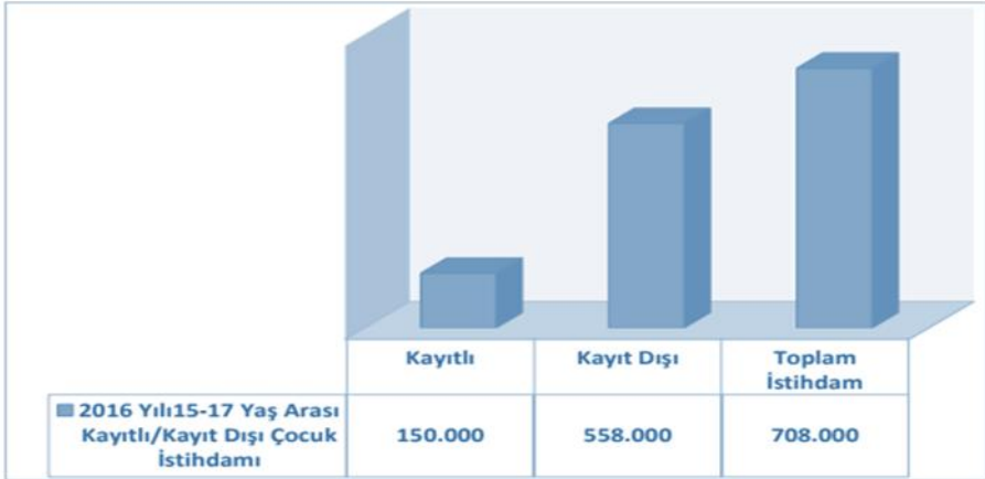
Grafik 2 - Kayıtlı/Kayıt Dışı Çocuk İşçi Sayısı (15-17 Yaş Arası, 2016)

Türkiye’deki 15 – 17 arası çocuk işçi sayısı 2012 yılında 601 bin iken 2014 yılında 709 bin, 2015 yılında 716 bin, 2016 yılında ise 708 bindir.