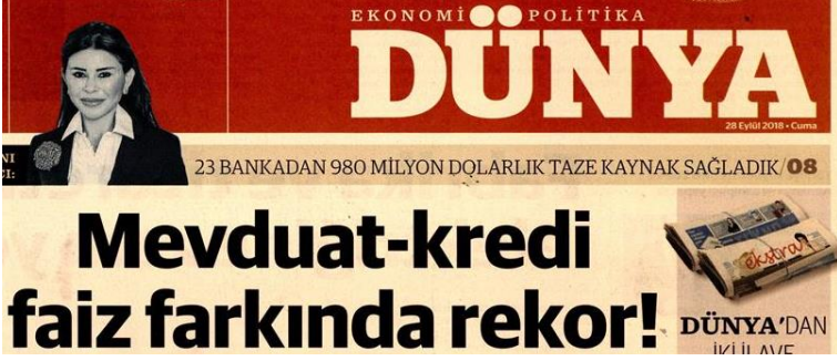
Şekil 19. Dünya Gazetesi

Stil; Düz (romen), tırnaksız (sans serif). Harf et kalınlığı bold. Yazı büyüklüğü 70 punto üzerinde. Renk; Harf siyah, zemin açık kahverengi. Espas; Kelime arası espası normal, harf arası espası normal, satır arası espası normal. Okunabilirlik; Küçük harfli, siyah yazıdan oluşan manşetin okunabilirlik düzeyi normal.