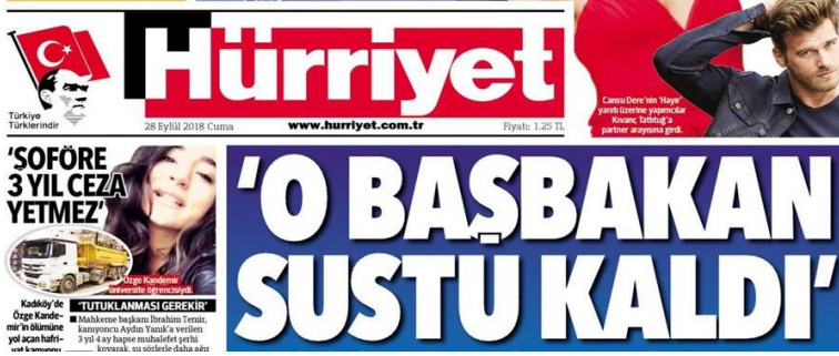
Şekil 12. Hürriyet Gazetesi

Stil; Düz (romen), tırnaksız (sans serif), negatif yazı. Harf et kalınlığı extra bold. Yazı büyüklüğü 100 punto üzerinde. Renk; Mavi zemin ve harf gövdesi boş(beyaz). Espas; kelime arası espası normal, satır arası espası az, harf arası espası verilmeyerek bitişik bir tasarım ortaya çıkmış. Okunabilirlik; harf arası espasının olmaması okunabilirliği azaltmış olmasına rağmen okunabilirlik düzeyi yüksek.