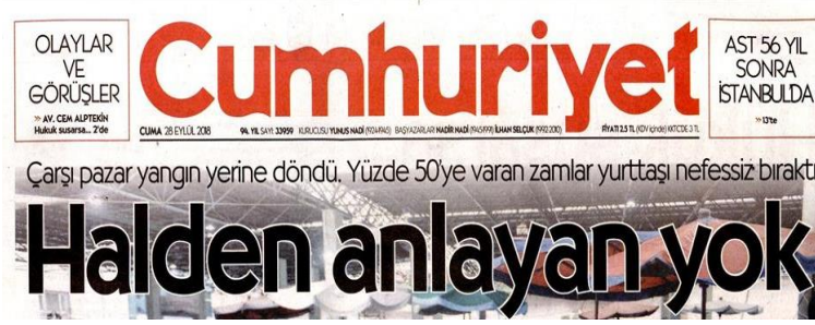
Şekil 13. Hürriyet Gazetesi

Stil; Düz (romen), tırnaksız (sans serif). Harf et kalınlığı normal (medium). Yazı büyüklüğü 80 punto üzerinde. Renk; Gri görselli zemin ve harfler siyah. Espas; kelime arası espası normal, harf arası espası az. Okunabilirlik; Gri zeminli görsel fonu üstüne siyah seçilmesi okunabilirlik düzeyini düşürmüş.