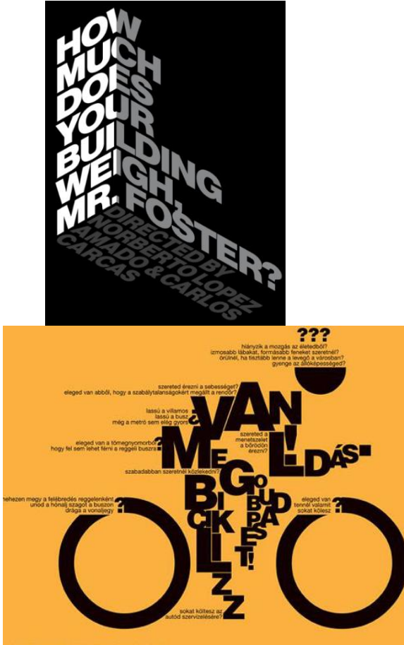
Şekil 1. Tipografik tasarım örnekleri

( http://www.graphicart-news.com/amazing-typographic-projects )