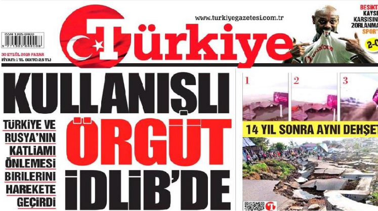
Şekil 14. Türkiye Gazetesi

Stil; düz (romen), tırnaksız (sans serif). Harf et kalınlığı bold. Yazı büyüklüğü 100 punto üzerinde. Renk; Siyah ve kırmızı. Espas; harf arası espası az, kelime arası espası az, satır arası espası az. Satır uzunluğu kısa tutularak üç satır oluşturulmuş. Okunabilirlik; espasının değerlerinin az kullanılmış fakat ortadaki satırın kırmızı renkli olması ayrıştırıcılık sağlayarak okunabilirlik düzeyini arttırmış.