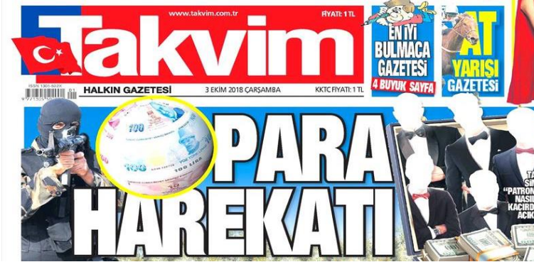
Şekil 17. Takvim Gazetesi

Stil; Düz (romen), tırnaksız (sans serif) negatif, kenarları kontürlü. Harf et kalınlığı bold. Yazı büyüklüğü 100 punto üzeri. Renk; kenarlar lacivert kontürlü, içi beyaz(boş). Espas; Kelime arası espası normal, harf arası espası hiç yok., satır arası espası çok az. Okunabilirlik; Espas değerleri düşük mavi zeminli negatif yazıların punto büyüklüğü yüksek tercih edilerek okunabilirlik düzeyi normal değerlerde.