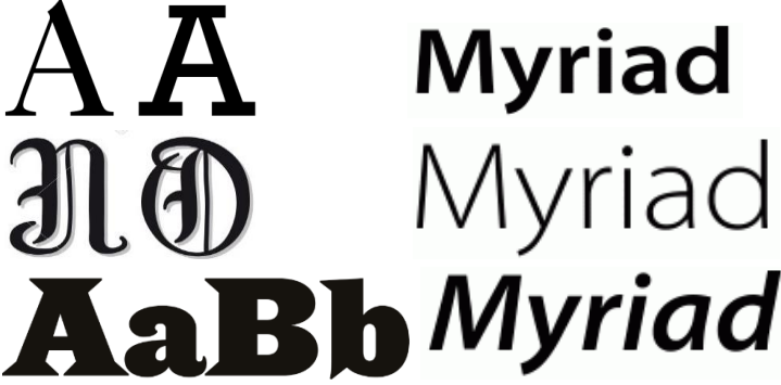
Şekil 4. Farklı serif(tırnak) yazı stilleri