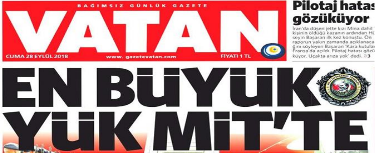
Şekil 16. Vatan Gazetesi

Stil; Düz (romen), tırnaksız (sans serif). Harf et kalınlığı genişletilmiş (expanded) bold. Yazı büyüklüğü 100 punto üzerinde. Renk; siyah. Espas; Harf arası espası az, kelime arası espası normal Okunabilirlik; Zemin kısmı büyük bir kısmı boş siyah renkli yazının okunabilirlik düzeyi yüksek.