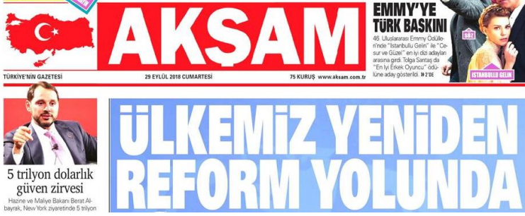
Şekil 21. Akşam Gazetesi

Stil; Düz (romen), tırnaksız (sans serif) negatif. Harf et kalınlığı normal bold. Yazı büyüklüğü 80 punto üzerinde. Renk; Açık mavi zemin ve harf gövdesi boş(beyaz). Espas; Harf arası espası az, Kelime arası espası normal, Satır arası espası az. Satır uzunluğu ideal. Okunabilirlik; Açık mavi zeminli manşetin okunabilirlik düzeyi düşük.