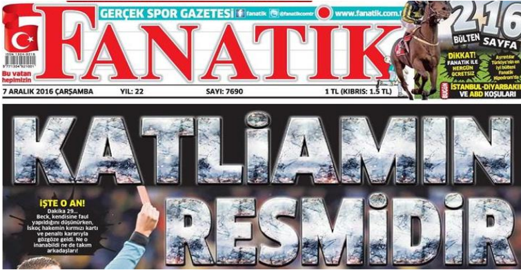
Şekil 20. Fanatik Gazetesi

Stil; Düz (romen), tırnaksız (sans serif) negatif. Harf et kalınlığı extra bold. Yazı büyüklüğü 120 punto üzerinde. Renk; Zemin siyah renk ağırlıklı ve harflerin içi gri dokulu. Espas; Harf arası espası az, satır arası espası normal, Okunabilirlik; Siyah zeminli görsel fonu üzerinde gri dokulu manşetin okunabilirlik düzeyi düşük.