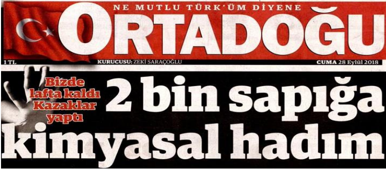
Şekil 18. Ortadoğu Gazetesi

Stil; Düz (romen), tırnaklı (serifli) negatif. Harf et kalınlığı bold. Yazı büyüklüğü 70 punto üzerinde. Renk; zemin siyah, içi beyaz(boş). Espas; Kelime arası espası normal, harf arası espası az, satır arası espası az. Okunabilirlik; Küçük harfli, siyah zeminli negatif manşetin okunabilirlik düzeyi yüksek.