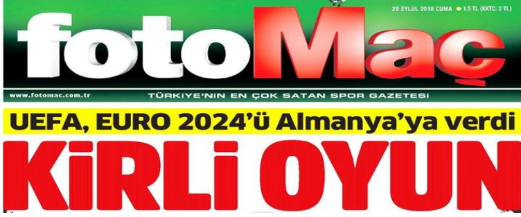
Şekil 15. FotoMaç Gazetesi

Stil; Düz (romen), tırnaksız (sans serif). Harf et kalınlığı extra bold. Yazı büyüklüğü 120 punto üzerinde. Renk; Ateş kırmızısı. Espas; Harf arası espası az, kelime arası espası normal. Okunabilirlik; Zemin kısmı boş kırmızı renkli yazının okunabilirlik düzeyi çok yüksek.