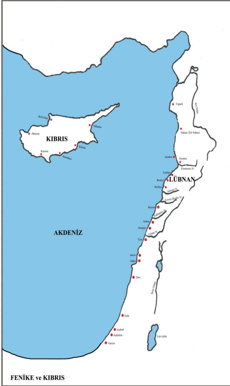
Harita 1: Fenike ve Kıbrıs