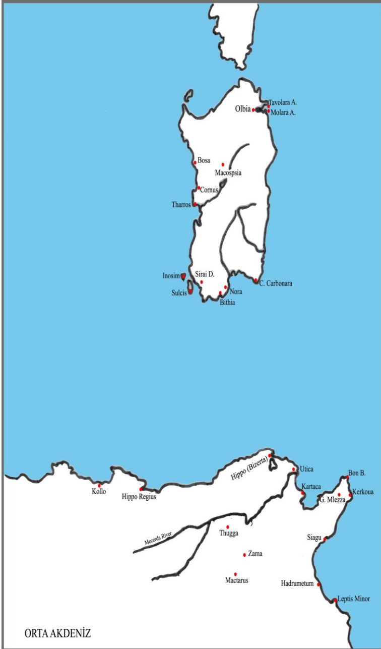
Harita 2: Orta Akdeniz