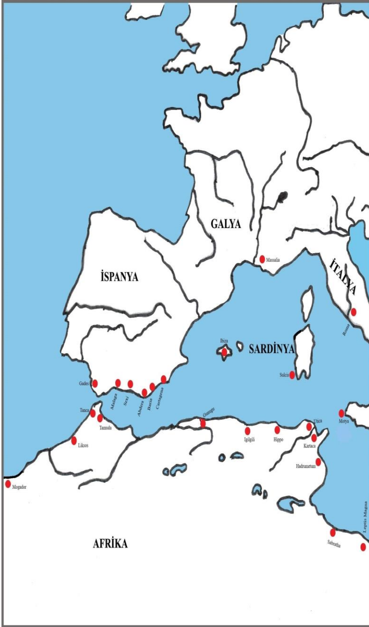
Harita 3: Kuzey Afrika, Fransa ve İspanya