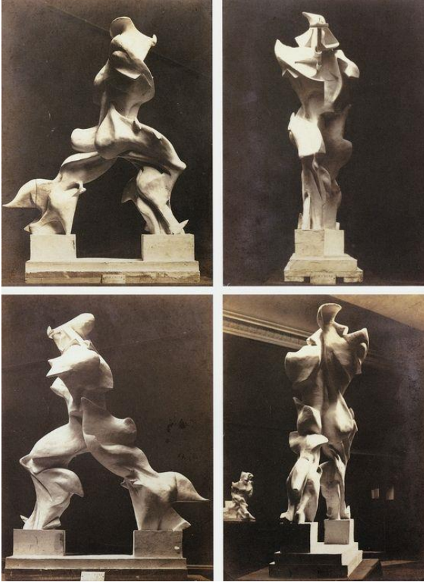
Şekil 3. Uzayda Sürekliliğin Eşsiz Formu, 1913

nesneyi imgelemesi kabul edilemez. Artık sabit bir noktayı resmetmek ve mutlak olanı arama isteği söz konusu bile değildir. Her şeyin hareket ettiği düşüncesi kabul edildiğinden, hiçbir görüntü statik değildir (Öndin, 2019). Fransız düşünür Bergson'un, gerçeklik ve zaman konusundaki görüşleri diğer tüm dönem sanatçılarını etkilediği gibi Boccioni'yi de etkilemiştir. Gerçekliğin her an oluşum halinde olduğu gerçeği, Boccioni'nin "Her şey hareket eder, her şey bir kovalamaca halinde hızla döner. Önümüzdeki figürler bir görünüp bir yok olurlar. Retina üzerinde görüntülerin etkisi, titreşimler halinde algılanır. Koşan bir atın dört değil yirmi dört ayağı var gibi görünür ve o görüntü birden üçgenimsi bir biçim kazanır." şeklindeki görüşü Bergson'un görüşüyle örtüşmektedir.