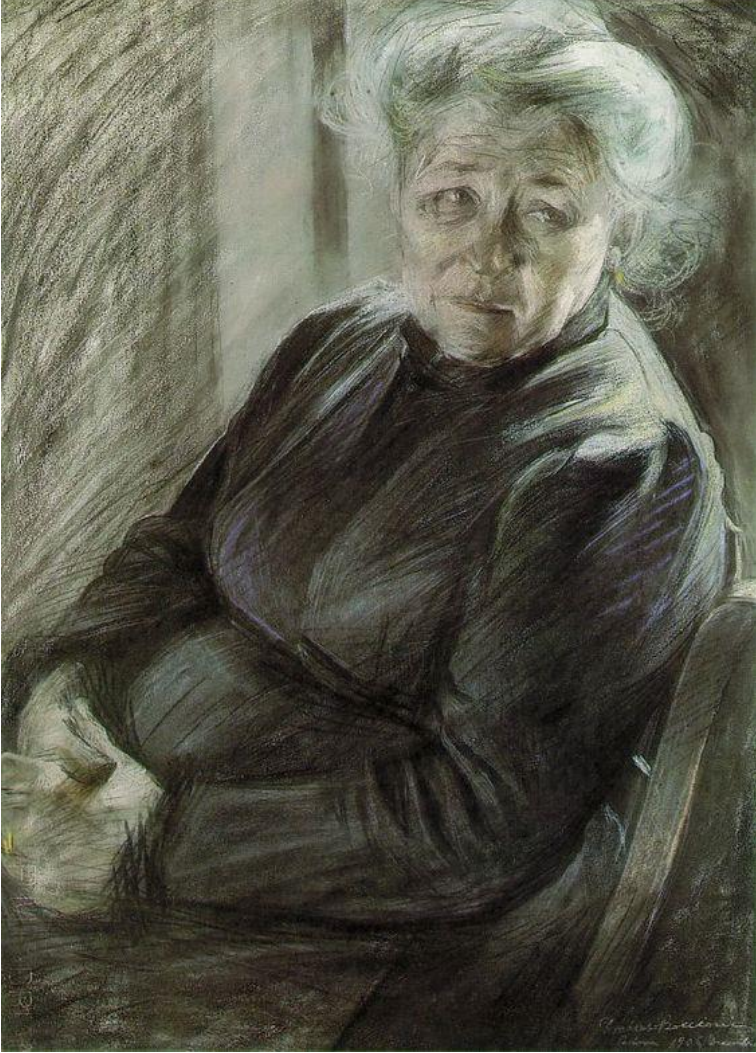
Şekil 1. Boccioni'nin, Annesi, Kâğıt Üzerine Pastel, 72x52, 1906

bunda, geçmiş sanata duyduğu öfke ve ironiden beslenerek, çağdaş mistik sanatın bir manifestosu oluşturulmasını desteklemiştir. Bu öyle bir manifestodur ki Roma'dan başlayarak İtalya'nın diğer tüm şehirlerine, kamu alanlarına, müze ve kiliselere kadar uzanmalıdır (Coen, 1988).