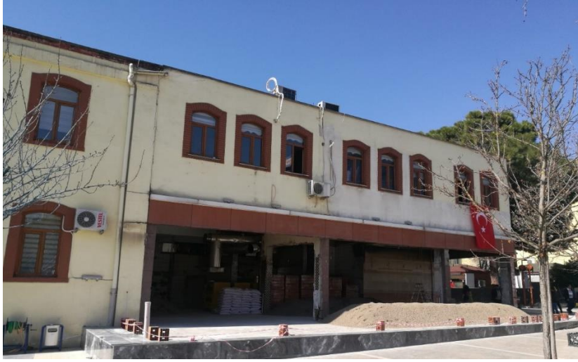
Fotoğraf 6. Hükûmet Konağı'nın kuzey cephesinde muhdes ek hizmet binası