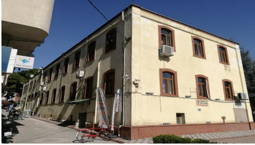
Fotoğraf 3. Hükûmet Konağı'nın güney ve batı cepheleri