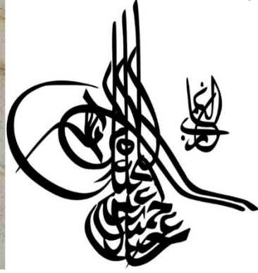
Fotoğraf 5. Oval madalyon ve Sultan II. Abdülhamid tuğrası (Y. ÇETİN)