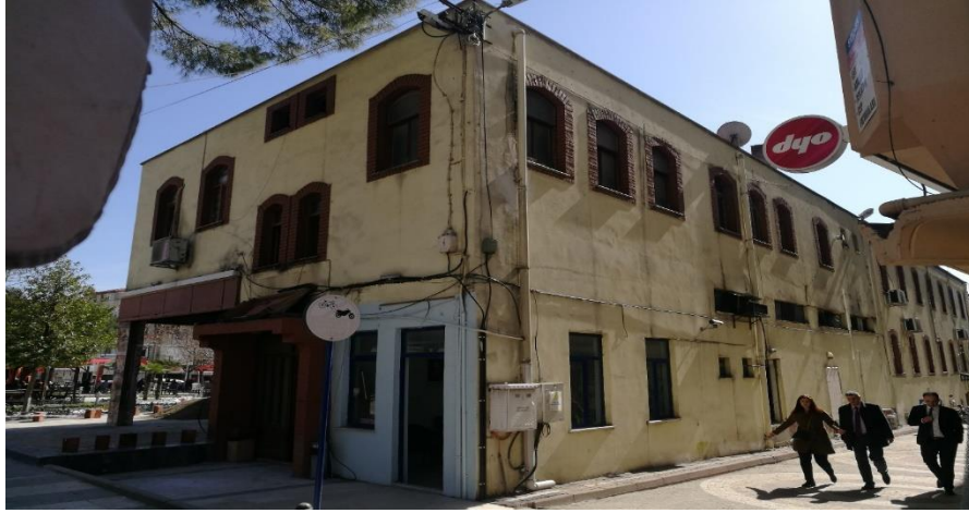
Fotoğraf 4. Hükûmet Konağı'nın kuzey ve batı cepheleri (Y. ÇETİN)