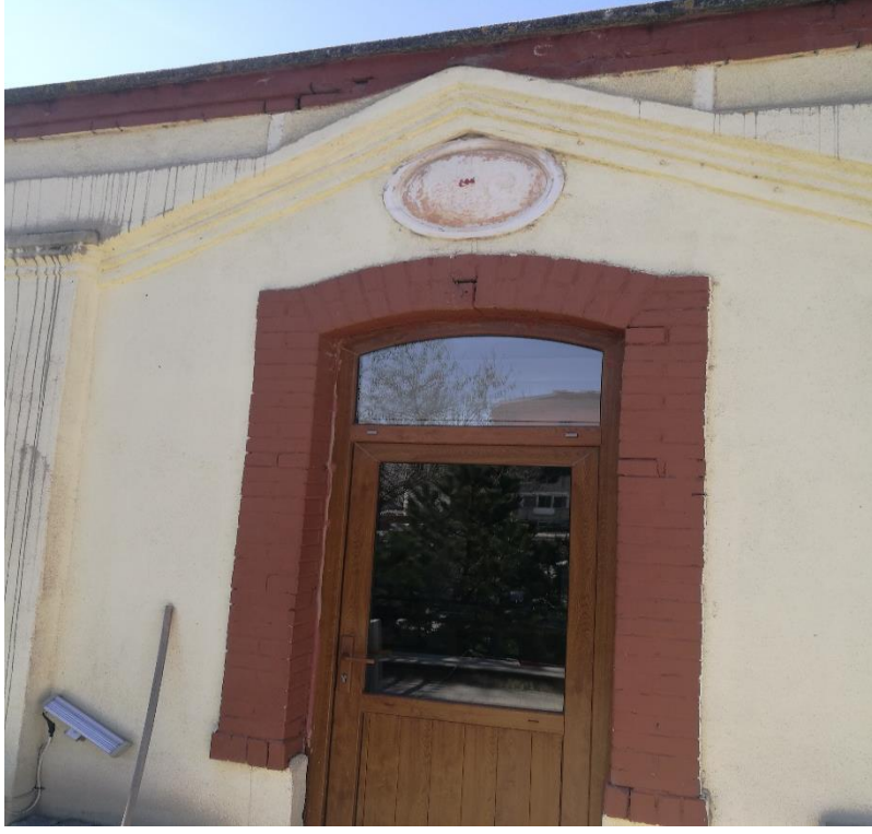
Fotoğraf 7. Giriş cephesinde yer alan üçgen alınlık ve balkon girişi (Y. ÇETİN)