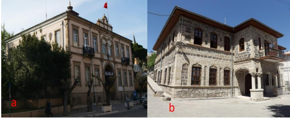
Fotoğraf 13. a. Bergama Hükümet Konağı (XIX. yy. sonu), b. Ergani Hükümet Konağı (1891)