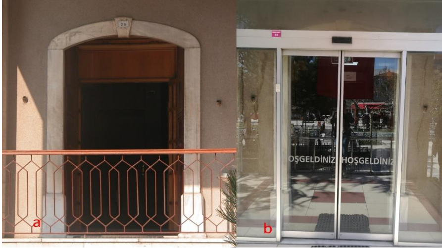
Fotoğraf 8. a. 2005 yılında giriş kapısı görünümü, b. 2020 yılında giriş kapısı görünümü (Y. ÇETİN)