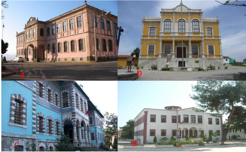
Fotoğraf 12. a. Giresun Hükûmet Konağı (1903), b. Karabük Safranbolu Hükûmet Konağı (1904), c. Kütahya Hükûmet Konağı (1907), d. Muğla Hükûmet Konağı (1906)