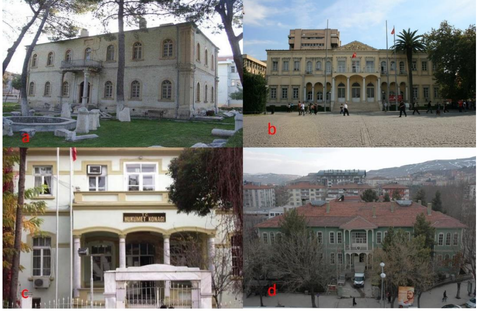
Fotoğraf 11. a. Denizli Çivril Hükûmet Konağı (XIX. yy. sonu), b. İzmir Hükûmet Konağı (1891), c. Kuşadası Hükûmet Konağı (1872), d. Çankırı Hükûmet Konağı (1903)