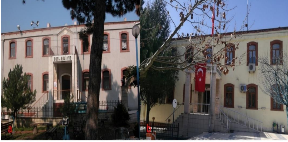
Fotoğraf 1.a. Hükümet Konağı'nın 2005 yılı cephe görüntüsü, b. 2020 yılı cephe görüntüsü