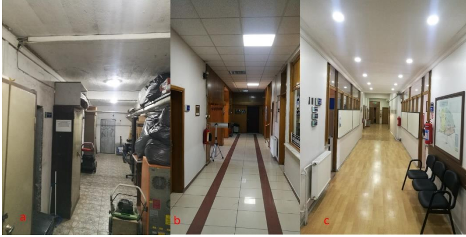
Fotoğraf 10. a. Bodrum kat iç mekânı, b. Zemin kat iç mekânı, c. 1. Kat iç mekânı (Y. ÇETİN)