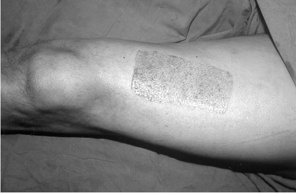
Şekil 1: 10 no'lu hastaya ait greft donör alan