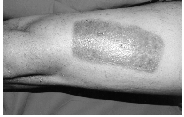
Şekil 3: Postoperatif 24. gün