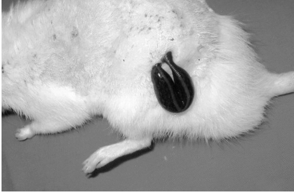
Şekil 1: Sülüğün adriyamin enjekte edilen alana tutturulmuş hali.