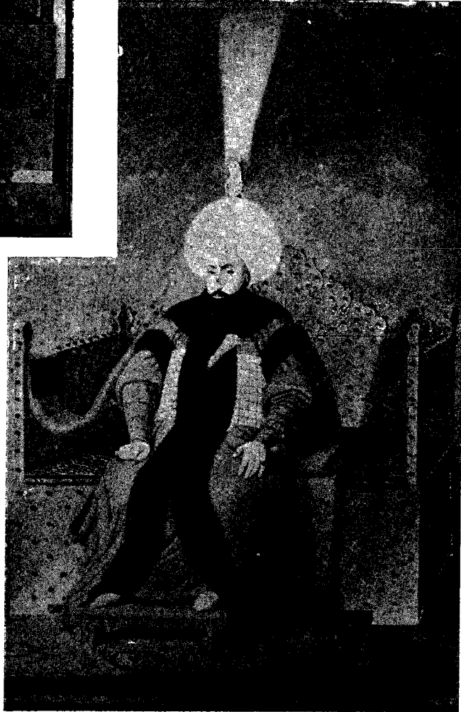
Resim: 4. Mustafa IV (1807 - 1808) Bayram Tahtında (T. K. S. Portre Galerisi No. 17/63)