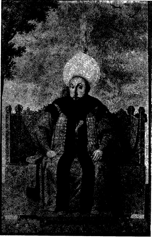
Resim: 3. Mustafa III (1757 - 1774) Bayram Tahtında (T. K. S. Portre Galerisi 17/20)