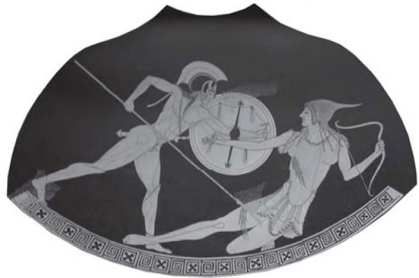
Resim 10: Kalpis-New York Müzesi-M.Ö. 500- (Furtwangler, A.- Reichhold, K., Griechische Vasenmalerei, München, 1932, 1, Taf. 6).