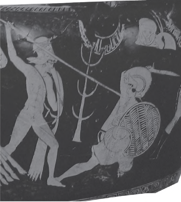
Resim 9: Kraterin d yüzü