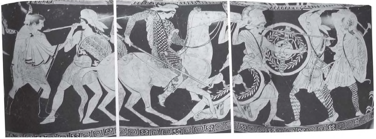
Resim 6: Volütü krater a yüz -New York Müzesi (Dörig, J., "Die Frühe Klasik", Die Griechische Kunts, München, 1984, 122, Abb.166).

Aynı kabın d yüzünde ise mızrak darbesiyle yere yığılan bir Amazon bulunmaktadır (Resim: 9). Sağındaki soylu Yunanlıya, bir Amazon saldırmaktadır. Theseus'un içten ve solundaki yandaşının dıştan gösterilen kalkanı defne dalı ile süslenmiştir. Sanatçının birçok figürü aynı sahneye sığdırması vazoda en göze çarpan yeniliktir. Vazonun kulpları altına denk gelen kısmında ağaç ve otların işlenmesi olayın doğal bir ortamda gerçekleştiğini göstermektedir.