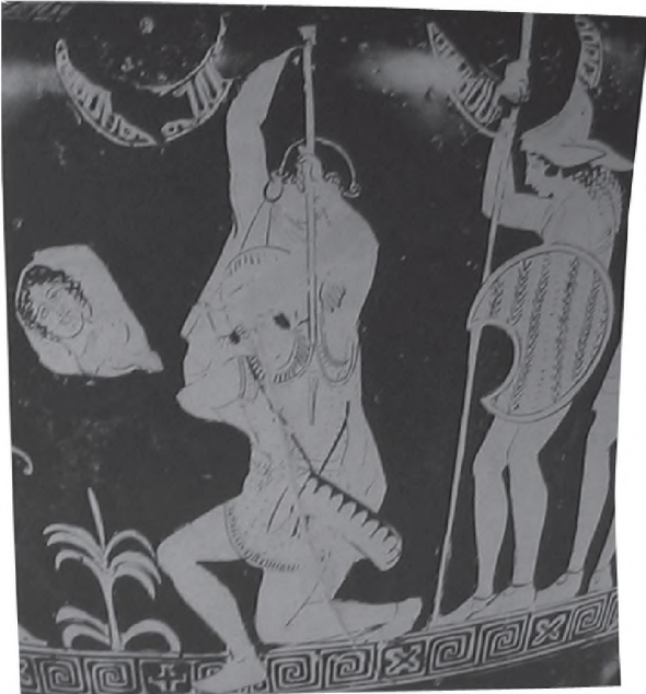
Resim 7: Kraterin b yüzü

Aynı kabın d yüzünde ise mızrak darbesiyle yere yığılan bir Amazon bulunmaktadır (Resim: 9). Sağındaki soylu Yunanlıya, bir Amazon saldırmaktadır. Theseus'un içten ve solundaki yandaşının dıştan gösterilen kalkanı defne dalı ile süslenmiştir. Sanatçının birçok figürü aynı sahneye sığdırması vazoda en göze çarpan yeniliktir. Vazonun kulpları altına denk gelen kısmında ağaç ve otların işlenmesi olayın doğal bir ortamda gerçekleştiğini göstermektedir.