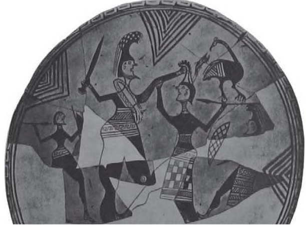
Resim 1: Adak kalkanı-Tiyns- M. Ö. 760-750 (Pumpf. A., Malerei Und Zeichnung Der Klassischen Antike, Berlin, 1953, Taf. 5).

oldukça geniş kemer takmışken, Akhilleus boynundan asılı kılıç kını taşımaktadır. Figürlerin üst kısmının giysili ya da çıplak olup olmadığı belli değildir.