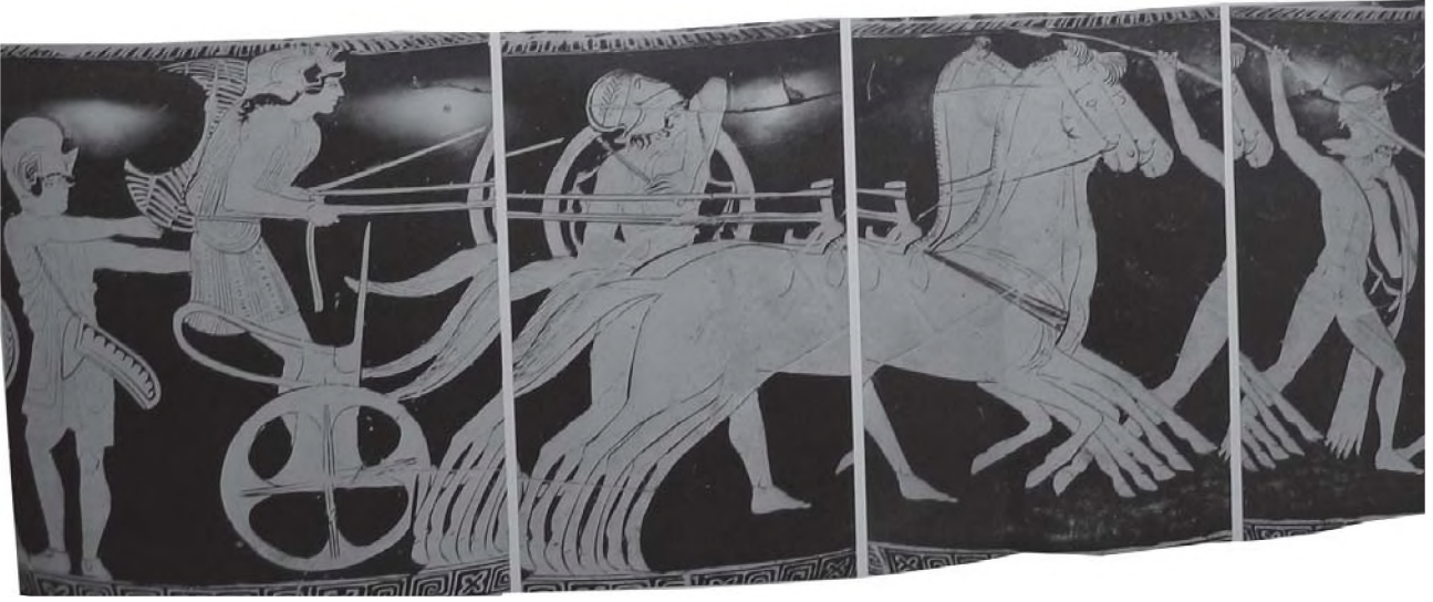
Resim 8: Kraterin c yüzü