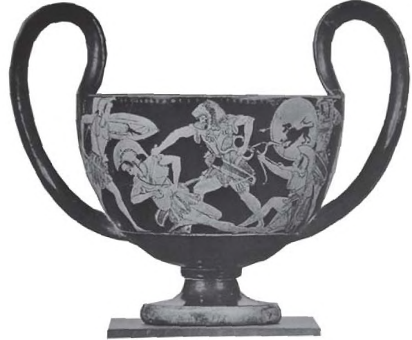
Resim 4: Kantharos-Brüksel Müzesi- M.Ö. 490-480 (Boardman. J., Siyah Figürlü Atina Vazoları (Çev. G. Ergin), Homer Kitabevi, İstanbul, 2002, Res. 298).

elinde yay, sağ elinde kılıç olan Herakles, sağ elindeki kılıcıyla, solundaki Amazon kraliçesinin bağrına darbe indirmek üzeredir. Herakles'in sağında ise diz çökmüş bir Amazon, Herakles'e ok atar halde iken betimlenmiştir. Okçu Amazonun yanında sol elindeki kalkanı üzerinde aslan betimi bulunan Amazon, sağ elindeki mızrağını Herakles'e fırlatırken görülmektedir. Sahnenin en dikkat çekici yanı ise, siyah figür örneklerinde Herakles her zaman solda, Amazon kraliçesi ise sağda resmedilmekte iken bu sahnede figürler yer değiştirmiştir. Sahnede bütün Amazonlar tepeliksiz miğfer takmaktadır ve kısa khiton üzerine zırh giymişlerdir.