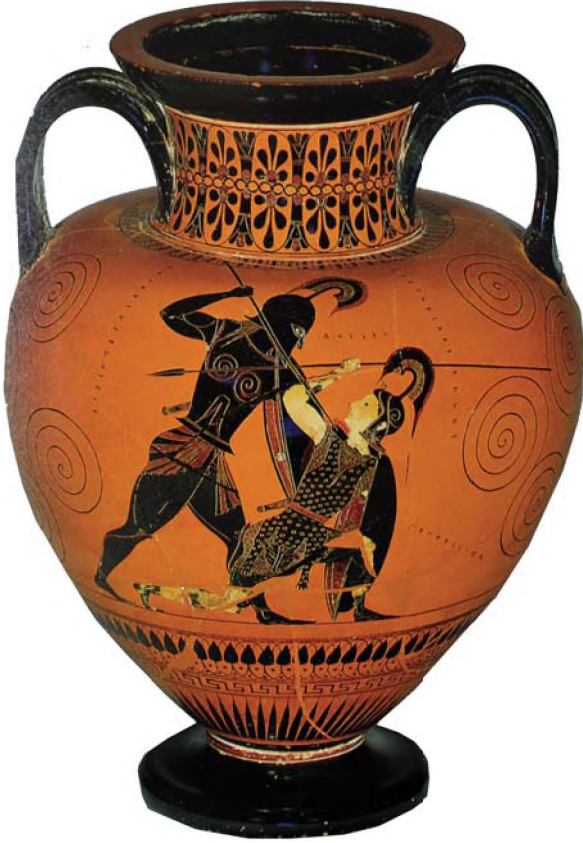
Resim 3: Amphora-British Müzesi (Robertson. M. A., History of Greek Art II, Combridge University Press, 1975, Fig. 40c).

üzerindeki panter derisi oldukça dikkat çekmektedir. Akhilleus'un gömleğinin etek bölümündeki pilelerde dönüşümlü olarak, biri açık diğeri koyu olmak üzere çift renk kullanılmıştır. Kalkanlardaki dörtte üç profilden gösterim, iç kısmın bir parça görülmesini sağlamaktadır.