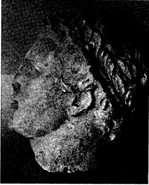
Res. 2 — Portrenin yandan görünüşü.