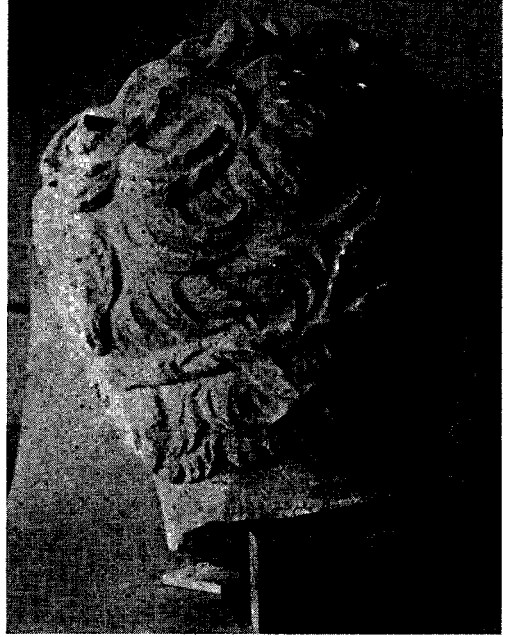
Res. 3 — Portrenin arkadan görünüşü.