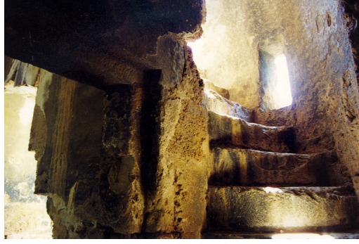
12- Antalya Kaledran Köşkü (Sofalı Tip) Merdiven