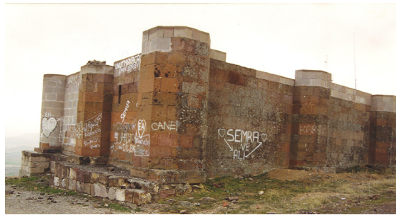
14- Kayseri-Erkilet Hızrilyas Köşkü (Sofalı Tip)