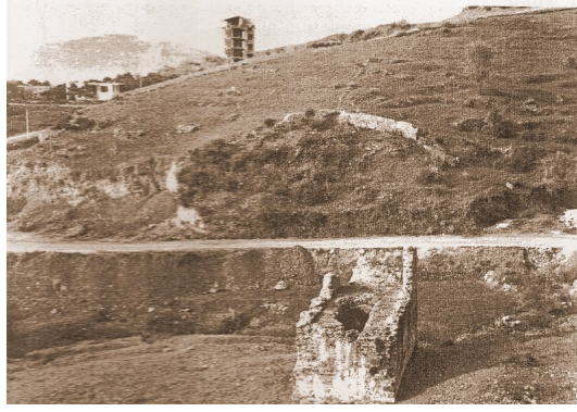
2- Alanya-Hacı Baba Köşkü (Sofasız Tip) Köşk Külliyesinin Çevre Duvarları (S.Redford'dan)