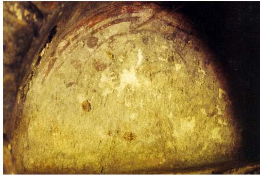
8- Alanya-Sugözü Köşkü (Sofasız Tip) Alt kattaki Sivri Kemerli Nişlerden Detay