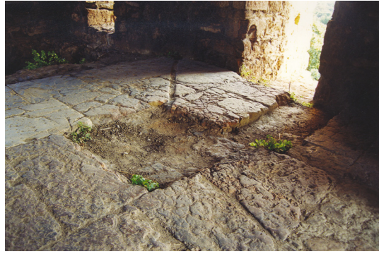
13- Antalya Sedre Köşkü (Sofalı Tip) Üst Kattaki Havuzdan Detay