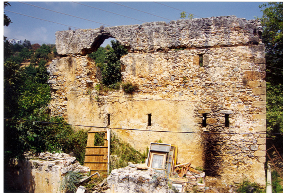
3- Alanya-Gülefşen Köşkü (Sofasız Tip)