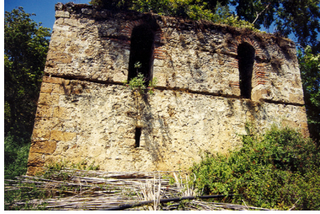
9- Antalya Kaledran Köşkü (Sofalı Tip)