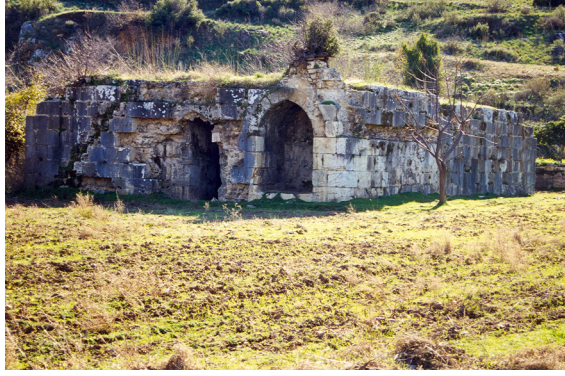
18-Antalya-Gazipaa ikrhone Kk (Mnferit Tip)