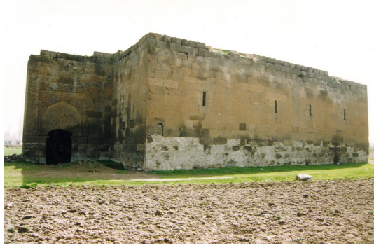
15-Kayseri-Argincik Haydar Bey Köşkü (Sofalı Tip)