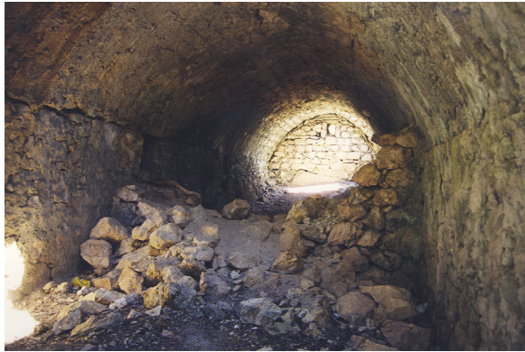
20. Antalya-Alara Kk (Mnferit Tip)