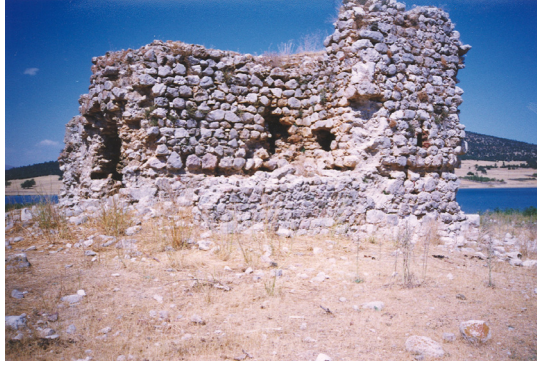
4- Beyşehir-Kilise Adası'ndaki Köşk (Sofasız Tip)