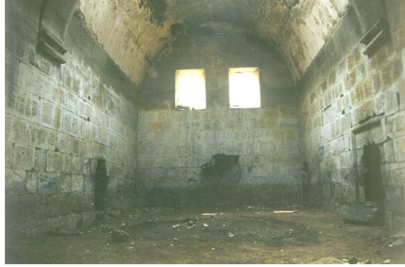
16- Kayseri-Argincik Haydar Bey Köşkü (Sofalı Tip) Sofa