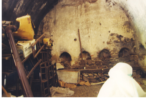
7- Alanya-Sugözü Köşkü (Sofasız Tip) Alt kattaki Sivri Kemerli Nişler