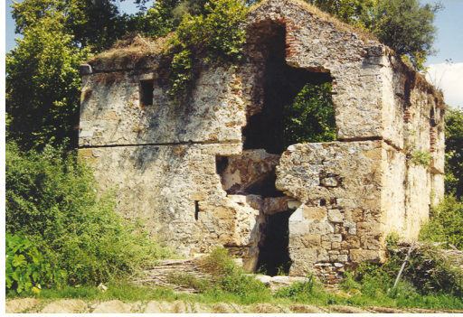
10- Alanya-Kaledran Köşkü (Sofalı Tip)