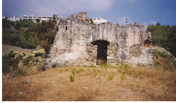
1- Alanya-Hacı Baba Köşkü (Sofasız Tip)