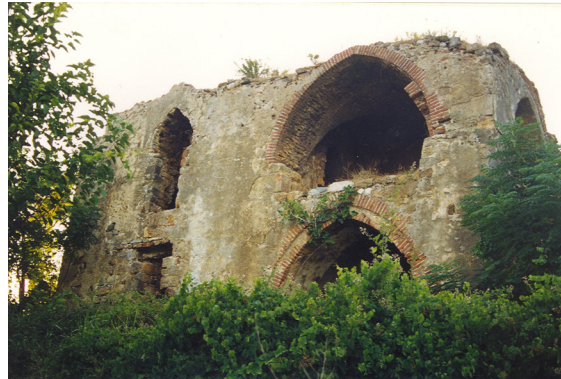
11- Antalya Sedre Köşkü (Sofalı Tip)