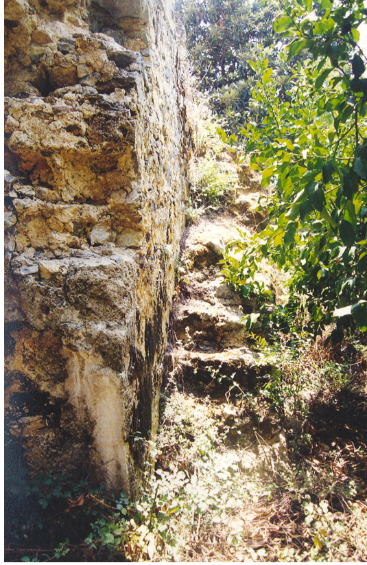
5- Alanya-Güleşen Köşkü (Sofasız Tip) Merdiven.