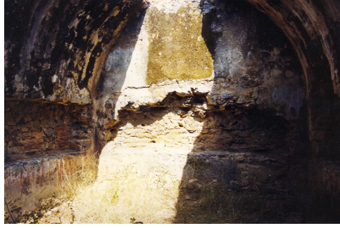
6- Alanya-Hacı Baba Köşkü (Sofasız Tip) Alt kattaki Sivri Kemerli Nişler