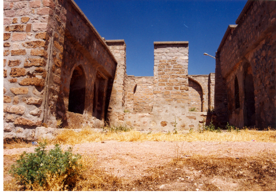
19-Aksaray Kk (Mnferit Tip)