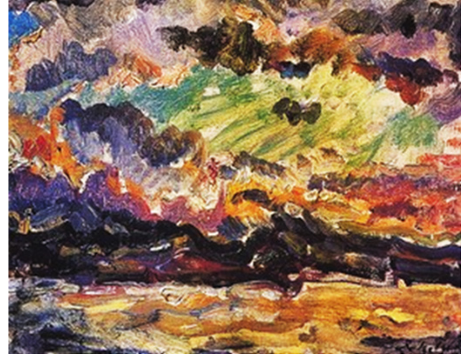
Görsel 1. Zeki Faik İzer, "Büyükada'da Lodos", 1968, Tuval üzerine yağlı boya, 33x40 cm

Zeki Faik İzer eserlerini tanımlayan kavramlar arasında coşku, devinim, ritim ve dinamizm kavramlarını saymak mümkündür. Sanatçının eserlerinde içgüdüsel biçim bozma, gerçeklikten sıyrılma ve gerçekliğin bireysel yorumlanmış haliyle karşılaşılmaktadır. Sanatçı dış gerçeklikte yer alan temel konuları, portreleri, figürleri ya da peyzajları içselleştirerek başka formlara dönüştürmektedir. Yapay ve dekoratif görünen çizgiler yerine rengin araç olarak kullanıldığı eserlerinde Zeki Faik İzer, ruhsal olarak kendini daha dışavurumcu ve dinamik renkler aracılığıyla ifade etmektedir.