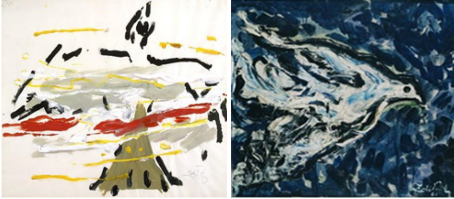
Görsel 7. Zeki Faik İzer, "Kuş" (Solda) Görsel 8. Zeki Faik İzer, "Mavi Kuş" (Sağda)

Görünüşler hakkındaki bilgimiz, sınır olarak görünen her şeyin aşıldığı ve birden bütünün göreliliğini farkettiğimiz bir noktaya eriştiğinde tamamlanmış olur. Nesnelere bilmek, onların özünün en iç çekirdeğine nüfuz etmek demektir, bu iç çekirdekte nesnelere bütün sorunları ile bize kendilerini açarlar (Worringer, 1983:127).