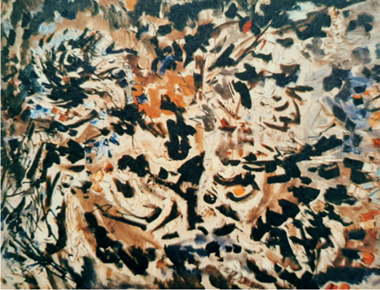
GörSEL 5. Zeki Faik İzer "Kendi Boşluğundaki Kuş"

Soyut, informel ya da lekeci eğilimlerin tümü, sanki onun resminde bileşkesel bir değer kazanmış ve belirli bir amaca doğru kanalize olmuş gibidir. Kendi Boşluğundaki Kuş'u da bu bağlamda yorumlamak gerekir. Renklerin açık-koyu, soğuk-sıcak etkileriyle, birbiri içinde dönendiği, bir merkezkaç gücün etkisi altına etrafa yayıldığı bu kompozisyon, isminden de anlaşılacağı gibi, bir kuşun kendi boşluğunda serbestçe, hiçbir engelle takılmadan, hiçbir korku ya da kuşkuya kapılmadan uçuşu gibi renk beneklerinin, merkezden çevreye yayılan etkilerini, resimsel bir örgütlemeye tabi tutmakta, fırçanın yarattığı soyut izlenimleri genelleştirici bir yol izlemektedir. Bu tür müzikalite duygusu, renklerin ton derecelerine göre tabloda inişli-çıkışlı rezonanslara yol açıyor bu resimde. İlgimiz fırça tuşlarının yönlerine uygun biçimde ya bir çember çizerek geriliyor, ya da açık tonların egemen olduğu zemine doğru iniyor, sonra tekrar koyu tonların bize daha yakın durduğu ayrıntılar üzerinde yoğunlaşıyor. Burada kesinleşmiş ya da önceden saptanmış biçim formülasyonu, resme karışmıyor, aksine her şey kendi doğrultusunda çözüme yönlendirilmiş olmanın spontan etkilerini yansıtıyor(Özsezgin, (t.y.): 120).