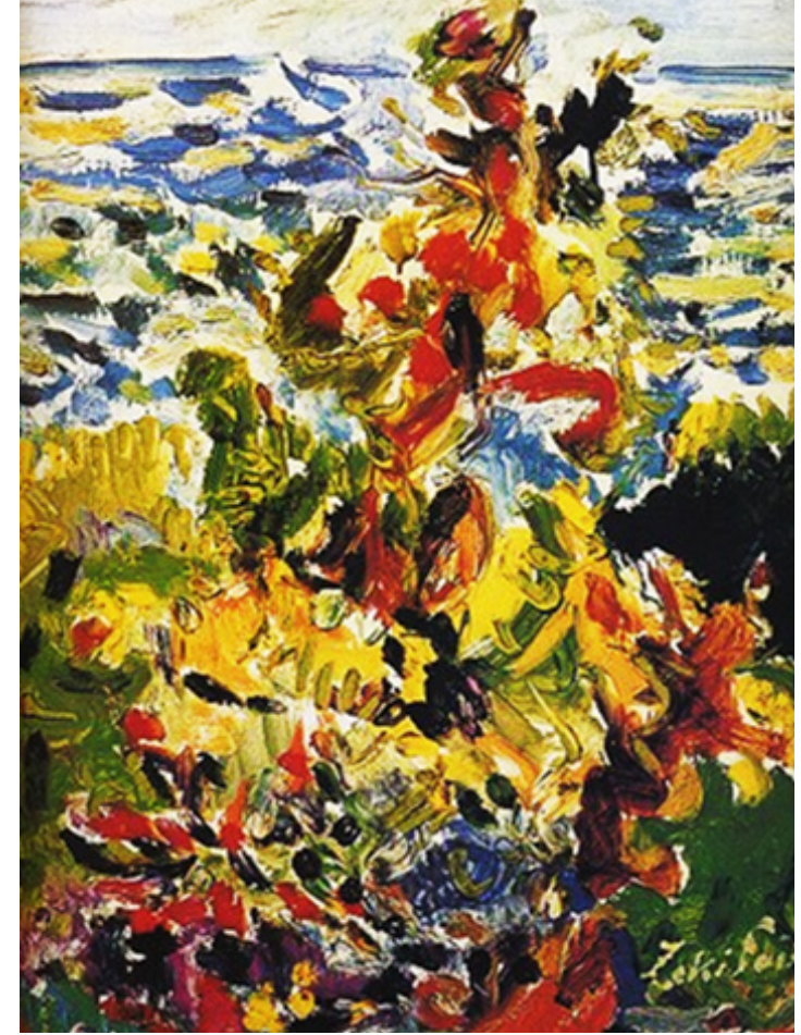
Görsel 2: Zeki Faik İzer, "Büyükada'da Poyrazlı Gün", 1969, Tuval üzerine yağlı boya, 45x38 cm

Zeki Faik İzer resminin temel öğeleri olan çizgi, renk ve leke oluşumunda şüphesiz Akademi yıllarında etkisinde olduğu İbrahim Çallı ve Hikmet Onat'ın izleri de sezilmektedir. Organik olan soyut anlatımlarında ise Matisse ve Bazain etkisinde kalır. Renk araştırmalarında, serbest ve renkçi bir anlayışla, Matisse'in renkçi tavrı, fovistlerin lekeciliği de hissedilmektedir. Ayrıca eserlerde biçimlerin kenarlarında izlenen beyaz boşluklar sanatçının eserlerinin ifadeci ve modern yapısına uyum sağlamaktadır.