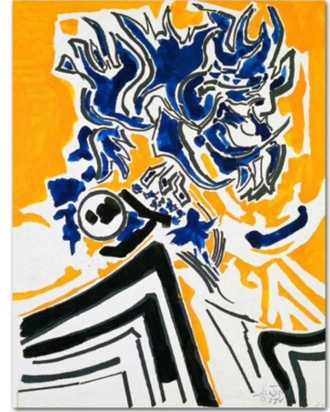
GörSEL 6. Zeki Faik İzer, "Kuşlar"

Lekeci anlayışla, soyut biçimlerin kompoze edildiği, Zeki Faik İzer'in "Kendi Boşluğundaki Kuş" adlı eserinde lekelerin bir araya gelerek kompozisyon oluşturduğu farklı versiyonlarının açık-koyu kontrastları ve kompozisyon ilişkileriyle şekillendiği izlenmektedir. Küçük ve büyük kompozisyon birimleri çizginin iniş çıkışları ve farklı büyüklükteki fırça tuşlarıyla harmanlanmaktadır. Açık ve nötr renklerle zemin rengi ise koyu olan fırça lekelerini öne çıkarmaktadır. Sanatçının diğer eserlerinde karşılaştığımız ritmik, lirik ve dinamik olan fırça hareketleriyle karşılaşılmaktadır (GörSEL 5).