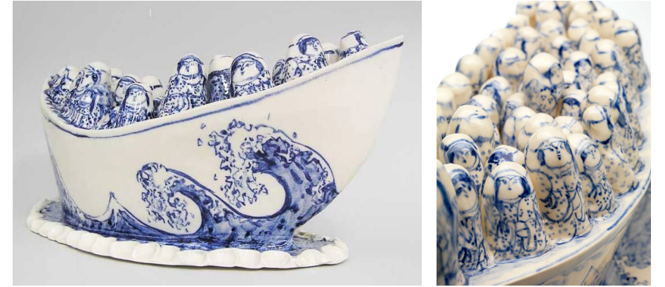
Görsel 3. Gerry Wedd, "Bayan Kayık" ve detay, 2008, sırlı seramik, kobalt bezeme.

Gerry Wedd'in çalışmaları, yıkıcı bir protesto biçimi yaratmak için genellikle baskın mavi, beyaz 'söğüt deseni' ve bilinen imgeler gibi tanıdık temaları konu edinmektedir, Sanat eseri, ilk olarak 2012 yılında "Mülteciler ve Avustralya Göç Müzesi"nde sergilenmiştir. Daha sonra da müze koleksiyonuna kalıcı olarak bağışlanmıştır.