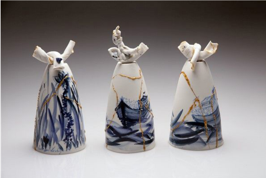
Görsel 10. Betül Demir Karakaya, "Göç Kırıkları" serisinden, 2019

Betül Demir Karakaya, "Göç Kırıkları" isimli sergisinde kişisel deneyimlerinden yola çıktığını belirtmektedir (Görsel 10). Bireylerin yaşadığı kırıklar ve sarsıntıların, insanı insan yapan değerler olduğunu ifade etmektedir. Bu değerlerin sarıp sarmalanması ve dönüşüme uğraması, onları evirerek tekrar insana dair bir kavram olarak nitelendirmektedir. Kırıklar olarak adlandırılan şeylerin, insani değerler olduğunu, izlemek yerine onları ortaya çıkarmak gerektiğini vurgulamaktadır. Sanatçı eserlerinde konu olarak göçün işlendiğini ancak umut dolu bir serüven şeklinde yansıtıldığını dile getirmektedir ( http://betuldemirkarakaya.com/goc-kiriklari/ ).