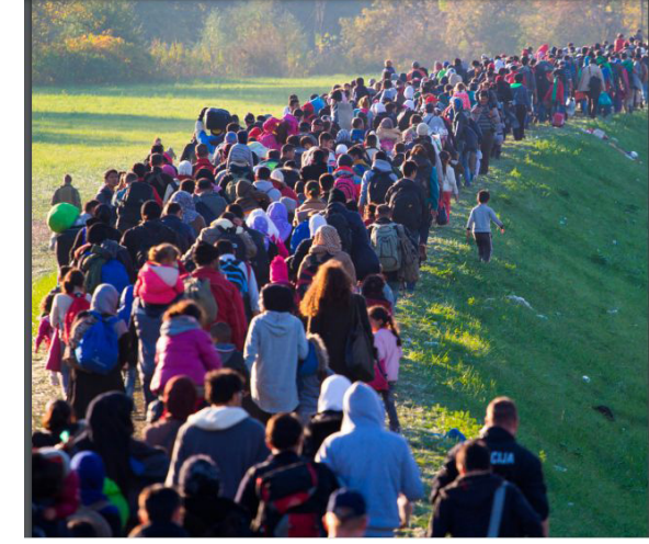
Görsel 1. “Göç Rotası”

Göç sonrasında ise, iki kültür değeri arasında kalan, ancak sonuçta her ikisi de olamayan karma bir insan-mekân türü meydana gelmektedir (Arslan, 2018: 16). Bu durumda zorunlu yer değişiklikleri, sadece kültürel anlamda değil, bireysel olarak da dönüşüme neden olmaktadır. Ayrıca hayattan beslenen göç; sosyolojik, kültürel, ekonomik ve politik birçok alana olumlu veya olumsuz etki ettiği gibi, sanat alanında da önemli bir yer tutmaktadır. Sanatçılar, hem kitlesel hem de bireysel düzeyde ele alınan göç olgusundan bazen doğrudan bazen de dolaylı yollarla etkilenmektedir.