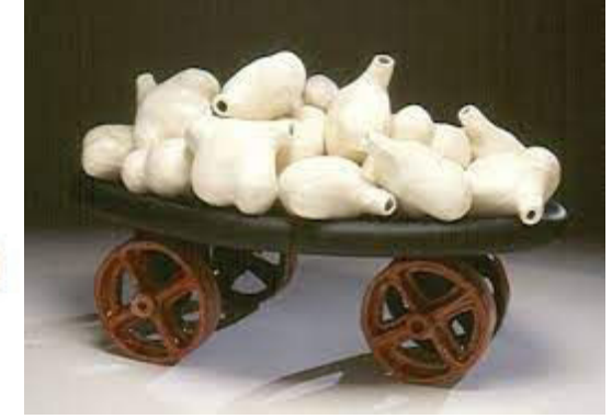
Şekil 6 .Lydia Thompson, "Göç Sonrası Taşıyıcı Serisi", 2020 (Solda)