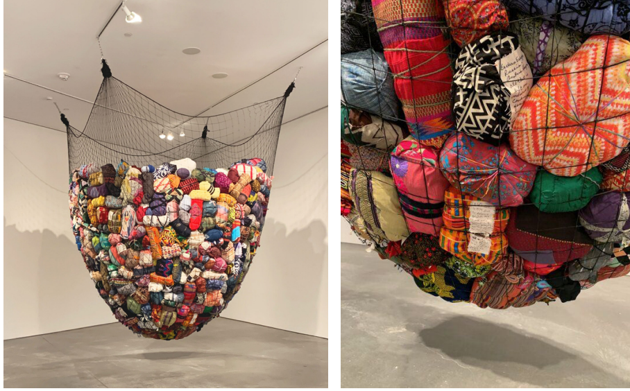
Görsel 2. Yu-Wen Wu "Asılmış" ve detayı, 35x30x30 cm. 2020

yanlarında taşıyabilseler bile, hayatta kalma ihtimali, umutlar, hayaller, geçmiş ve anılar geride kalanlar arasındadır. Dünyanın dört bir yanından toplanılan parlak ve renkli, bazıları yırtık ve eskimiş hikâyelerin bir parçası niteliğindeki eski ve yeni kumaşlar bu projeye malzeme olmuştur. Paketler bittiğinde, katılımcılardan kendi paketlerine bir hikâye veya mesaj yazmaları istenmiş, birçoğu da barış, umut ve nezaket arzularını taleplerini yazılarında belirtmişlerdir.