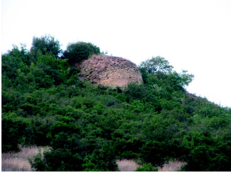
Bapheus'ta Çoban Kale

Osmanlı kroniklerini Bizans kaynakları ile karşılaştırmamız şart. Özellikle, Gregoras'ı ve Kantakuzenos'u kullanmak lazım. Şimdi, diyorlar ki: "Biz de Bizantinist yetiştirelim, bu kaynakları tercüme edip değerlendirelim", ama anlamsız.