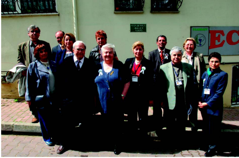
Prof. Dr. Halil İncalcık Sokağı'nın açılışı, Halil Hoca, kızı ve meslektaşları ile 06.04.2006