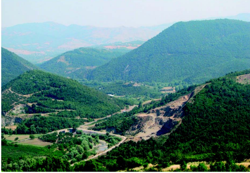
Çoban Kale'den Yalak Ova Vadisi