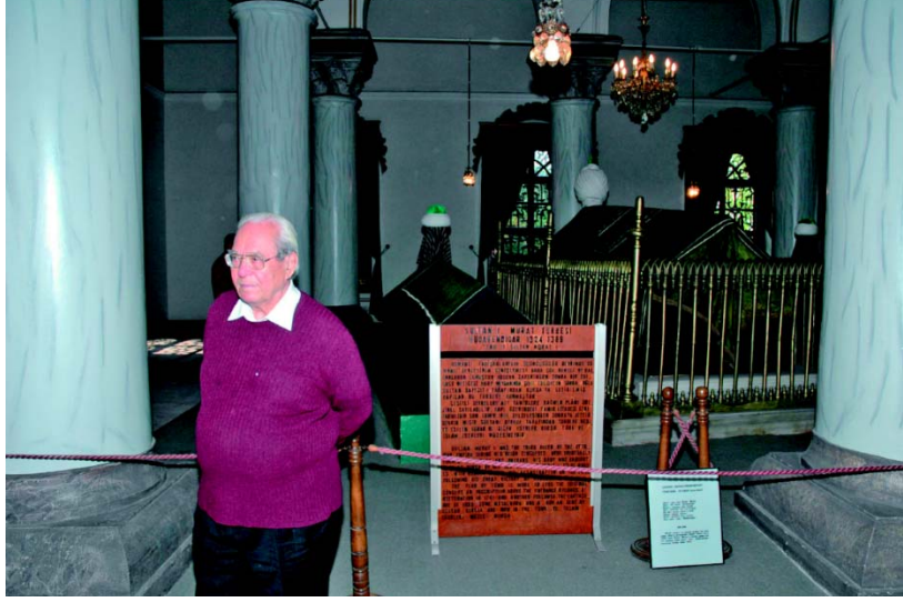
Halil Hoca Murad Hüdavengidar Türbesinde