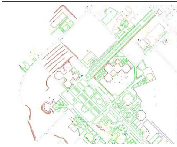
Şekil 2. Test alanı.

Uygulama alanı olarak, Selçuk Üniversitesi Alâeddin Keykubat Kampusu seçilmiştir. Kampus alanı Konya şehir merkezine yaklaşık 20 km. uzaklıkta olup Konya-Afyon karayolu üzerindedir. Kampus alanında yapılaşma kısmen tamamlanmış, çevre düzenleme çalışmaları ise devam etmektedir. Çalışma alanı olarak, CBS oluşturulması için gerekli olan konumsal verilerin elde edilmesi ve karşılaştırmalarının yapılabilmesi için yaklaşık 20 hektarlık bir test alanı seçilmiştir (Şekil 2).