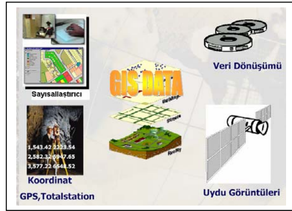
Şekil 1. Konumsal veri toplama yöntemleri.

Veri toplama işlemi, coğrafi bilgi sistemlerinin gerçekleştirilmesinde en fazla zaman alan ve en çok maliyet gerektiren önemli safhalarından birisidir. CBS'de konumsal verilerin toplanmasında kullanılan yöntemler genel olarak; Klasik ölçme yöntemleri, Fotogrametrik yöntemler, GPS ölçme yöntemi, Uzaktan algılama yöntemi, Kartografik yöntemler olarak sıralanabilir (Şekil 1 ).