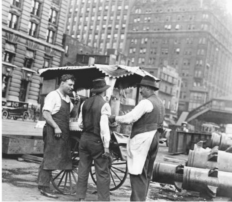
Ek.3. New York'un Suriye mahallesinde yiyecek satışı yapan göçmen bir Suriyeli