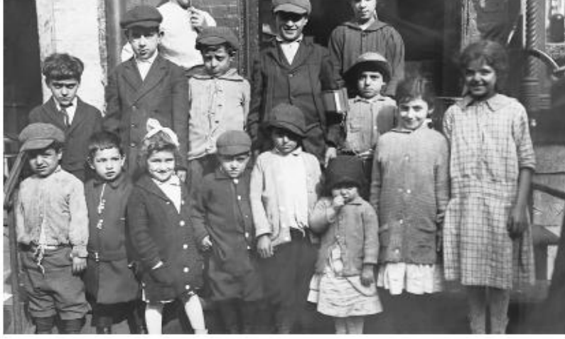
Ek.2. New York'un Suriye mahallesine yerleşen Suriyeli göçmen ailelerin çocukları