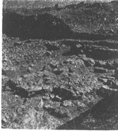
2 — Kuzey yönünde Frig çağı mimarî buluntuları