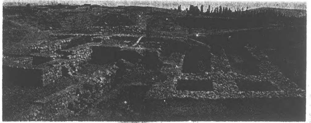
5 — Poternli kapı sol burç, restore edilmiş şekli