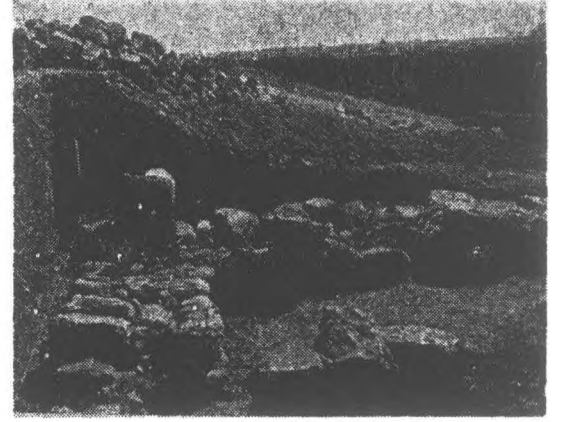
3 — Poternli kapı, sol burç temel duvarların bulunuşu