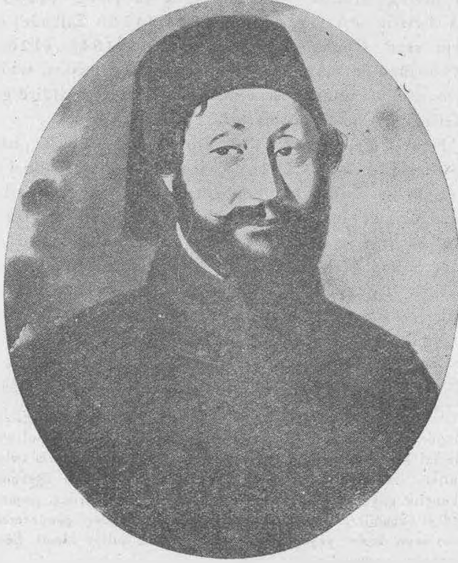
Ahmet Fethi Paşa

Ahmet Fethi Paşa, [1] Paris ve Viyana sefaretlerinde uzun yıllar kalmış Londra ve Moskova'da bulunmuş olduğundan bu memleketlerin san'at ve kültür hareketlerini benimsemiş ve memleketinde bunların tatbiki için her imkândan istifade etmiş, Müsteşarı Saltanat mevkiini kazanmış [2] bulunmakla da fikirlerini hükümdara ve alâkalılara kolayca kabul ettirebilmiştir.