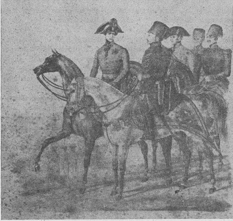
Ahmet Fethi Paşa Viyana sefiri iken ( Gravür Topkapı Sarayı Müzesindedir No. 427 )

1837 (1253 - Rebiulahır) iptidalarında uhdesine Paris Sefareti ile beraber Aydın Eyaleti verilmiş, bir ay kadar Aydında bulunduktan sonra