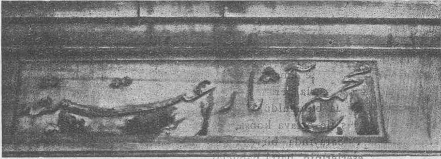
Cebahanede (St. Iréne) kurulan müzelerin kitabeleri

lüğünü tebarüz ettiriyor. Buda, Paşanın hal tercümesi incelendikçe, pek güzel anlaşılıyor.