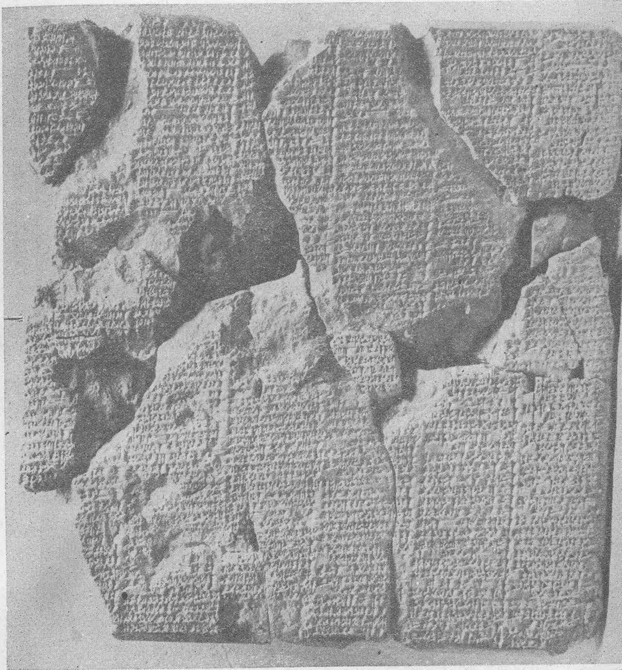
Resim 11: Oniki sütünlu «Enmerkar» tabletinin yüzü (2/3) Figure 11: Obverse of twelve - column «Enmerkar» tablet