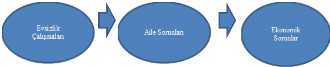
Şekil 2: Evsizliğin sebepleri

Araştırmalar farklı tema başlıklarını içermesine rağmen, bulgular evsizliğin Türkiye’de iki temel sebebi olduğunu ortaya çıkarmaktadır. Bu sebepler şekil belirtildiği gibidir.