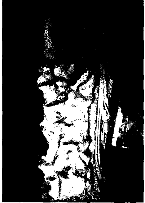
Resim 2 : Yaslanan Müz, arkadan