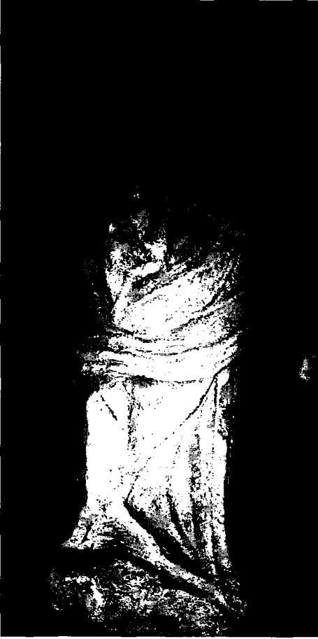
Resim 1: Yaslanan Müz, ön cepheden