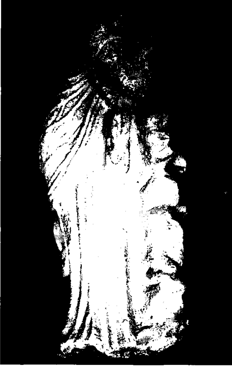
Resim 3: Yaslanan Müz, sağ yandan