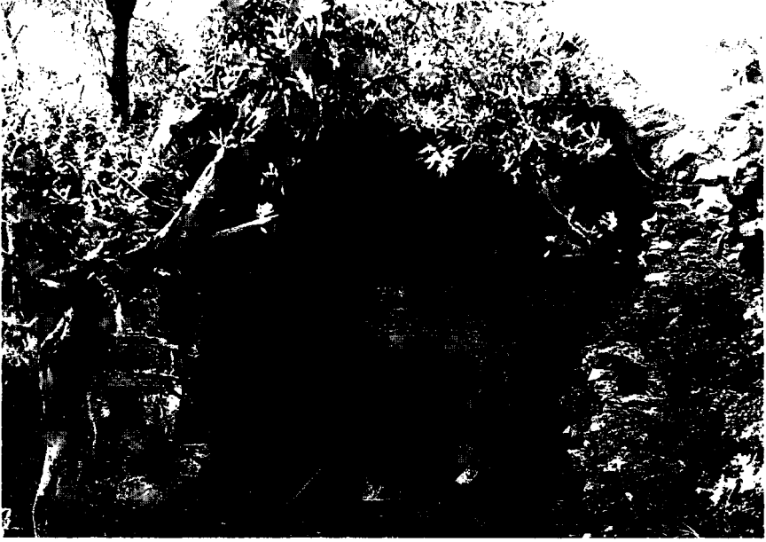
Resim 15: Anıt mezar ön odası