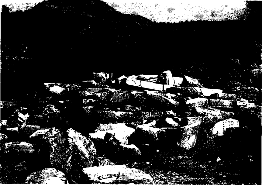
Resim 3: Tapınak