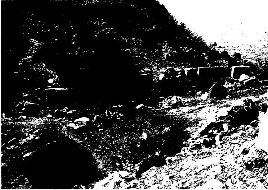
Resim 6: Liman Caddesi