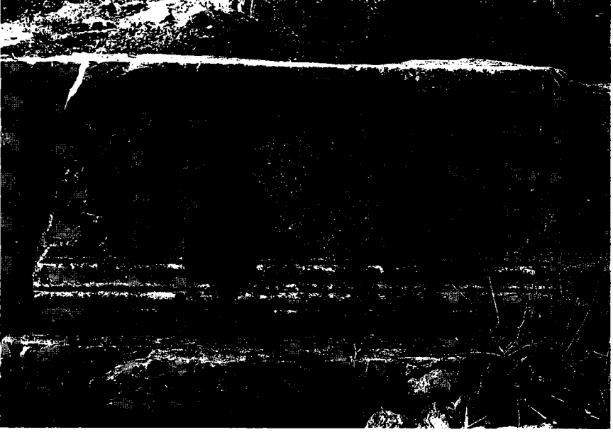
Resim 7: Yazılı kaide