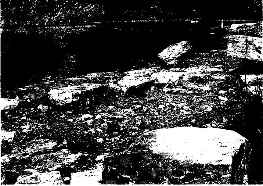
Resim 5: Tapınak