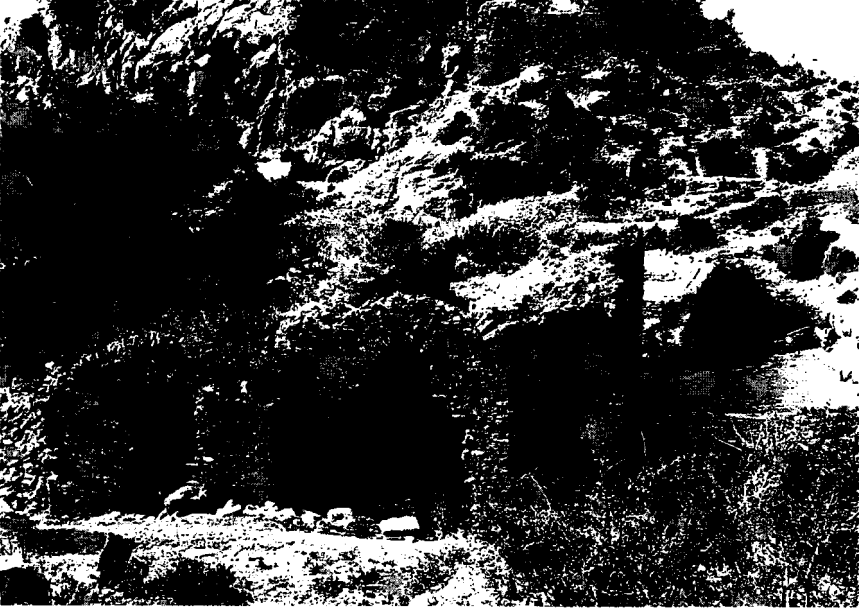
Resim 11: Hamam