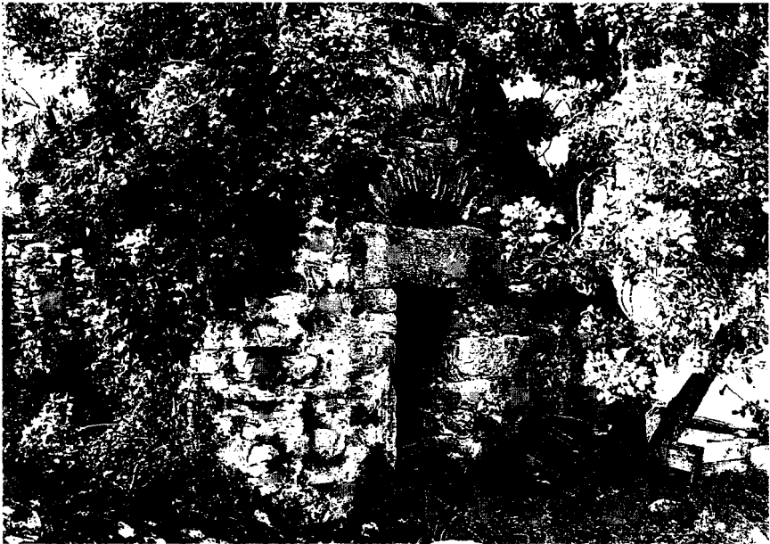
Resim 16: Anıt mezar giriři