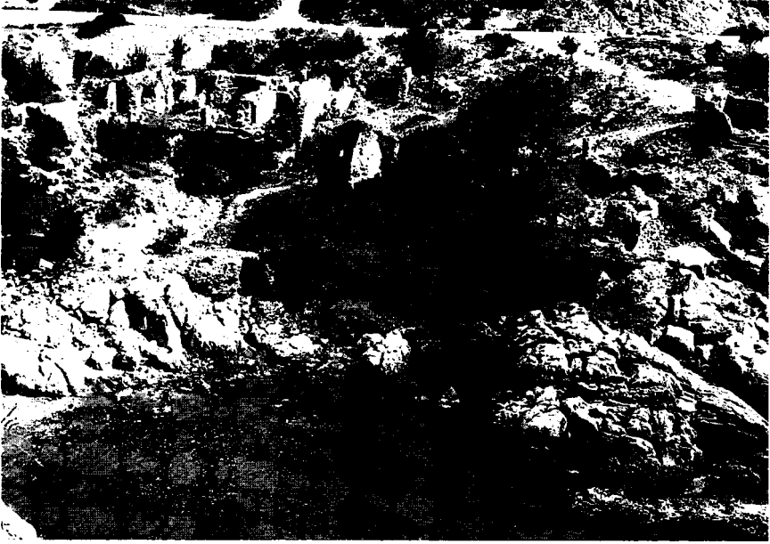
Resim 1: Küçük Liman ve antik yerleşim