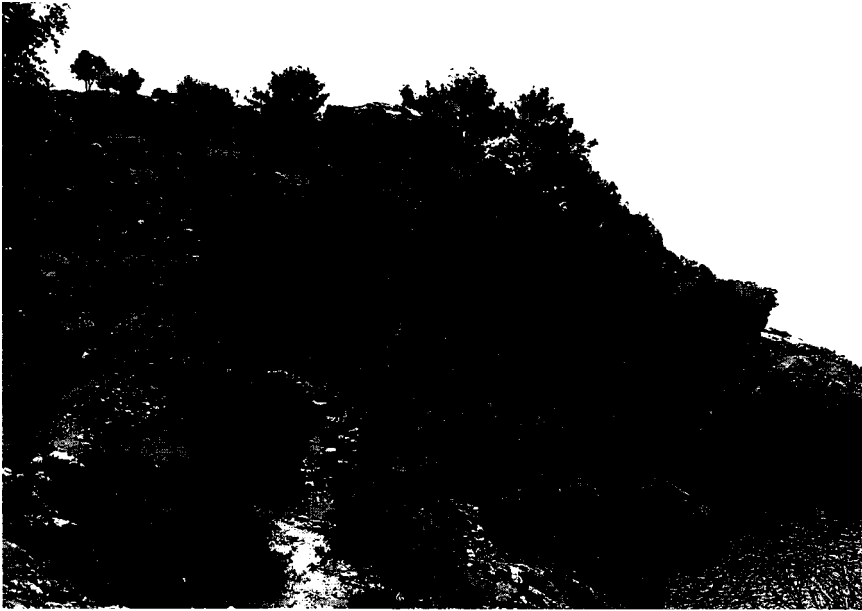
Resim 10: Hamam