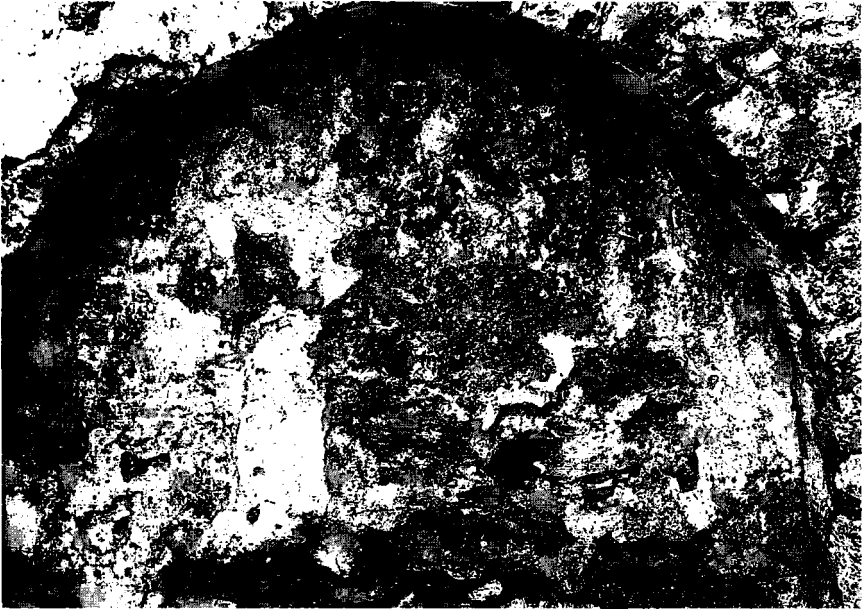
Resim 9: H.G. Stratelates'i betimleyen fresk