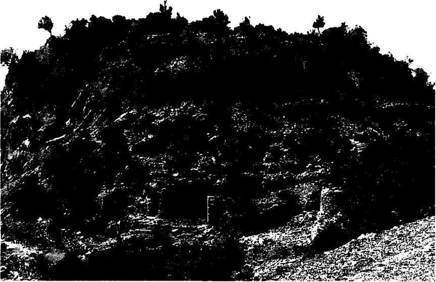
Resim 2: Akropol