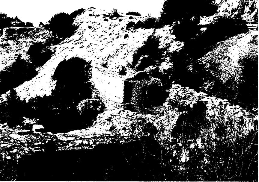
Resim 8: Şapel