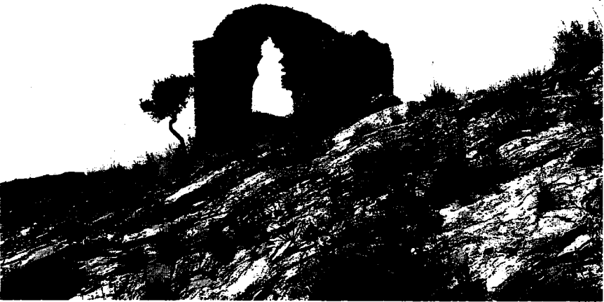
Resim 12: Anıt mezar