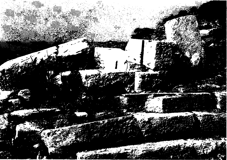
Resim 4: Tapınak