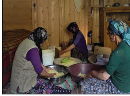
Fotoğraf 10-11: Cancır yaylasında memtevrilerin topladığı Sazgirel mevkii ve imece ile peynir tepme.

tevrilerin (yaylacı kadınların) tatili yok. Hayvancılık, maaşı olmayan kadınlar için bir güvence oluyor, sığırlar iyi para ediyor. Elden ayaktan düşenler büyükbaş hayvanları satıyor. Satılan hayvanların ücretini erkekler, sütün parasını kadınlar alıyor şeklinde ifade etmiştir.