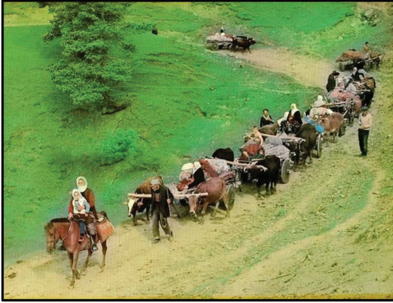
Fotoğraf 5: Kayadibi Köyünde yaylacıların yaylaya çıkışı (Şavşat, 1980)

En yeni elbiselerini giyerler ve kızaklarını hazırladıkları eşyaları yükler, iplerle sıkı sıkıya bağlar ve öküzleri kızaklara koşarlar. Ailenin şaşortu süslenmiş atına biner ve öne geçer. Köy meydanında toplanmaya başlanılır. Her ailenin önünde at üstünde şaşort, arkasında kızağı ve öküzleri yöneten aileden bir kişi, kızıağın yanlarında ve peşinde ellerinde ev eşyaları ile diğer ev halkı yürür. Yürüyemeyecek durumdaki yeni doğmuş kuzu ve danalar şaşortun heybesine konur. Yayla evine yerleştikten sonra şaşort ve yardımcılarının dışındakiler köylerine dönerler.”