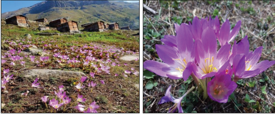
Fotoğraf 14-15: Karçal dağları yaylalarında güz çiğdemleri, şaşortkovan, ( Colchicum speciosum ).

linde yorumlanan bu çiçek, yöreden yöreye değişen çeşitli adlara sahiptir. Artvin yöresinde güz çiğdemleri vargit , nenekovan , nenekaçıran , yaylabozan , göç göçüren , yaylakovan , yayla kaçıran , gastrumla ( kastrumla ) (Şavşat), Galeden (Yusufeli) olarak adlandırılmaktadır. Anadolu'daki diğer yerel adları ise Güzçiğdemi, Göçkovan, Öksüz çiçeği, Kalkgit, Acıçiğdem, Ayı çiğdemi şeklinde dir. 23