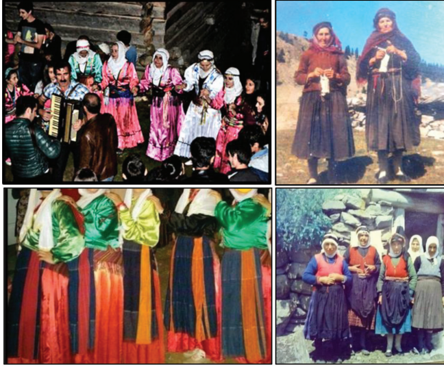
Fotoğraf 6-7-8-9: Cancır yaylasındaki Marioba şenliğinde giyilen geleneksel kadın kıyafeti (sol üst); Ardanuç ve Şavşat yöresinde kullanılan peştemalli şaşort giyimi (sağda); Ortaköy (Berta) köyünde geçmiş dönemlerde kullanımı görülen geleneksel giyim unsurları 20

“Şaşort ninenin binmesi için atını hazırladılar. Ata binmeyi oda ninesinden; annesinden öğrenmiş. Gençliğinde ata çıplak, eyeri olmadan biner sürerdi. Gelin olarak ata binip gitti. Gelinlerini istemeye atla gitti. Tek başına kocasının pantolon ve ceketini giyip erkek görünümü ile ormana gitti. Kaybolan malları aramak için ayıdan, kurttan korkmadı. Bu yolları hayatı boyu ezberle biliyordu. Bokelt çayırına indi mi şaşortlar, tekrar atlara binerek yaylaya kadar yolculuk başlardı. Kayabaşı’ndan gelen bütün şaşort nineler birleşip bir süvari alayına benzer atlı oluşturarak Hanlı köyünün köprüsüne kadar atlar ve bazen de tayları ile birlikte elliye yakın atla birlikte yavaş yavaş, sohbet ederek yolculuklarına devam ederlerdi. Yaylaya tam yerleşince küçük torunlarını pancarcı zamanında yanlarına alırlardı. Yaz boyu her gün gökteki bulutu takip ederlerdi. Köyün semalarında yağmur yağması için dua ederler.”