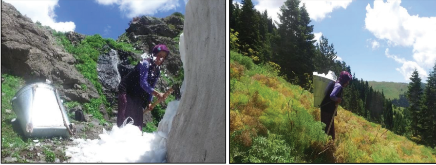
Fotoğraf 12-13: Yaylacı kadının kürtükten kar taşınması, Cancır Yaylası.

güçleştirmektedir. Yaylacılar, kış dönemi boyunca kuru otlarla beslenen hayvanları ilk kez otlağa çıkardığında çiy var ise yaş ot hayvana dokunacağı için hayvanlar kısa süreli otlatılıp kuru otlarla beslenmektedir.