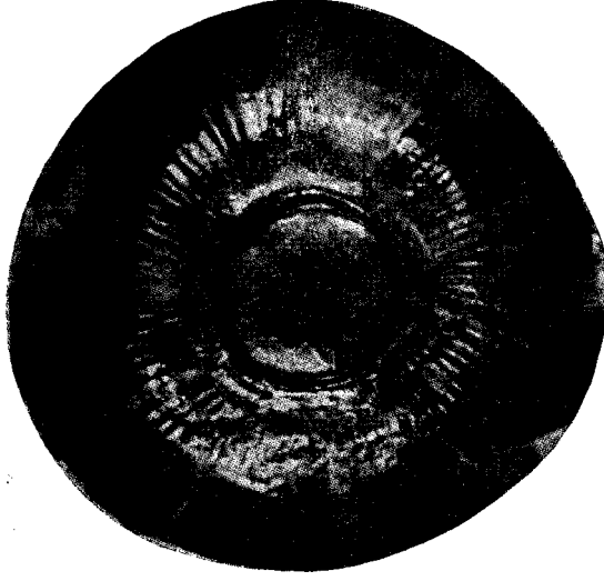
Res. 5 — Restore edilmiş tunç phiale