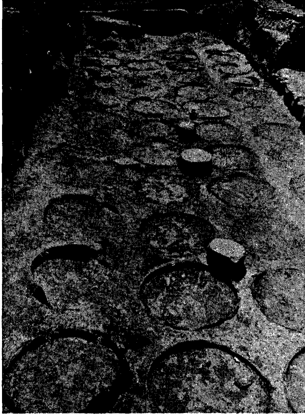
Res. 1 — Büyük erzak deposu (dođu)