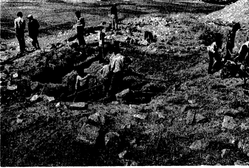
Res. 3 — Yukarı Kale tapınağı çalışmaları