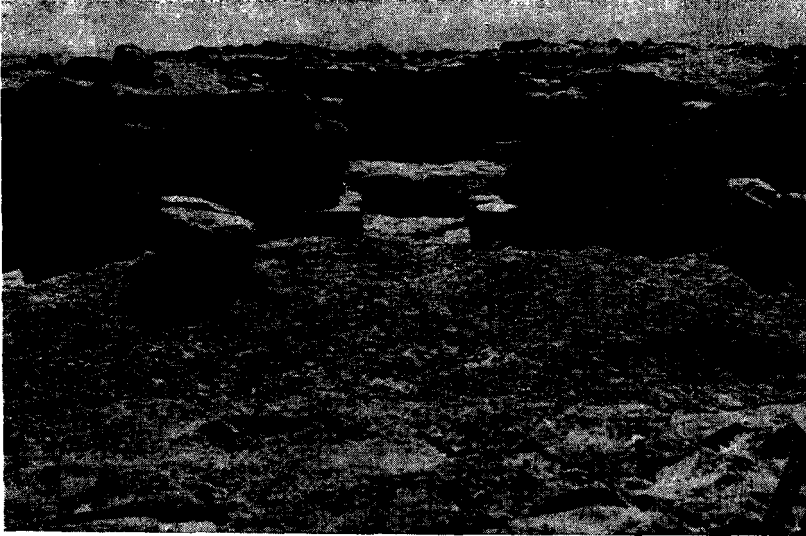
Res. 4 — Yukarı Kale Toprak Cephesi